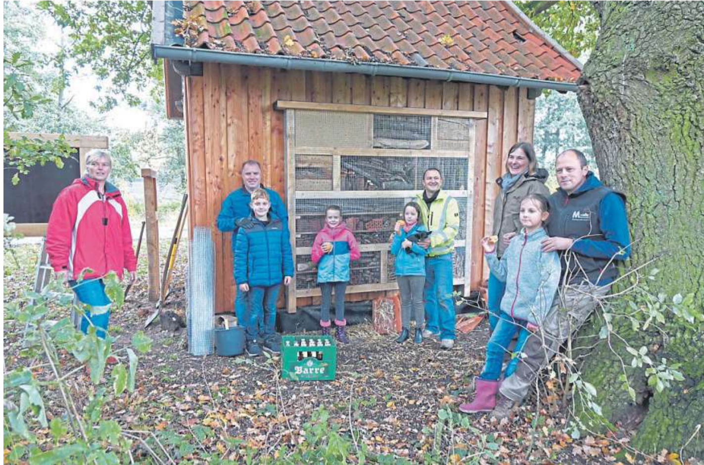
Den Rastplatz verschönerten Kinder und Eltern nachhaltig.

HEEMSEN. Der für den 30. November geplante Adventsnachmittag vom DRK Heemsen findet aufgrund der Corona-Pandemie nicht statt. DH