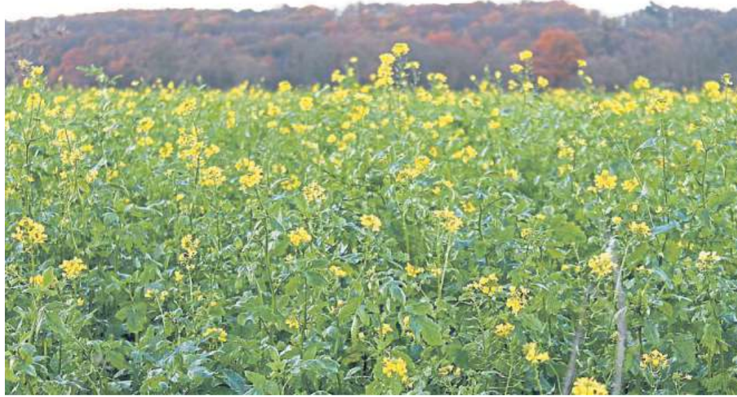
Wie hier in der Marsch bei Binnen blüht derzeit der Gelbsenf auf vielen Feldern.

www.vorlesetag.de www.einfachvorlesen.de