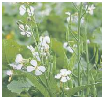
Auch Ölrettich blüht noch im Herbst.

Als Zwischenfrüchte werden Feldpflanzen bezeichnet, die zwischen anderen zur Hauptnutzung vorgesehenen Kulturen angebaut werden. „In der Regel dienen sie zur Gründüngung, also zur Bodenverbesserung, seltener werden sie als Tierfutter genutzt“, erklärt der Leiter der Bezirksstelle. Hier in der Region finde der Anbau überwiegend vor dem Maisanbau oder der Bestellung mit Zuckerrüben statt. Meyer zu Vilsendorf: „Zwischenfrüchte