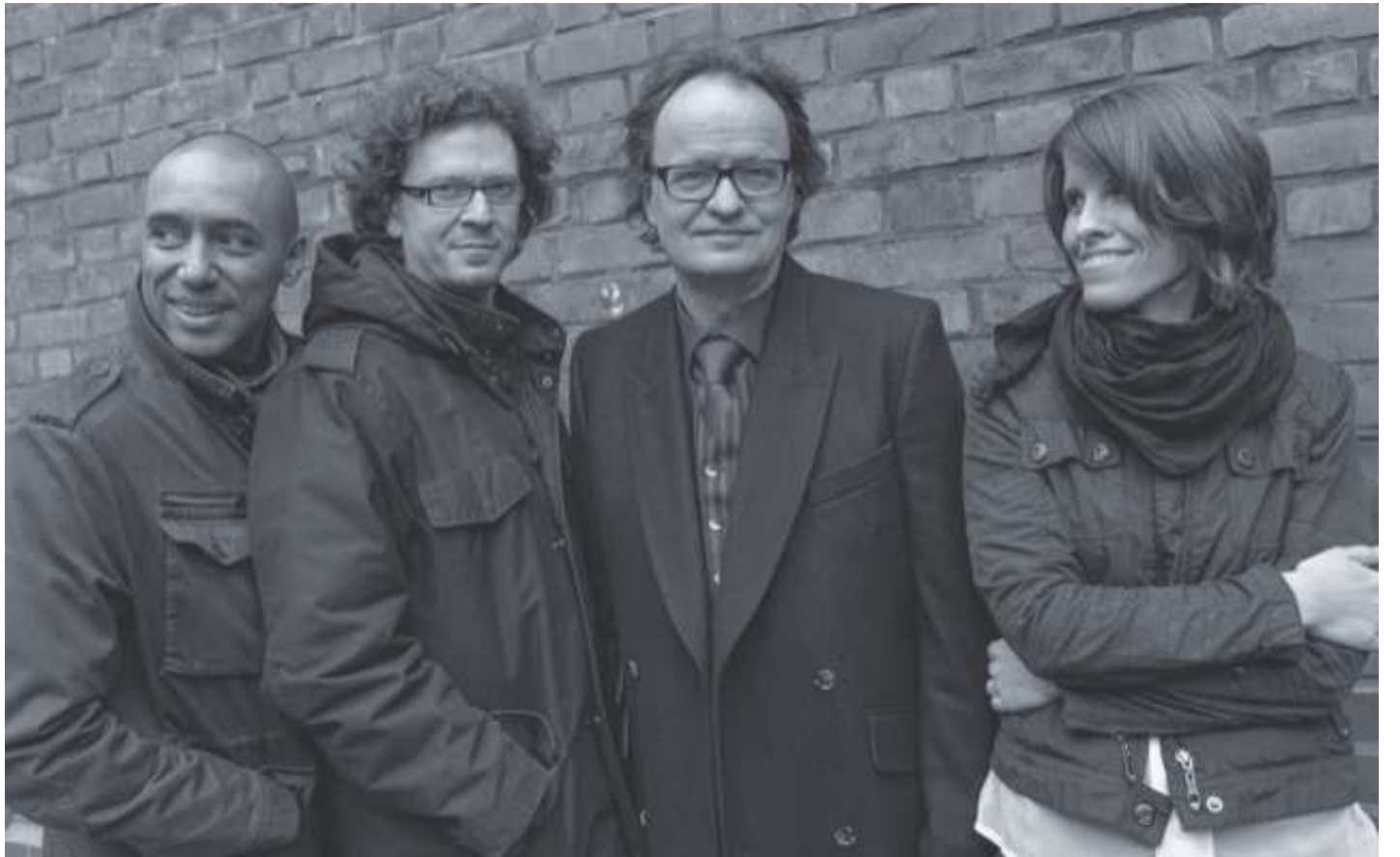
„Bo Heart and Friends“ treten auf.