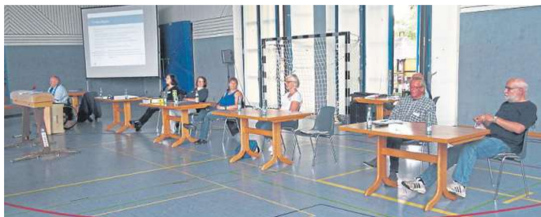
Der TKW-Vorstand verteilte sich großzügig in der Leintorhalle.