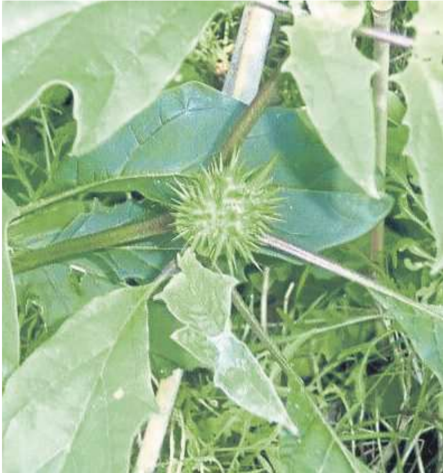
Der Stechapfel ist giftig, kann aber von Experten Verwendung finden.