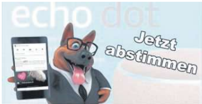
Aus deinem Verbreitungsgebiet Jetzt abstimmen!

Sie kennen das Lokalportal nicht? Schauen Sie einfach mal unter www.lokalportal.de rein! Für User ist es kostenlos.