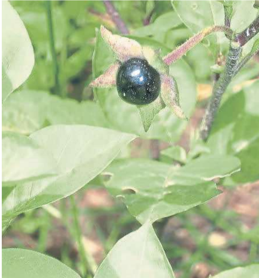
Auch von der Tollkirsche sollten Laien die Finger lassen.