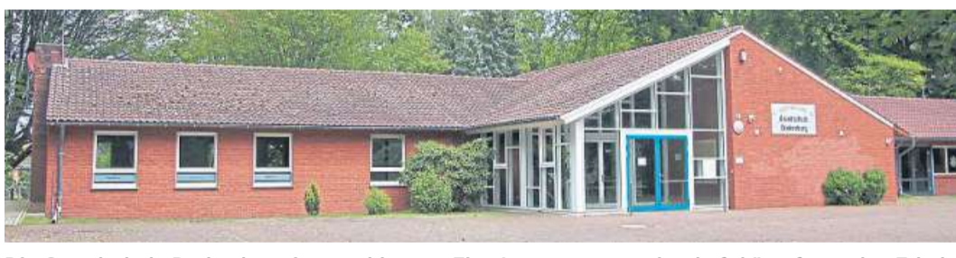
Die Grundschule Drakenburg ist geschlossen. Eine Interessengemeinschaft kämpft um den Erhalt der Einrichtung.

Die Initiative weist außerdem darauf hin, dass in diesem Jahr 95 Prozent der Lehrerstellen an Niedersächsi-