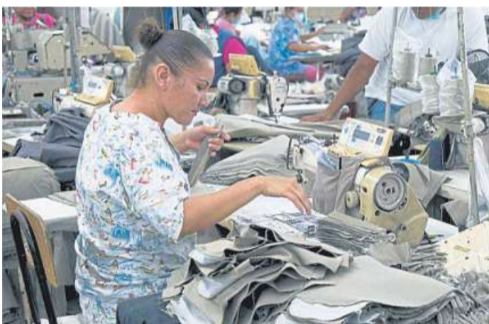
Im Jahr 2020 unterstützt der Kirchenkreis Stolzenau-Loccum die Organisation MEC und dadurch Arbeiterinnen in Textilfabriken in Nicaragua.