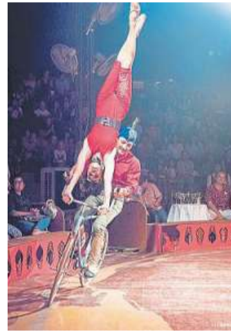
Kunstradfahren gehört auch dazu.

Der Tournee-Plan sieht wie folgt aus: In Landesbergen wird vom