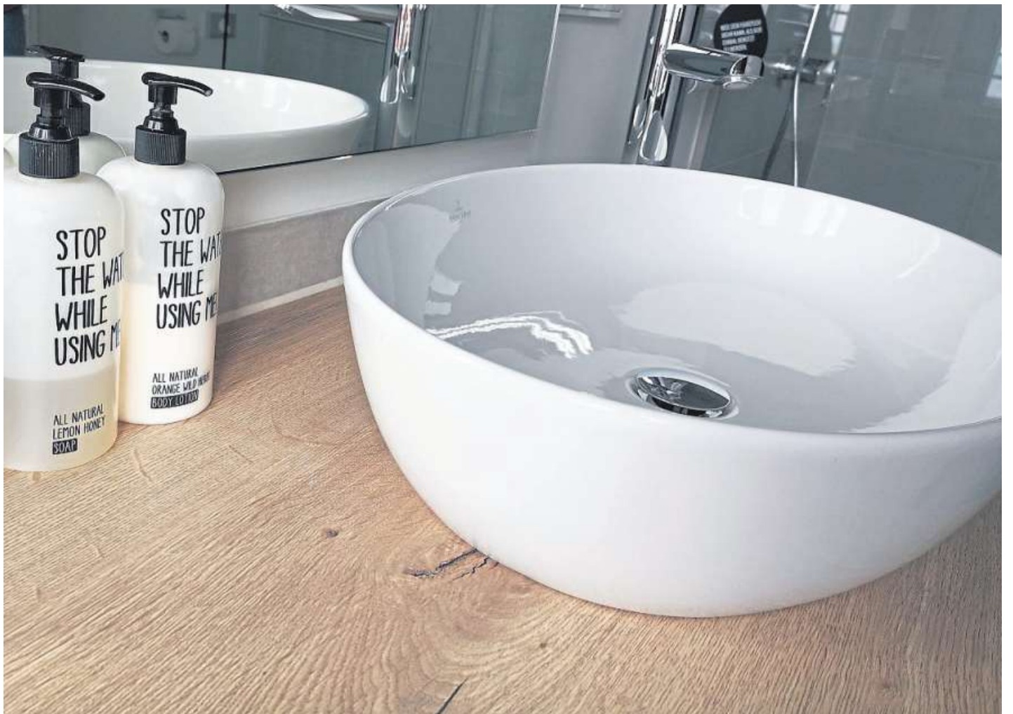
Stop the water while using me: Ressourcen schonend zu reisen ist gar nicht so kompliziert.

Neben einer regelmäßigen CO2-Zertifizierung wird aber auch vorgesehen, dass die Hotels für den täglichen Gebrauch ausschließlich Recycling-Papier benutzen und ihren Strom aus erneuerbaren Energiequellen beziehen. Es wurde hier also wirklich an alles gedacht, um die Hotellerie so klimafreundlich und ökologisch wie möglich auf-