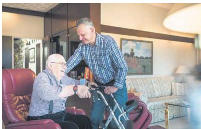
Family Service trotz(t) Corona Rundumbetreuung konnte durchgehend gewährleistet werden

Das Coronavirus hat das Leben von uns allen verändert! Allerdings mit sehr großen Unterschieden, der eine muss nur auf etwas Luxus verzichten, der andere um seine berufliche Existenz bangen. Zu den besonders betroffenen gehören u. a. alte und kranke Menschen, das Pflegepersonal wird in ihrer schweren Arbeit, die der Beruf mit sich bringt, zusätzlich belastet. Beim Family Service der Raiffeisen Agil Leese kümmern sich 50 Mitarbeiter*innen deutschlandweit Tag und Nacht um betreuungsbedürftige Menschen im häuslichen Umfeld. Durch panische Grenzschließungen, Kontakteinschränkungen, Shutdown, Aufnahmestopp in Alten- und Pflegeheimen wurde praktisch über Nacht ein zusätzlicher Pflege-notstand erkennbar. Auch die Betreuungskräfte aus Leese waren betroffen, da die Frauen und Männer aus Polen anreisen. So war zunächst große Unsicherheit bei den betroffenen Familien sowie beim Personal zu spüren, wie wohl die Situation in den Griff zu be-