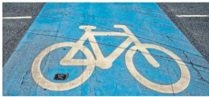
Im Lokalportal läuft die „Dein Wunsch für...“-Aktion noch bis zum 14. Juni.

gleich aber behutsam wieder hochgefahren wird. Im Lokalportal hat sich eine Gruppe für Sportschützen gegründet. Dort kann jeder Verein, der Sportschießen anbietet, seinen Verein und seine Angebote vorstellen. Natürlich kostenlos, lediglich eine Anmeldung im Lokalportal ist erforderlich. In der Gruppe Fotografie im Landkreis Nienburg gibt es Challenges. Ein Mitglied der Gruppe sucht sich ein Thema aus – und dann