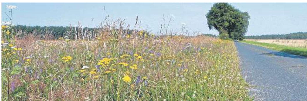
Ungemäht: Auch aus Sicht des Landkreises ein perfekter Seitenrand.

„Weil die Wegeseitenränder vielen Tier- und Pflanzenarten als Rückzugsort dienen, leisten sie einen immer wichtiger werdenden Beitrag zum Erhalt der heimischen Artenvielfalt“, schreibt der Fachdienst in einer Pressemitteilung. Auch der Gesetzgeber hat sich mit dieser Thematik beschäftigt und im Bundesnaturschutzgesetz klare Regelungen zum Umgang mit Wegeseitenrändern geschaffen. So ist es beispielsweise verboten, wild lebenden Tieren, die zu den besonders geschützten Tierarten gehören, nachzustellen, sie zu fangen, sie zu verletzen oder ihre Entwicklungsmöglichkeiten in der Natur zu beschädigen oder zu zerstören.