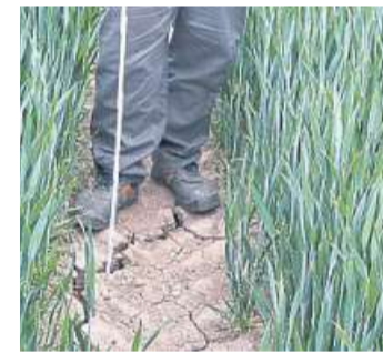
Die Risse im Boden sind bis zu 70 Zentimeter tief.