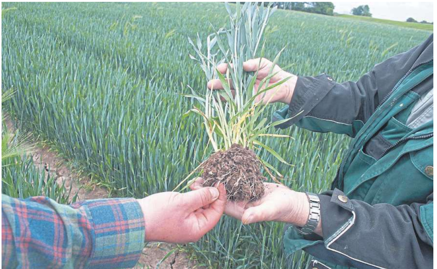
Wenn die Bodenprobe in der Hand zerbröseln, ist es definitiv viel zu trocken. In Magelsen sorgt man sich um die Getreideernte 2020.

Risse im Boden bis zu einer Tiefe von 50 bis 70 Zentimetern. „Wenn der Boden aus 60 Zentimetern Tiefe nicht mehr knetbar ist, dann haben die Pflanzen kein verfügbares