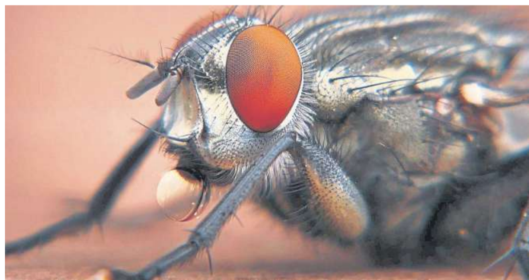
Traumhafte Fotos wie dieses von Fred Schulenberg aus der Samtgemeinde Grafschaft Hoya finden sich im Lokalportal auch.