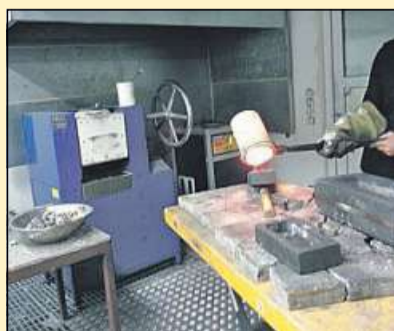
Eigene Schmelzöfen minimieren Kosten bei Der GOLDMANN

Schnell, diskret und unkompliziert Ihre erste Adresse für Goldankauf in Nienburg