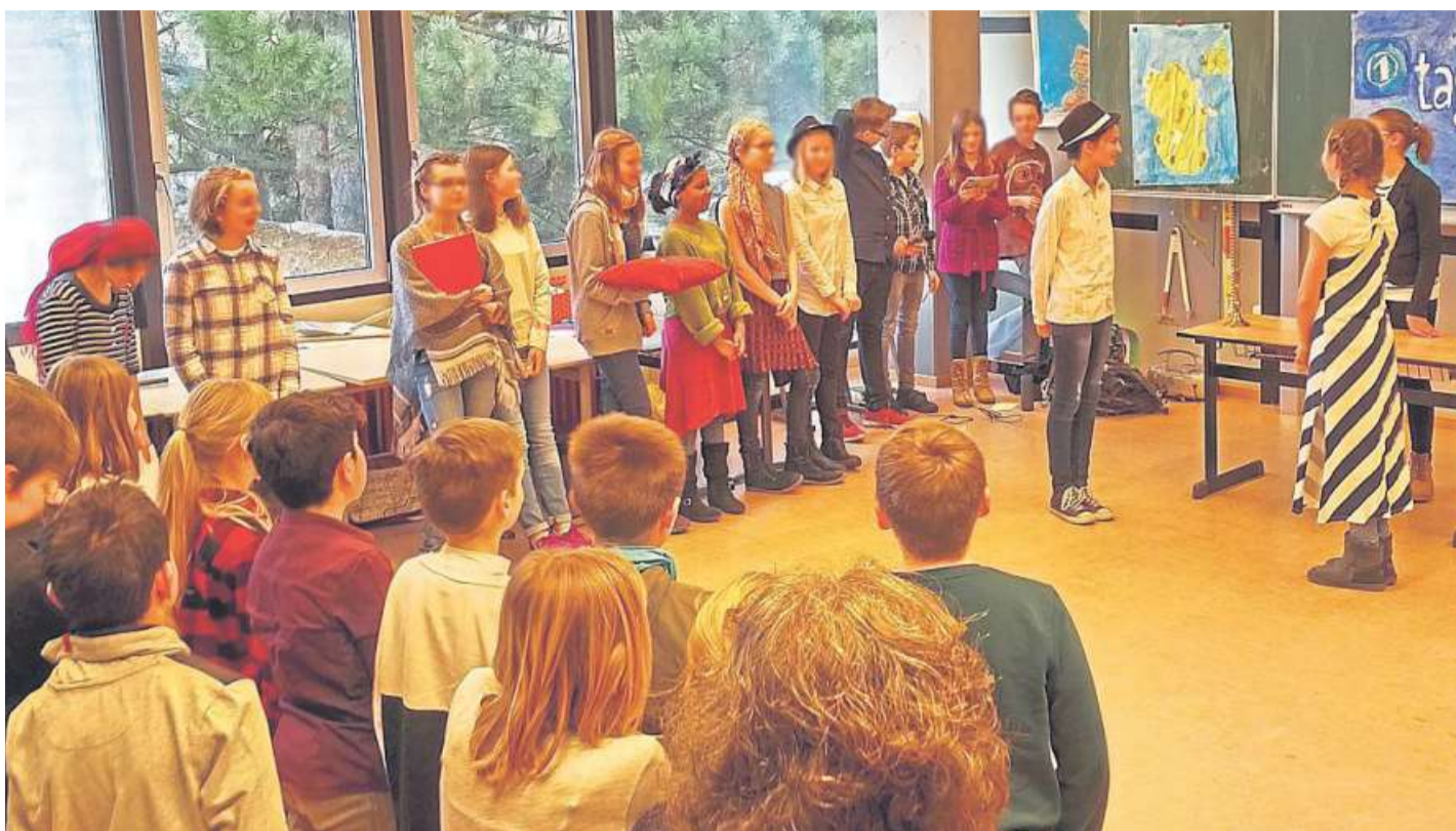
Die Albert-Schweitzer-Tage, die die Sechstklässler für die Fünftklässler veranstalten, haben an der ASS gute Tradition.

Realer Schnupperunterricht und Tag der offenen Tür werden durch digitale Präsentationen ersetzt