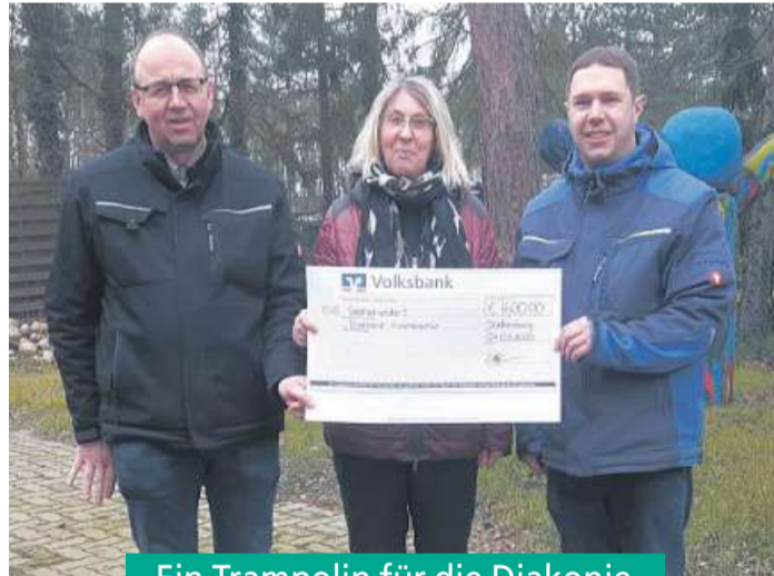
Ein Trampolin für die Diakonie