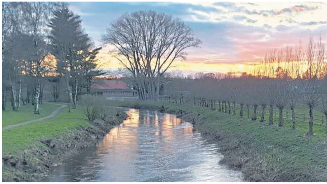
Sonnenuntergang an der Aue. So könnte ein Motiv für den Lokalportal-Fotowettbewerb Landschaften aussehen.

NIENBURG. Das Museum Nienburg mit den Standorten Fresenhof, Quaet-Faslem-Haus und Spargelmuseum sowie der Bibliothek bleibt aufgrund der aktuellen Ausbreitung des COVID-19 für den Besucherverkehr weiterhin bis einschließlich 3. Mai geschlossen. Alle Veranstaltungen in diesem Zeitrahmen fallen aus. Für die Vorträge werden bereits Ersatztermine in der zweiten Jahreshälfte gesucht, das Museumscafé wird zum frühestmöglichen Zeitpunkt eröffnen. Außerdem plant das Museum Nienburg, die aktuelle Sonderausstellung „Kalte Zeiten – warme Zeiten. Von Mammuten und Motoren“ zu verlängern, um den durch die Schließung entstehenden Schaden möglichst gering zu halten. Das Museum bleibt weiterhin von Dienstag bis Donnerstag von 10 bis 16 Uhr unter 05021-12461 erreichbar. Unter www.museum-nienburg.de sind alle aktuellen Entwicklungen zu finden. Außerdem bietet das Museum auf seiner facebook-Seite in kurzen Filmen regelmäßige Blicke hinter die Kulissen. Museumsleiterin „Die Arbeit geht ja weiter und wir hoffen, wie alle anderen Kultureinrichtungen auch, dass unsere Gäste nach der Krise wieder zu uns kommen“, so Museumsleiterin Dr. Kristina Nowak-Klimscha. DH