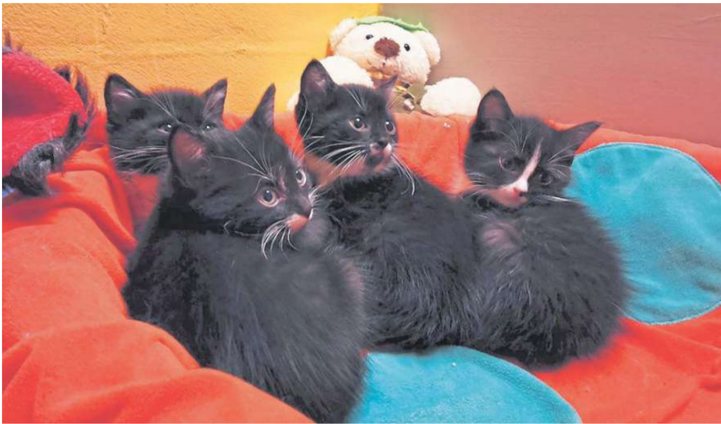
Das Foto zeigt vier verwaiste Katzenkinder, die Ende November in einem Karton neben einem Papiercontainer in Stolzenau ausgesetzt worden waren.

Warum das Tierheim über Weihnachten keine Tiere vermittelt, sich aber über Tierpaten freut