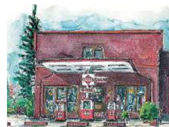
Die Tankstelle Bruchhausen-Vilsen, festgehalten von Isa Fischer. FOTO: FISCHER

zeichnungen aus dem Buch sowie weitere Arbeiten aus der Region. Denn von Syke bis Verden, von Bruchhausen-Vilsen bis Etelsen, von Hoya bis Heiligenrode gibt es romantische Wassermühlen, gastliche Hofcafés, herrschaftliche Schlösser, imposante Windmühlen und andere historische Gebäudekomplexe, die zum näheren Hinsehen inspirieren. DH