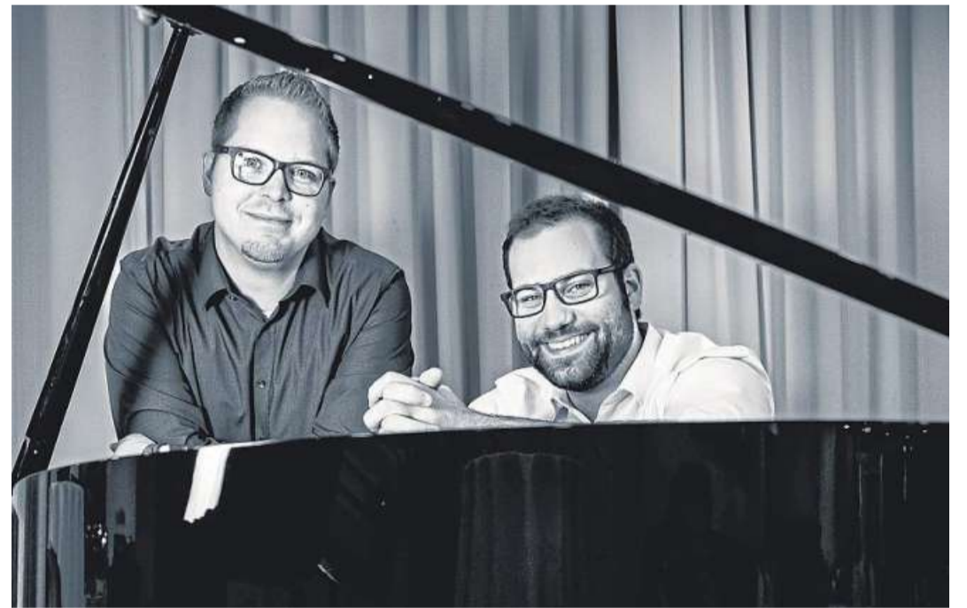
Pianovoice spielt heute um 14 Uhr auf der Kirchplatz-Bühne.

Die Basar-Buden sind wie folgt besetzt: Chocolaterie Alvermann aus Walsrode mit Trüffel und Pralinen aus eigener Herstellung, handgeschöpfter Schokolade und Butterstollen Dresdner Art; Erich Apfelstaedt mit handwerklicher Weihnachtsbäckerei, Honigkuchen, Gebäck,