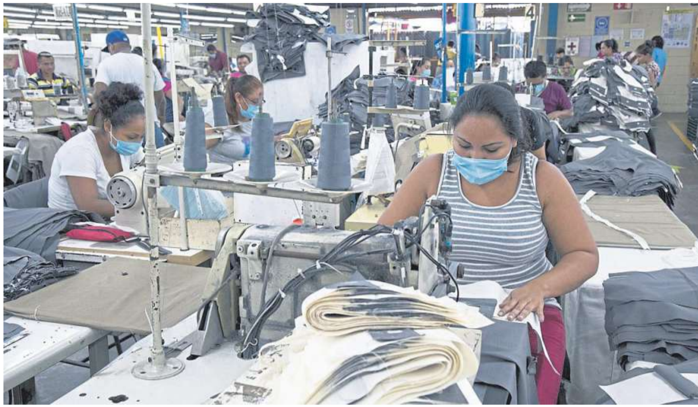
Faire Jobs für die Näherinnen in Nicaragua: Dafür sammelt „Brot für die Welt“ in den Weihnachts- und Jahreswechselgottesdiensten.

Mag sein, dass die Textilfabriken einigen sehr jungen Frauen die Chance bieten, Geld zu verdienen. Aber zu welchem Preis? Nach zehn, zwanzig Jahren an den Nähmaschinen sind diese Frauen kaputt und krank. Was dann? Ab 35 bekommst du in Nicaragua keinen Job mehr. Wer zehn, zwanzig Jahre nur Krügen zugeschnitten oder Knöpfe angenäht hat, findet danach definitiv keine andere Arbeit mehr. Einmal drin, nie mehr raus – eine maquila ist wie eine Falle. Ein ewiges Elend. Selbst wer einen höheren Schulabschluss vorweisen kann, entkommt den Freihandelszonen oft