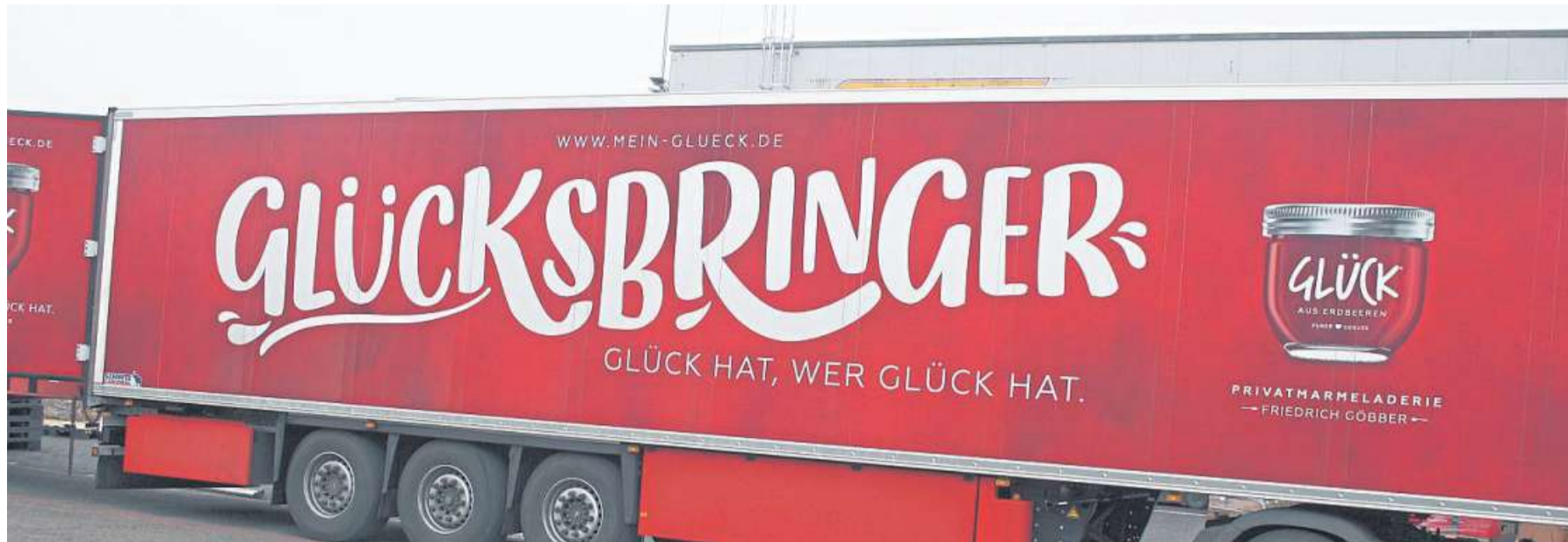
„GLÜCK hat, wer Glück bringt“: Die Lkw der Firma Göbber verstehen sich im wahrsten Sinne des Wortes als „Glücksbringer“.