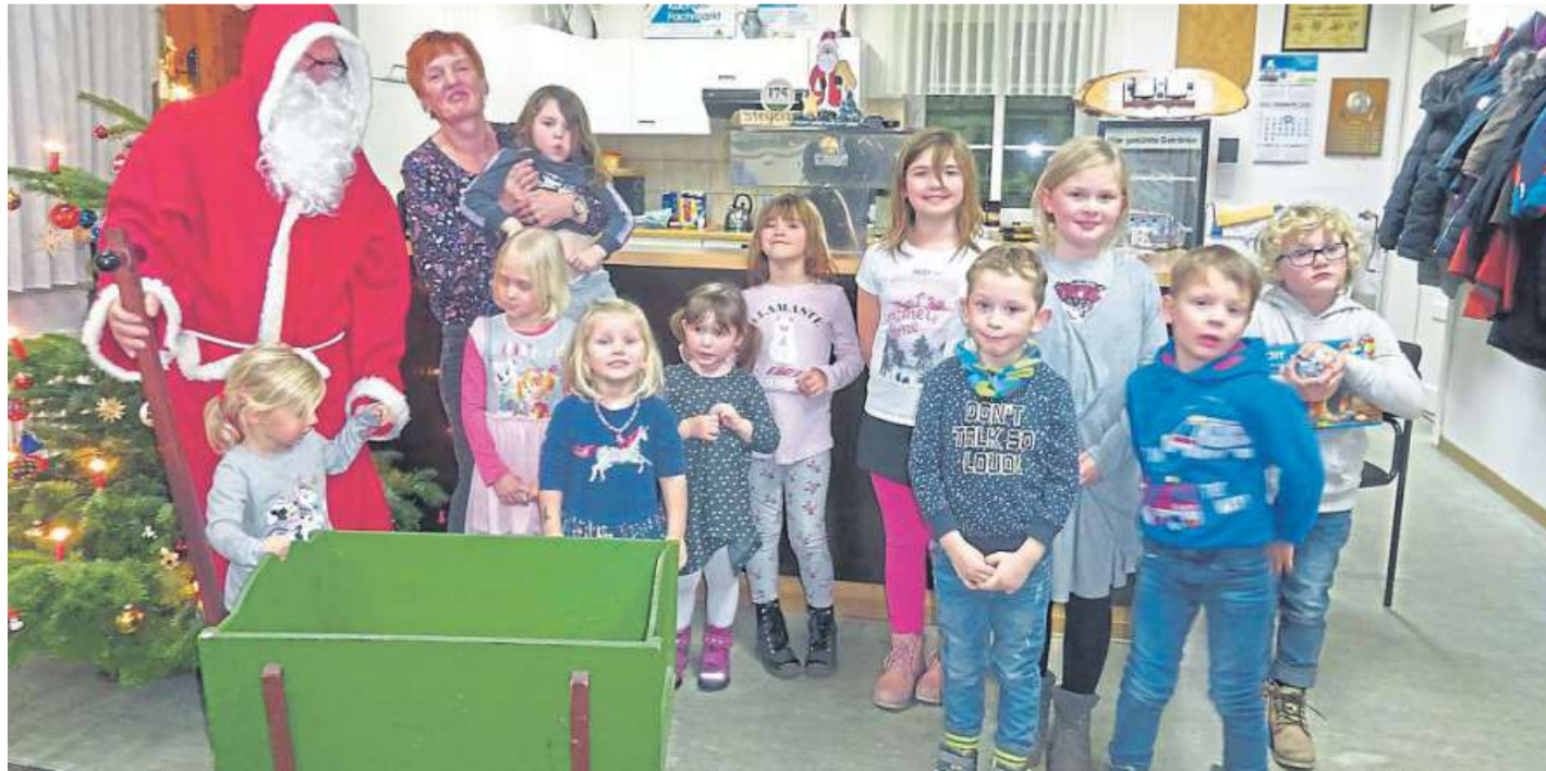
Kein Kind ging leer aus bei der Weihnachtsfeier der Steyerberger Kyffhäuserkameradschaft.