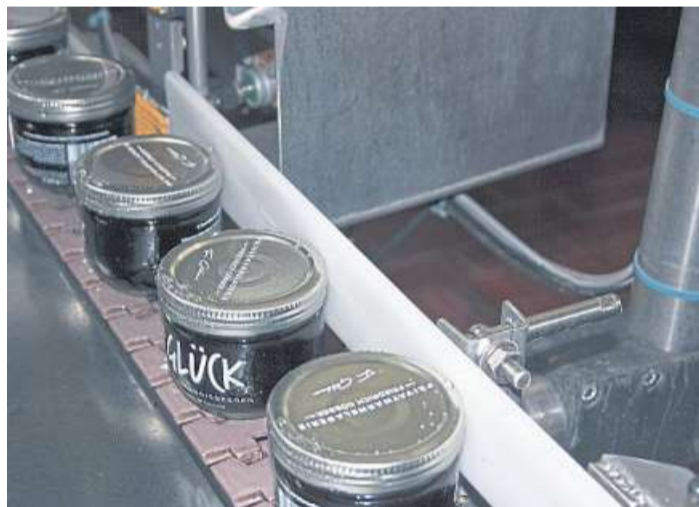
Ein Blick in die Produktion der GLÜCK-Konfitüre.

zeigt, dass wir mit GLÜCK sehr viel richtig gemacht haben. Klar ist aber auch: Das Original bleibt stets das Original. Denn in Zeiten, in denen die Menschen mehr und mehr wissen wollen, wer hinter einer Marke steht und wo produziert wird, wird Glaubwürdigkeit zu einem zentralen Erfolgsfaktor“, heißt es weiter.