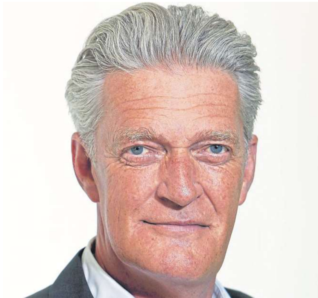
Nach den erfolgreichen Lesungen prominenter Künstler wie Claus Maria Brandauer, Max von Thun, Senta Berger, Christian Wolf, Anke Engelke, Matthias Brandt, Jan Josef Liefers oder Christoph Maria Herbst, kommt nun Max Moor ins Nienburger Theater.