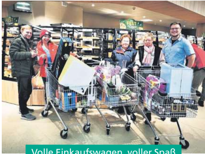
Volle Einkaufswagen, voller Spaß