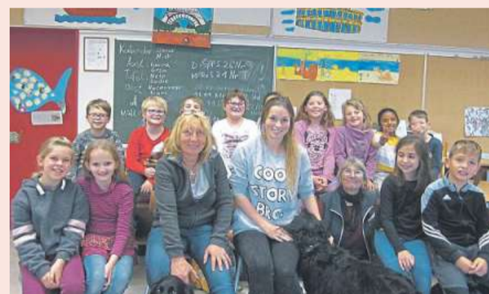
Die Tierpflege-AG hat Besuch von der Tierärztin.

sonst, sollte man zum Tierarzt gehen. Danach durfte jeder die Hunde begrüßen und streicheln.