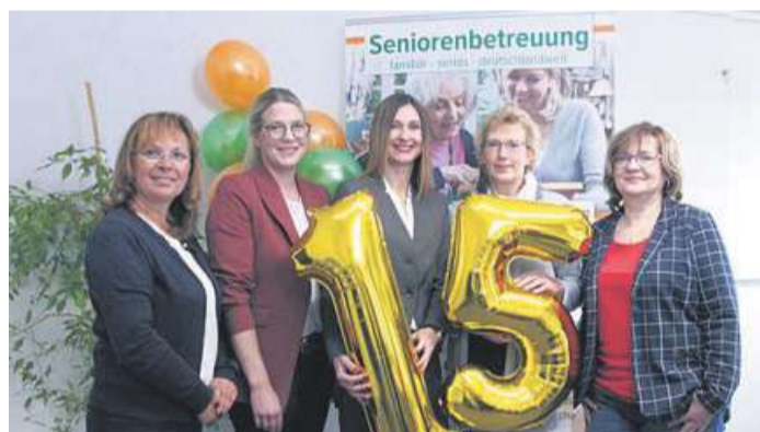
Family Service – Seit 15 Jahren mit Herz und Seele dabei – 65 Mitarbeiter*innen im Nienburger Landkreis unterwegs