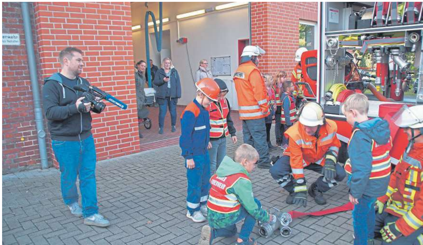
Ein Kameramann beobachtet die „Kleinen Feuerlöcher“, wie sie sich einen Verteiler erklären lassen.

Jeder kann nur einmal abstimmen, das heißt, dass möglichst viele Freunde der Feuerwehr ihr Voting abgeben