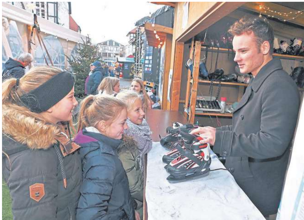
Wer keine eigenen Schlittschuhe besitzt, kann sie sich am Stand des Fördervereins Holtorfer Freibad gegen eine Gebühr von drei Euro ausleihen.

NIENBURG. Der Nienburger Dialog ist für Psychiatrie-Erfahrene, deren Angehörige und beruflich Helfende eine Möglichkeit, ihre Erfahrungen auszutauschen. Der nächste Dialog findet am Dienstag, 10. Dezember, von 18:30 bis 20:30 Uhr in den Räumlichkeiten des Paritätischen Kreisverbandes, Kräher Weg 2, in Nienburg statt. DH