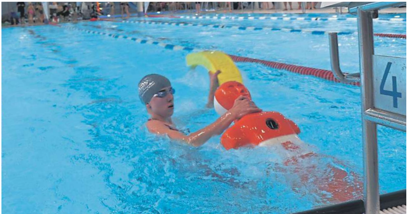
Hier wird der „200 Meter-Superlifesaver“ durchgeführt.

Hier können die Sportler der AK 17/18 und der offenen AK dann vier aus sechs möglichen Disziplinen auswählen, von denen die drei punktbesten gewertet werden. Die anspruchsvollste Herausforderung ist dabei die Strecke 200 m Superlifesaver, in der 75m Freistil, 25 m Schleppen einer Puppe, 50 m mit Flossen