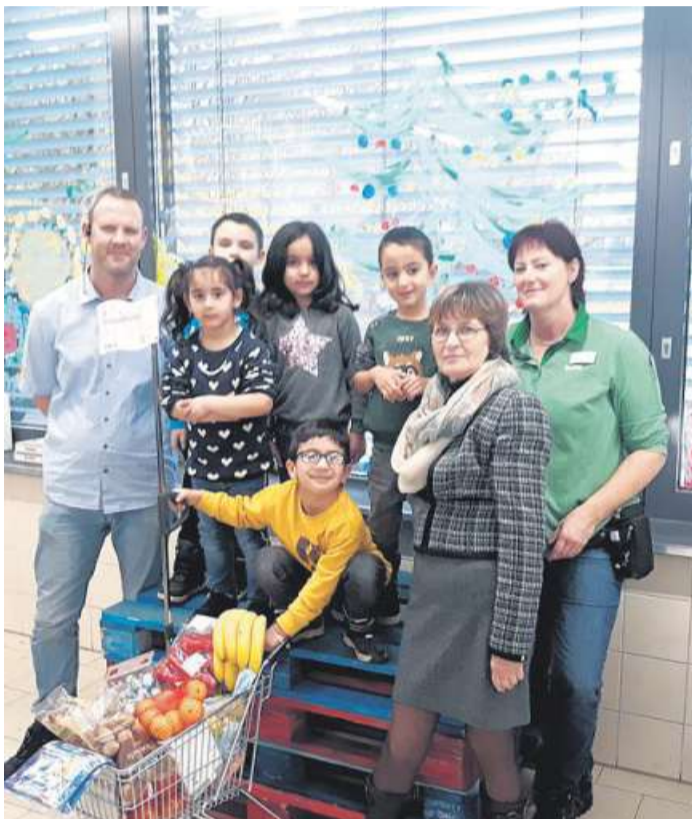
Kindergarten Pustebume bemalt Fenster weihnachtlich

zunächst die große Teigausrollmaschine. Nach dem Ausrollen wurden fleißig Plätzchen ausgestochen, verziert und in den riesigen Öfen gebacken. Nach einer Trinkpause durften die fleißigen Bäcker eine „Qualitätskontrolle“ (Probieren der Kekse) durchführen, bevor sie glücklich und zufriedener mit einer großen Menge Plätzchen wieder zurück in die Schule fahren.