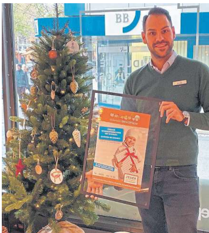
Sogar in Hannover steht ein Wunschebaum für das Kinderheim „Kleine Strolche“ in Asendorf.

Auch Unternehmen aus Hannover unterstützt Kinderheim „Kleine Strolche“ in Asendorf mit einem Wunschebaum