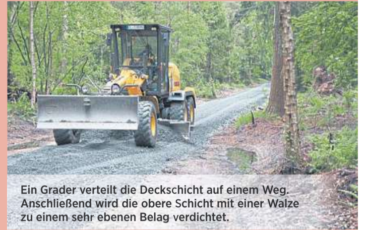
Ein Grader verteilt die Deckschicht auf einem Weg. Anschließend wird die obere Schicht mit einer Walze zu einem sehr ebenen Belag verdichtet.

Ein teilweise schlechter Wegezustand in der Stadforst Rehburg und im angrenzenden Staatswald des Forstamtes Nienburg beunruhigt zurzeit manche Waldbesucher. „Wir bitten alle Waldbesucher um Verständnis, denn die Wege wurden zunächst mit einer groben Tragschicht befestigt. Nach den Forstarbeiten diesen Winters werden die Wege mit einer feinkörnigen Deckschicht endgültig und