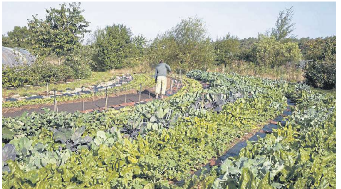
Die erste Solidarische Landwirtschaft soll in Steyerberg entstehen. Erste Informationen gibt es am 14. Dezember.

Die AnteilseignerInnen erhalten außer den angebauten Produkten wie Salaten, Kräutern und Früchten auch ein Mitspracherecht bei der Gestaltung der Solawi sowie bei der Anbauplanung für die nächste Saison. „Auch wird