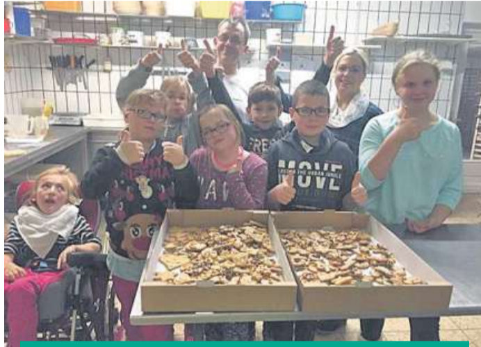
Ein toller Tag in der Bäckerei Wulf