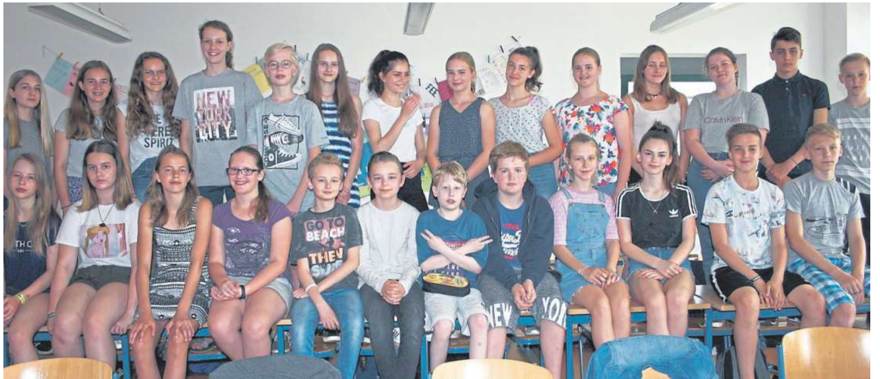
Damals 7d, heute 8d: Die Schülerinnen und Schüler aus dem Projekt „Teen to teen“.

NIENBURG. Der Info-i-Punkt „Meerbach-Apotheke“ der Diabetiker Niedersachsen hat am Donnerstag, 12. Dezember, von 16 bis 17 Uhr geöffnet. Hier können Betroffene die Probleme mit ihrer Erkrankung erörtern. DH