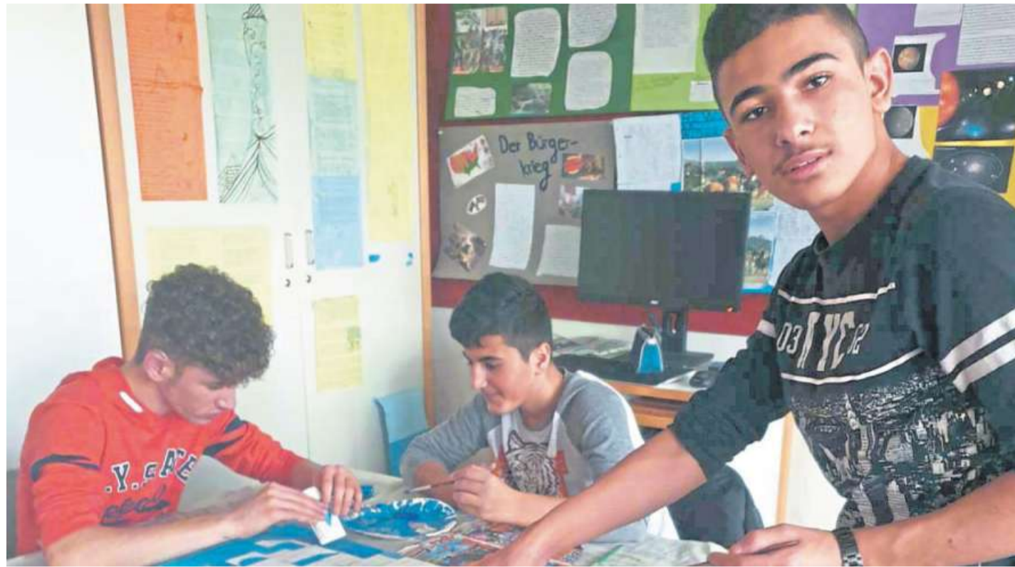
Die Schülerinnen und Schüler der OBS Nienburg beteiligen sich zum ersten Mal an „Kunst im Krankenhaus“.