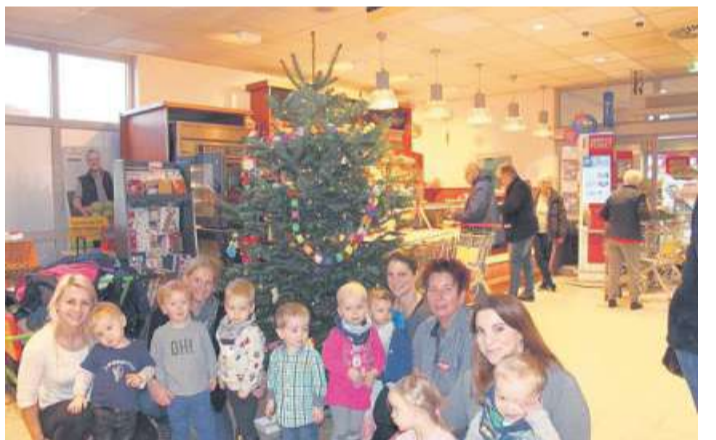
Kinder schmücken Tannenbaum

Ende November freuten sich viele kleine Hände auf das Schmücken des Weihnachtsbaumes in der Filiale eines Nienburger Lebensmittel Einzelhändlers an der Hannoverischen Straße. Tage zuvor hatten die Kinder der Betriebskrippe des Landkreises Nienburg „Die kleinen Bärenatzen“ Salzteigplätzchen ausge-