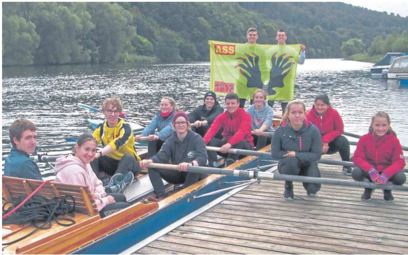
Die Ruderriege der Albert-Schweitzer-Schule auf der Fulda.

Während Kipchoge und seine „Mondlandung“, wie es der SPIEGEL nannte, medial omnipräsent war, fiel ein echter Marathon-Weltrekord fast hinten herunter. Einen Tag nach dem Kipchoge-Lauf in Wien hat die Kenianerin Brigid Kosgei bei ihrem Sieg in Chicago in 2:14,04 Stunden den Frauen-Weltrekord im Marathon gebrochen. Die 25-Jährige unterbot den 16 Jahre alten Weltrekord der britischen Ex-Weltmeisterin Paula Radcliffe gleich um 1:21 Minuten. Im Gegensatz zu Kipchoge erzielte Kosgei ihre Leistung in einem offiziellen Rennen auf einer rekordträchtigen Marathonstrecke, sodass der Anerkennung als Weltrekord nichts entgegen stehen dürfte.