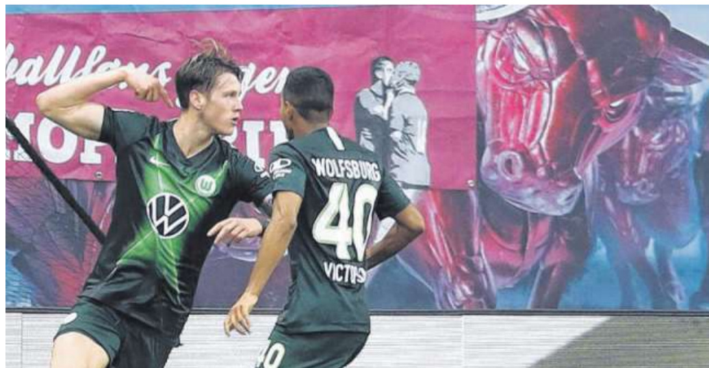
Wout Weghorst (links) traf auch in Leipzig und sicherte Wolfsburgs Serie.

Nach dem vierten Pflichtspiel ohne Sieg bleiben die Leipziger mit 15 Punkten einen Zähler hinter dem Überraschungsteam von Oliver Glasner. Timo Werner traf zwar zur Führung (54.), doch Wout Weghorst gelang noch der Ausgleich und rettete seinem Team die positive Bilanz. „Wir sind sehr froh über den Punkt, es hat Spaß gemacht, den Jungs beim Fußballspie-