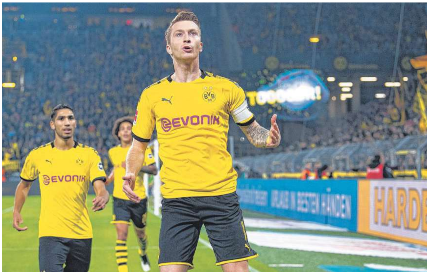
Der Kapitän geht voran: Marco Reus bejubelt seinen 1:0-Siegtreffer gegen Mönchengladbach.