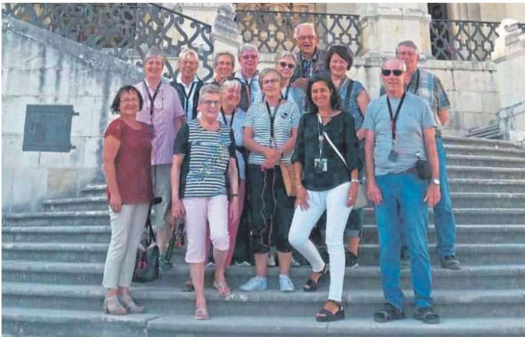
Die Reise des TKW Nienburg führte dieses Mal nach Portugal.

„Das Ziel dieser Wanderausstellung und des Rahmenprogramms ist, aufzuzeigen, wie vielfältig und bunt der Landkreis Nienburg ist.“ DH