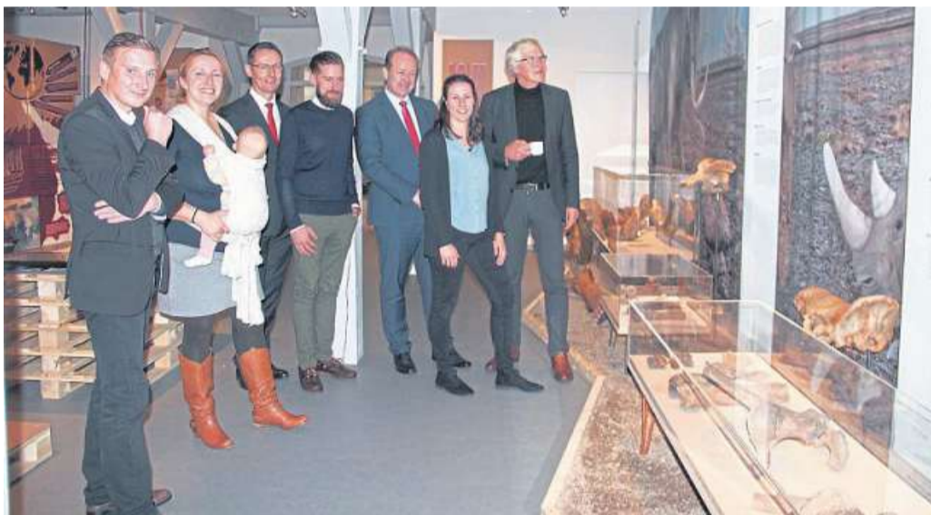
Die Sonderausstellung „Kalte Zeiten – Warme Zeiten. Von Mammuten und Motoren“ ist derzeit im Fresenhof des Museums Nienburg zu sehen.

Der zweite Teil der Ausstellung befasst sich mit dem anthropogenen, dem menschengemachten, Klimawandel. Seit der Industrialisierung erhöhte sich der menschengemachte CO 2 -Anteil in der Luft deutlich messbar. Schon im 19. Jahrhundert wurden Theorien über den Treibhauseffekt aufgestellt und auch bereits experimentell bewiesen. Seit den 1970er Jahren