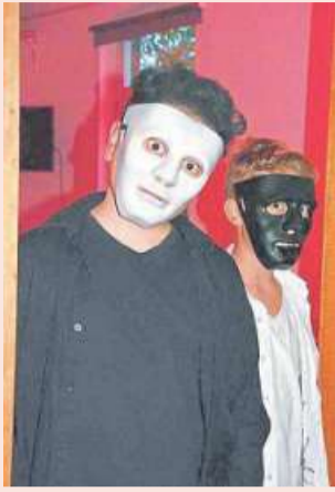
Eine Anmeldung ist nicht erforderlich. Das Team freut sich auf viele

Am Mittwoch, 30. Oktober, in der Zeit von 17.30 bis 20.30 Uhr wird es gruselig werden im Jugendzentrum in Loccum. Es erwarten euch grauenhafte Spiele, eine düstere Disko, ein Kostümwettbewerb und vieles mehr. Eintritt wird gewährt gegen eine Süßigkeit. Die angebotenen magischen und schaurigen Getränke kosten 0,50 Euro.