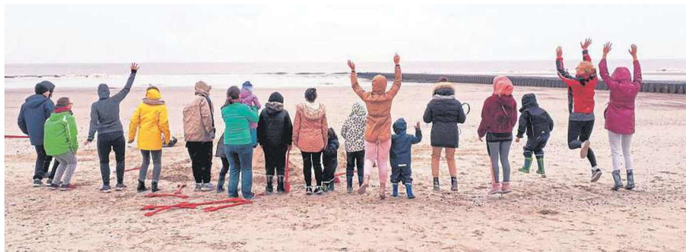
Erholsame Tage auf Norderney erlebten 15 Erwachsene und 19 Kinder dank des Diakonischen Werks.

Im Rahmen der Rojava-Infotage wird am kommenden Mittwoch, 23. Oktober, im Gemeindehaus St. Martin am Kirchplatz in Nienburg um 19:30 Uhr der Vortrag „Frühling der Frauen“ über Frauenbefreiung und Gleichberechtigung angeboten. Vorher ist dort die Fotoausstellung mit gleichem Titel zu sehen. Auch wenn es aktuell nichts zu feiern gibt, wird zum Abschluss der Infotage am Sonnabend, 26. Oktober, ab 15 Uhr im Nienburger Kulturwerk ein Solidaritätsfest veranstaltet.