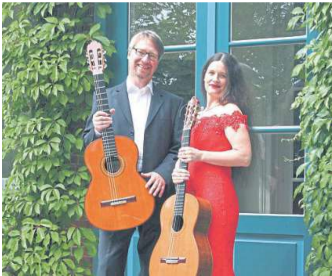
Das Duo „Saitenblicke“ gastiert am 27. Oktober in Steyerberg.