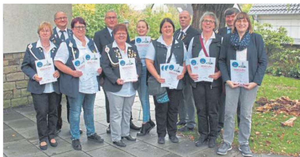
Der KV Stolzenau räumte reichlich Medaillen ab.