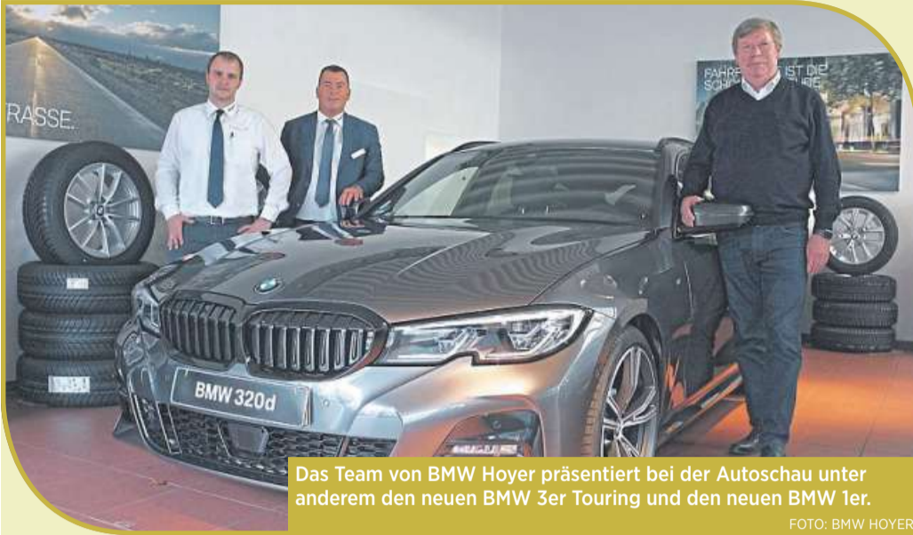
Das Team von BMW Hoyer präsentiert bei der Autoschau unter anderem den neuen BMW 3er Touring und den neuen BMW 1er.