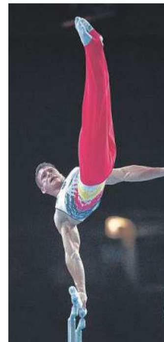
Beste Vornote: Lukas Dauser hat heute durchaus Medaillenchancen.

Dauser wusste, dass die Zeit gegen ihn arbeitet. Um so intensiver und konzentrierter trainierte er, musste aber stets die richtige Balance zwischen Belastung, Entspannung und Regeneration finden. Seine Hand wird von einer Metallplatte stabilisiert. Die Narbe ist noch deutlich zu sehen. Der Fuß ist mit einem stabilisierenden Tapeverband versehen. „Die Hand ist okay, macht keine Probleme“, sagt der EM-Zweite von 2017. „Den Fuß spüre ich noch, habe aber keine Schmerzen. Das ginge auch nicht, damit könnte ich nicht turnen.“