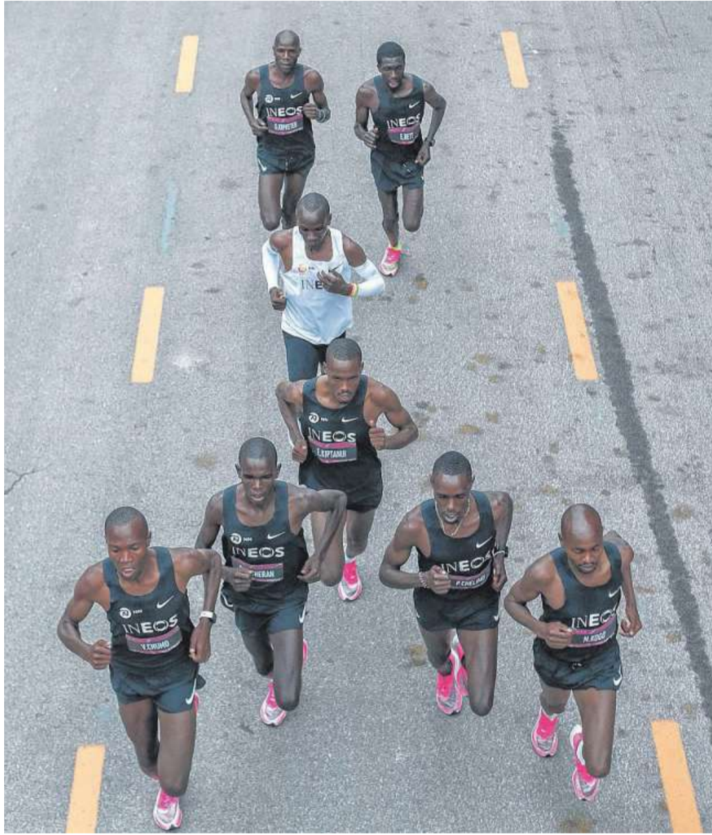
Ein Star, sieben Helfer: Eliud Kipchoge (weißes Trikot) läuft inmitten seines Schrittmacher-Teams und bleibt in Wien erstmals unter der magischen Marathon-Marke von zwei Stunden.

„Ich bin der glücklichste Mensch“, sagte Kipchoge am