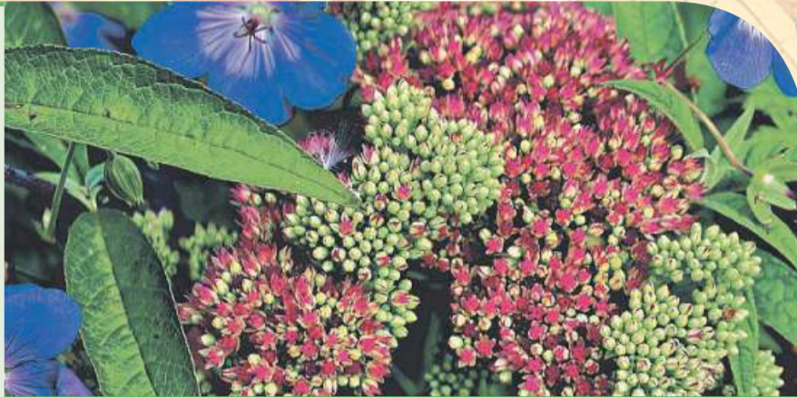
Damit das Blumenbeet auch im nächsten Jahr gedeiht, muss es im Herbst gepflegt werden.

Für Pflanzen, die im Halbschatten liegen, eignen sich Humusgaben besonders gut. Indem jeden Herbst eine Schicht Rindenkompost zwischen den Pflanzen verteilt wird, können diese besser und größer gedeihen.