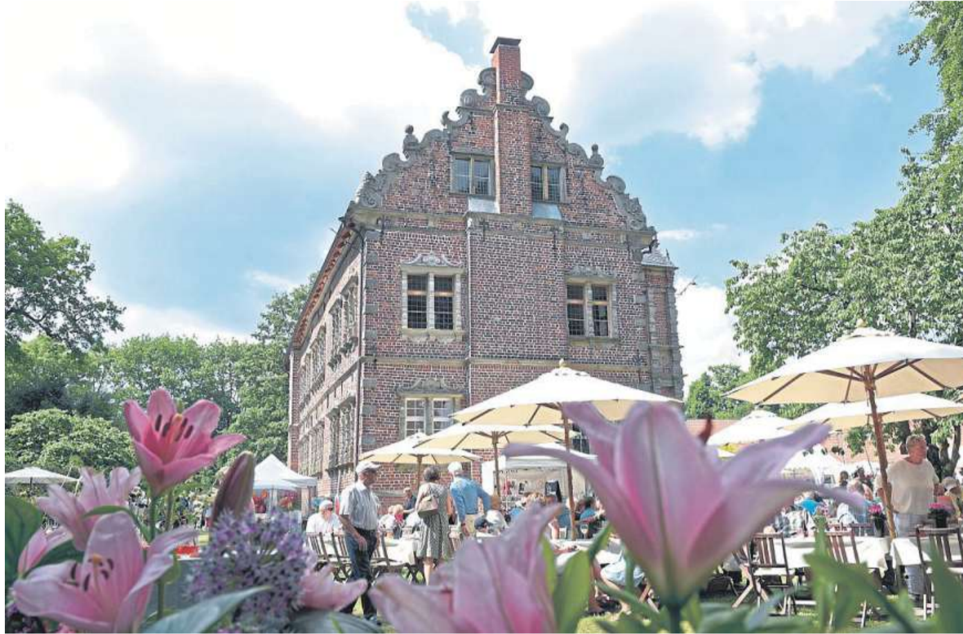
Rund um den Erbhof in Thedinghausen findet vom 25. bis 27. Oktober das „Herbstgeflüster“ statt.

In der Einladung zu der Ausstellung heißt es: „Erfahren Sie bei einer Besichtigung des Renaissancesaals und einer Präsentation mit Fotos und Berichten Interessantes über die ‚Perle der Weserrenaissance‘ und den Baumpark mit seiner Jahrtausendallee. Schauen Sie Kunst-