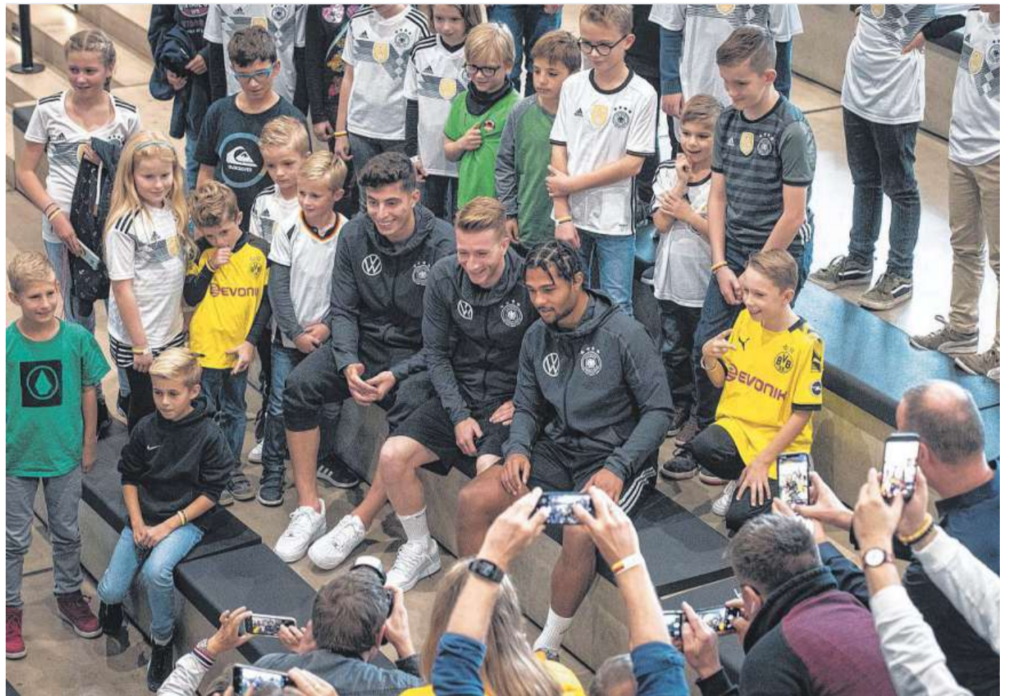
Die deutschen Nationalspieler Kai Havertz, Marco Reus und Serge Gnabry (von links) sitzen nach einer Kinder-Presskonferenz im Deutschen Fußballmuseum und lassen sich fotografieren.

Dass Löw in der kleinen A. Le Coq Arena - Namensgeber ist eine estnische Brauerei - nach dem Ausfall von Hertha-Verteidiger Niklas Stark nur 19 Spieler zur Verfügung hat, sollte gegen die Nummer 102 der Weltrangliste kein Problem darstellen. „Es soll nicht