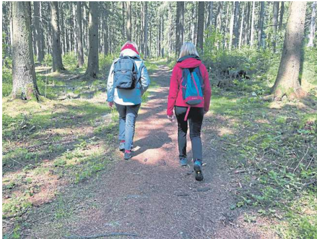
Auch die Mittelweser-Region bietet erholsame Wander- und Pilgerwege.

Die schönsten Punkte des Fleckens Langwedel zeigt die Wandertour „Langwedel – Zwischen Schloss und Burg“. Bestehend aus zwei Routen mit jeweils acht Kilometern Länge führt die Tour durch die abwechslungsreiche Natur und Sehenswürdigkeiten des Fleckens. Dabei geht es zum Beispiel über die älteste Straße Langwedels mit uraltem Eichenbestand, entlang