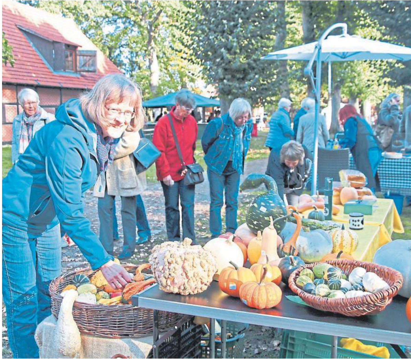
Vom 18. bis 20. Oktober findet im Estorfer Scheunenviertel der mittlerweile 25. Landfrauen-Herbstmarkt statt.

Für viele allein schon Grund genug, zum Landfrauen-Herbstmarkt zu kommen, ist das kulinarische Angebot. Ein Highlight ist das traditionell zubereitete Knipp – in diesem Jahr zeichnet ein neuer „Knipp-Bräter“ dafür verantwortlich, nachdem der bisherige „Knipp-Meister“ in den Ruhestand gegangen ist. Auch wer es nicht ganz so deftig mag, ist an den drei Ta-