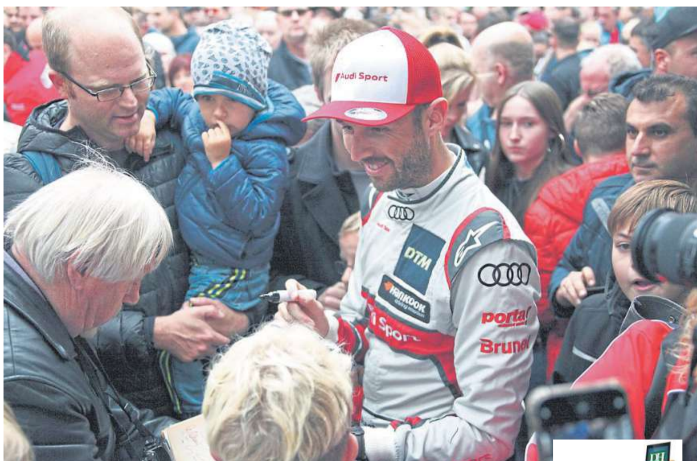
René Rast genießt das Bad in der Menge sichtlich und erfüllt in Minden geduldig Autogrammwünsche seiner Fans.

In den 70er Jahren gab es zweimal nach sieben Spieltagen gleich vier punktgleiche Teams an der Tabellenspitze. 1974/75 führte Frankfurt das Quartett an, den Titel sicherte sich am Ende Borussia Mönchengladbach. Die Hessen hatten sieben Punkte Rückstand. In der Spielzeit 1978/79 lagen die Bayern zu dem Zeitpunkt unter vier Mannschaften vorn, Meister wurde – ach was müssen das für schöne Zeiten gewesen sein: mein Hamburger SV. München hatten damals einen Rückstand von neun Punkten.