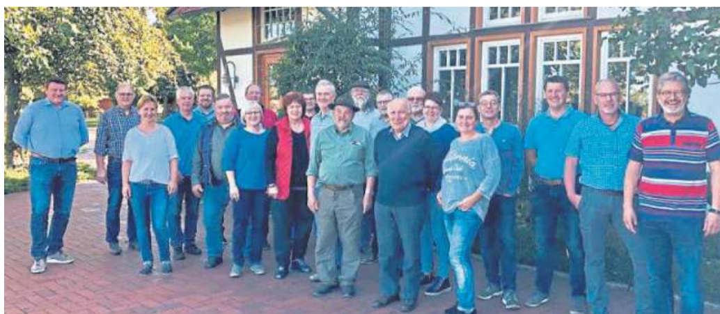
Dieses Mal war der Heimatverein der Samtgemeinde Uchte im Flecken Diepenau unterwegs.

Ihre Aufgabe sehen die Verantwortlichen in der optimalen Nutzung und dem Er-