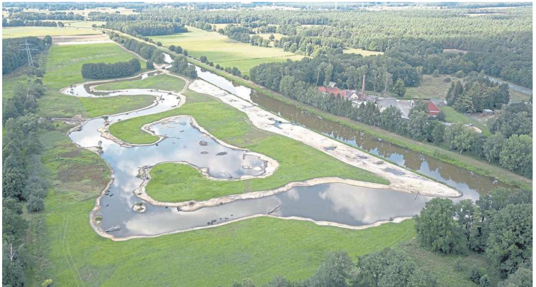
Der Blick von oben zeigt sowohl die Große Aue als auch den neu geschaffenen Seitenarm.

WÖLPINGHAUSEN. Zum 19. Mal veranstaltet der Sportverein Wölpinghausen am heutigen Sonntag seinen Wandertag. Gestartet wird zwischen 10 und 12 Uhr am Naturfreundehaus „Graf Wilhelm“ in Berghol. Es gibt zwei Strecken, neun und elf Kilometer lang. Startgeld wird nicht erhoben. Fürs leibliche Wohl der Teilnehmenden ist gesorgt. DH