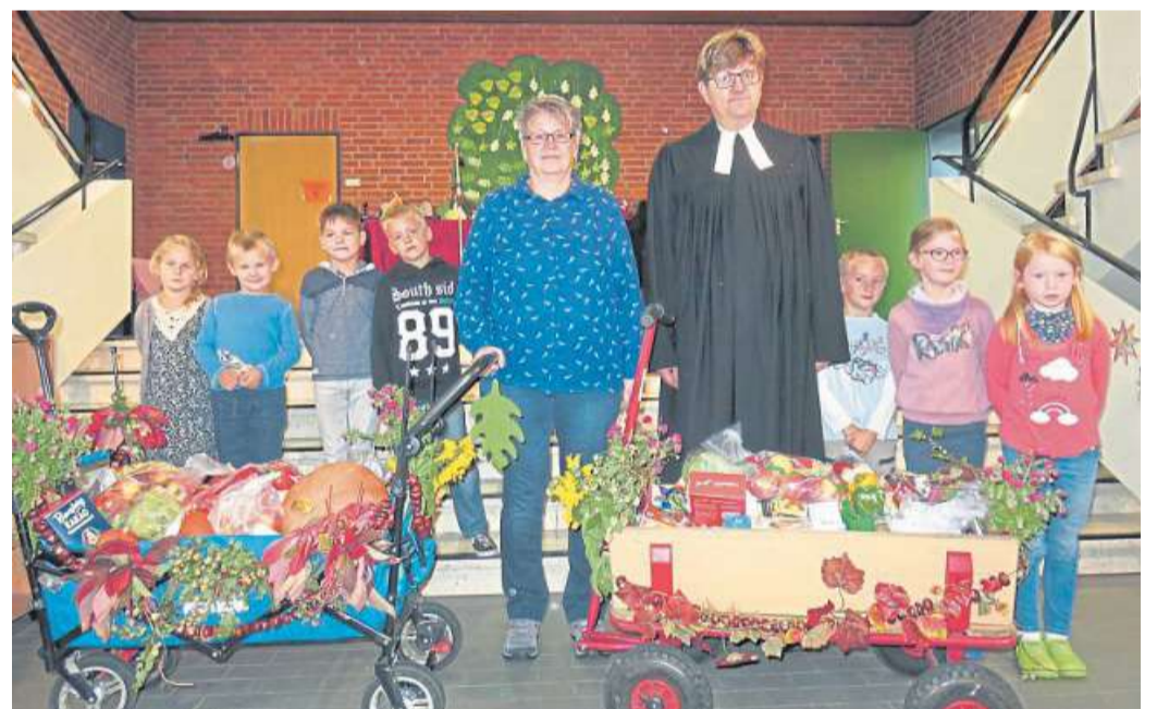
Lebensmittel für Familien, die es nicht so gut haben: an der Grundschule Haßbergen wurde Erntedankfest gefeiert.