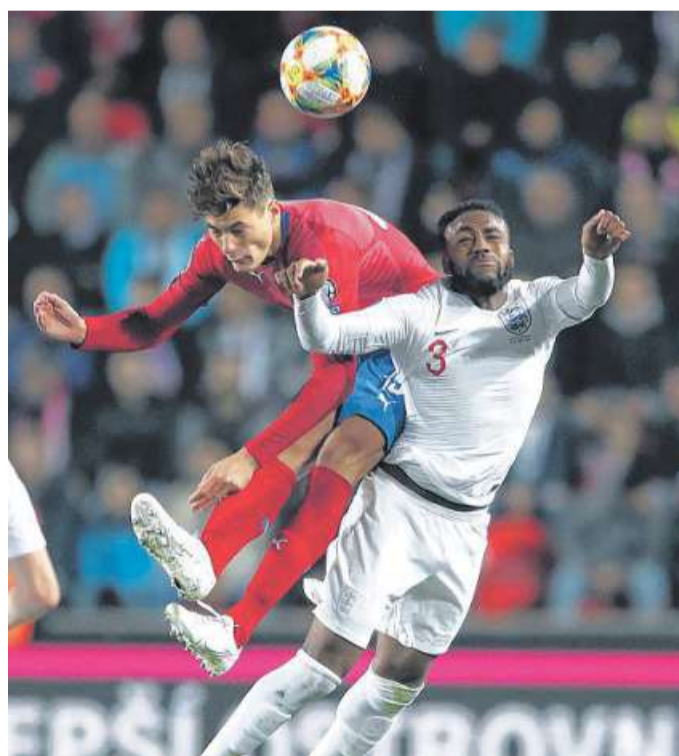
Tschechiens Patrik Schick (links) im Zweikampf mit dem Engländer Danny Rose.