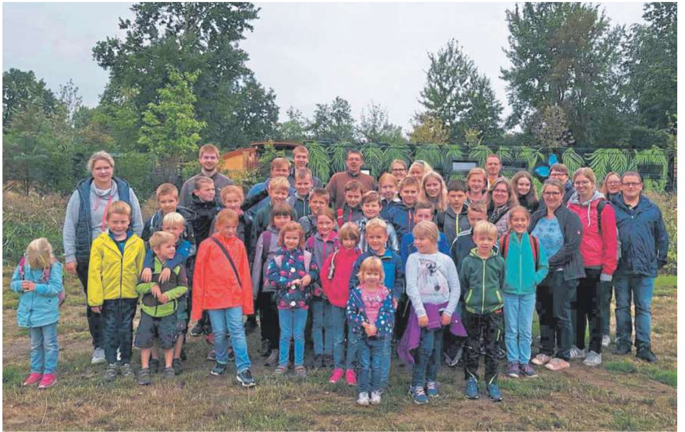
32 „Flöhe“ und zwölf Betreuer: die Kinder und Jugendlichen aus Gadesbünden hatten viel Spaß im Serengeti-Park Hodenhagen.

Um das Ganze aber so günstig wie möglich für die Teilnehmer zu gestalten, ließen sie zusätzlich beim diesjährigen Schützenfest beim Königsfrühstück den „Hut“ im Zelt kreisen, was denn letztendlich gereicht hat, um diesen Tag planen und ausführen zu können. „Vielen Dank an dieser Stelle an die Landjugend und die zahlreichen Spenden, die wir für diesen Tag erhalten haben und an unseren Festwirt Ingo Lauchstädt vom Hol Ab-