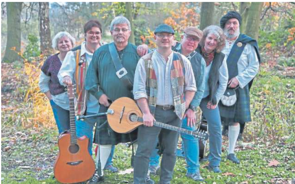
Die Kapellis: am 9. November zum ersten Mal in Linsburgs „Lindenhof“.

Der Kartenvorverkauf findet im Linsburger Dorfladen, Grund 7, und bei Orthopädie-Schuhtechnik Linderkamp,