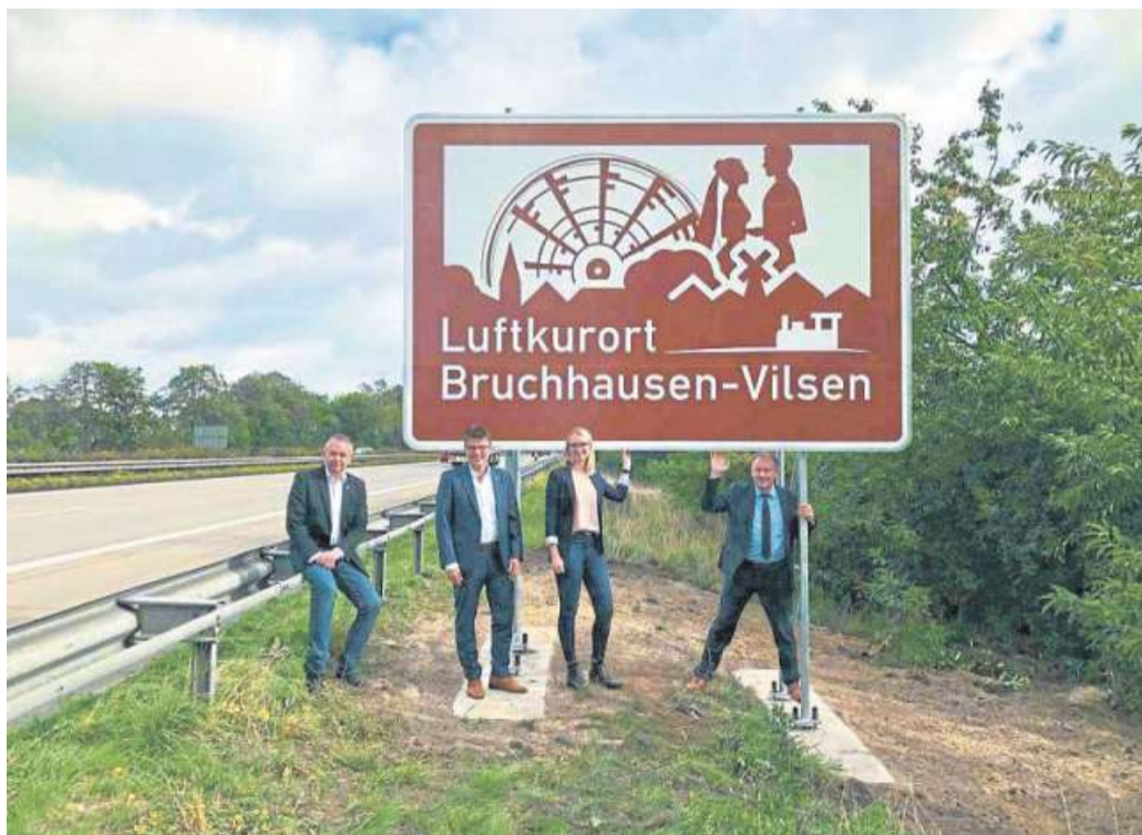
Auch an den Autobahnen wird jetzt für Bruchhausen-Vilsen geworben.