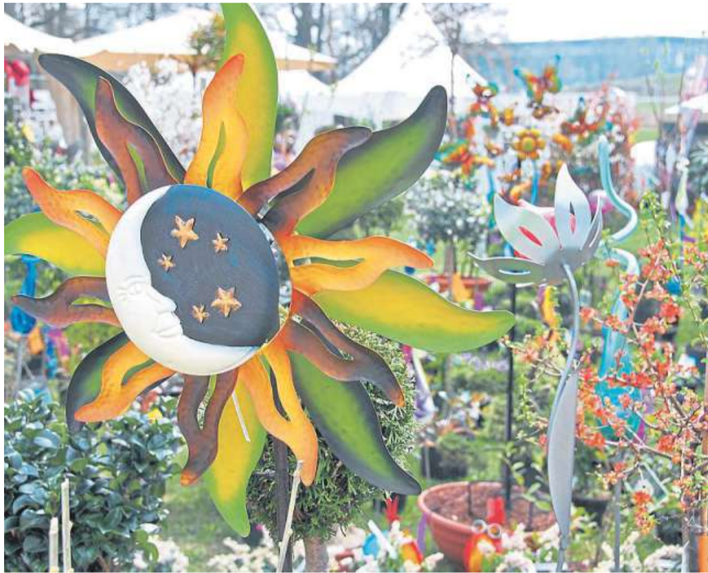
Dekoratives gibt es bei der Ausstellung zu sehen und zu kaufen.

Das Rahmenprogramm der Landpartie umfasst Elemente