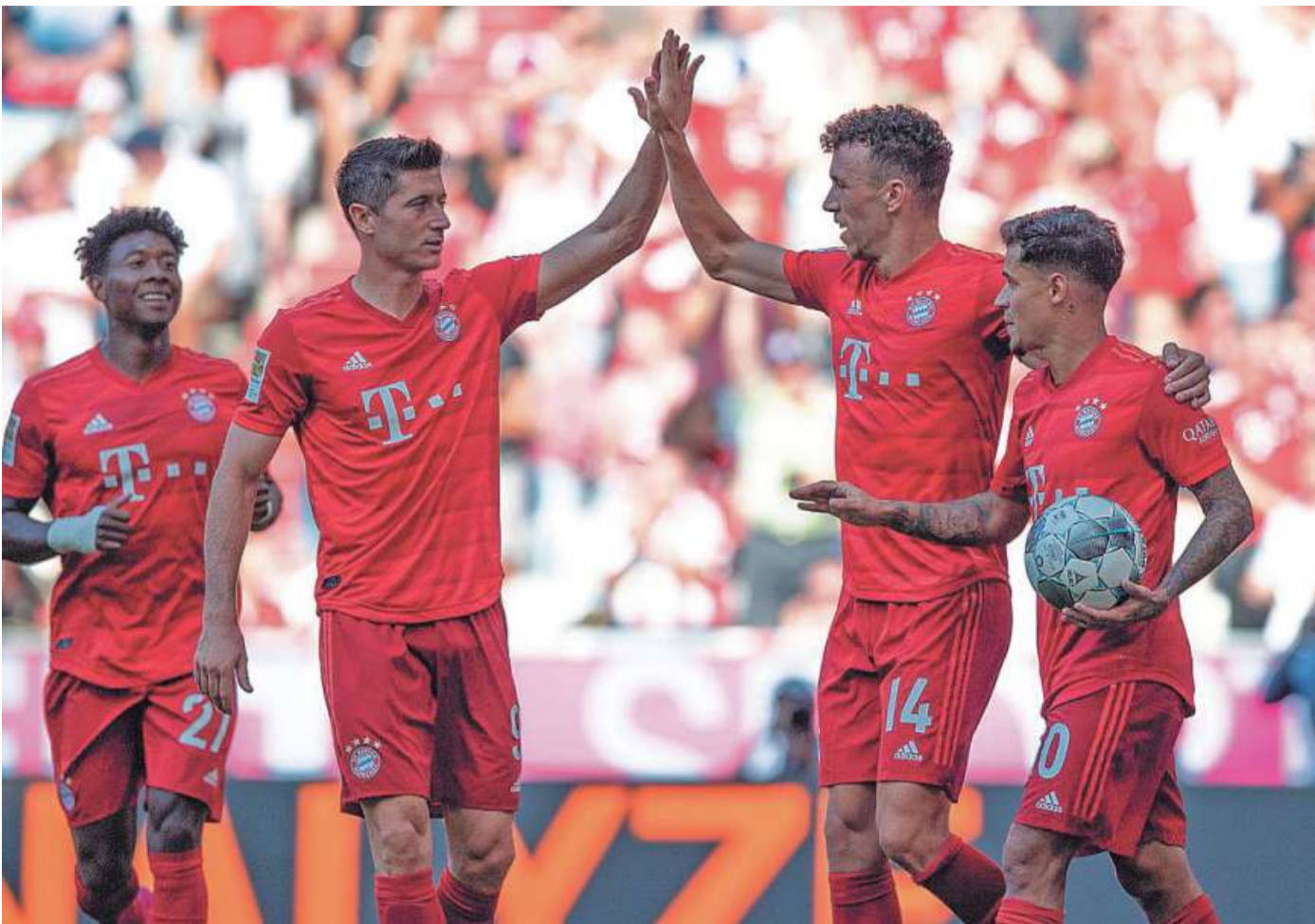
Bayern Münchens Zugang Ivan Perisic (2.v.r.) jubelt gemeinsam über seinen Treffer zum 3:1 mit (v.l.) David Alaba, Robert Lewandowski und Philippe Coutinho.