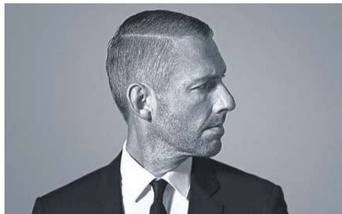
Sebastian Pufpaff kommt wieder nach Nienburg.

Kabarett-Solo am 20. März 2020 im Nienburger Theater