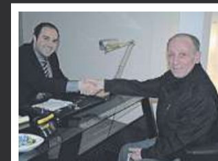
Kunde beim Altgold-Verkauf.