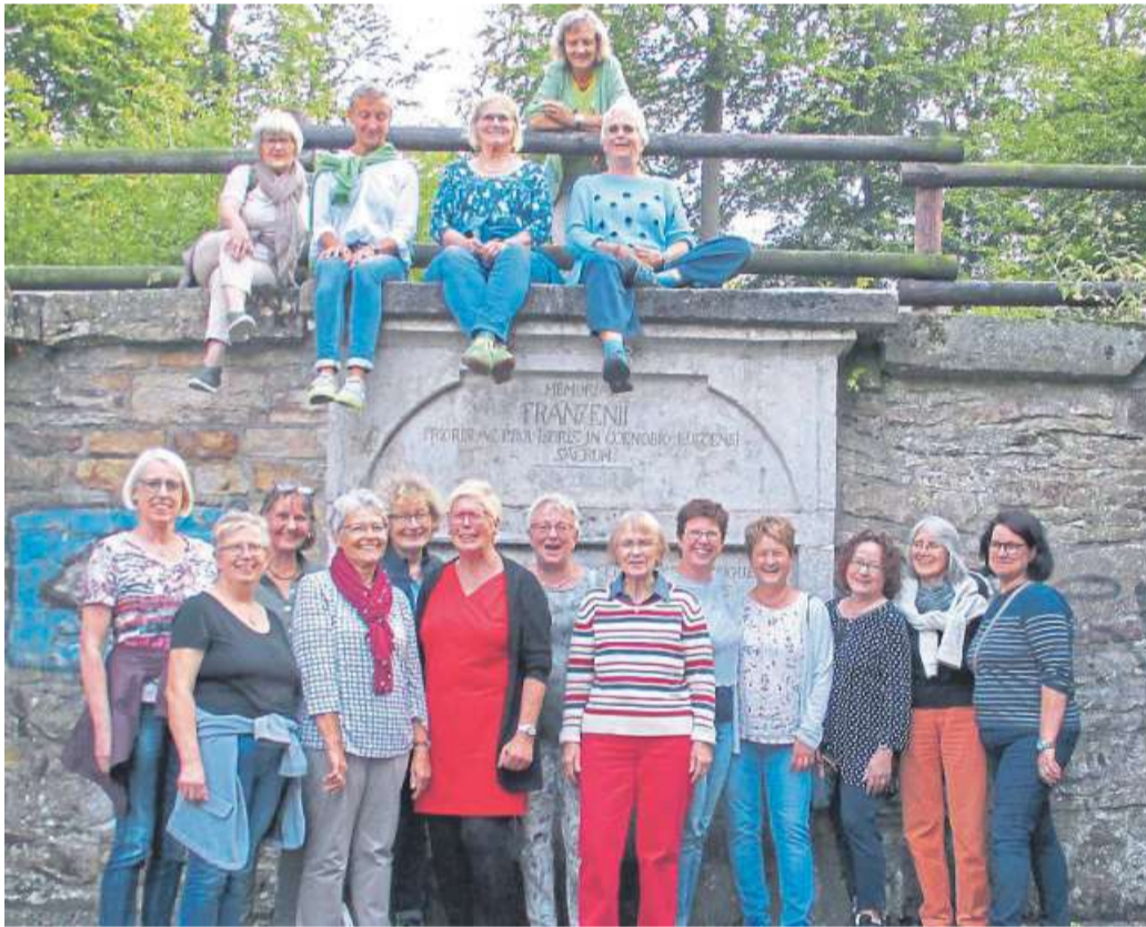
Für ihre Hospiz-Arbeit stärkten sich die Frauen in der evangelischen Akademie.