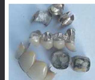
Nicht schön – aber wertvoll!