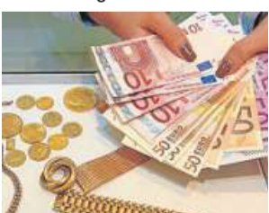
Sofort Bargeld selbstverständlich!

Lange Straße 70 (gegenüber Netto) · 31582 Nienburg · Tel. (05021) 9229289 · von 10 – 17 Uhr geöffnet