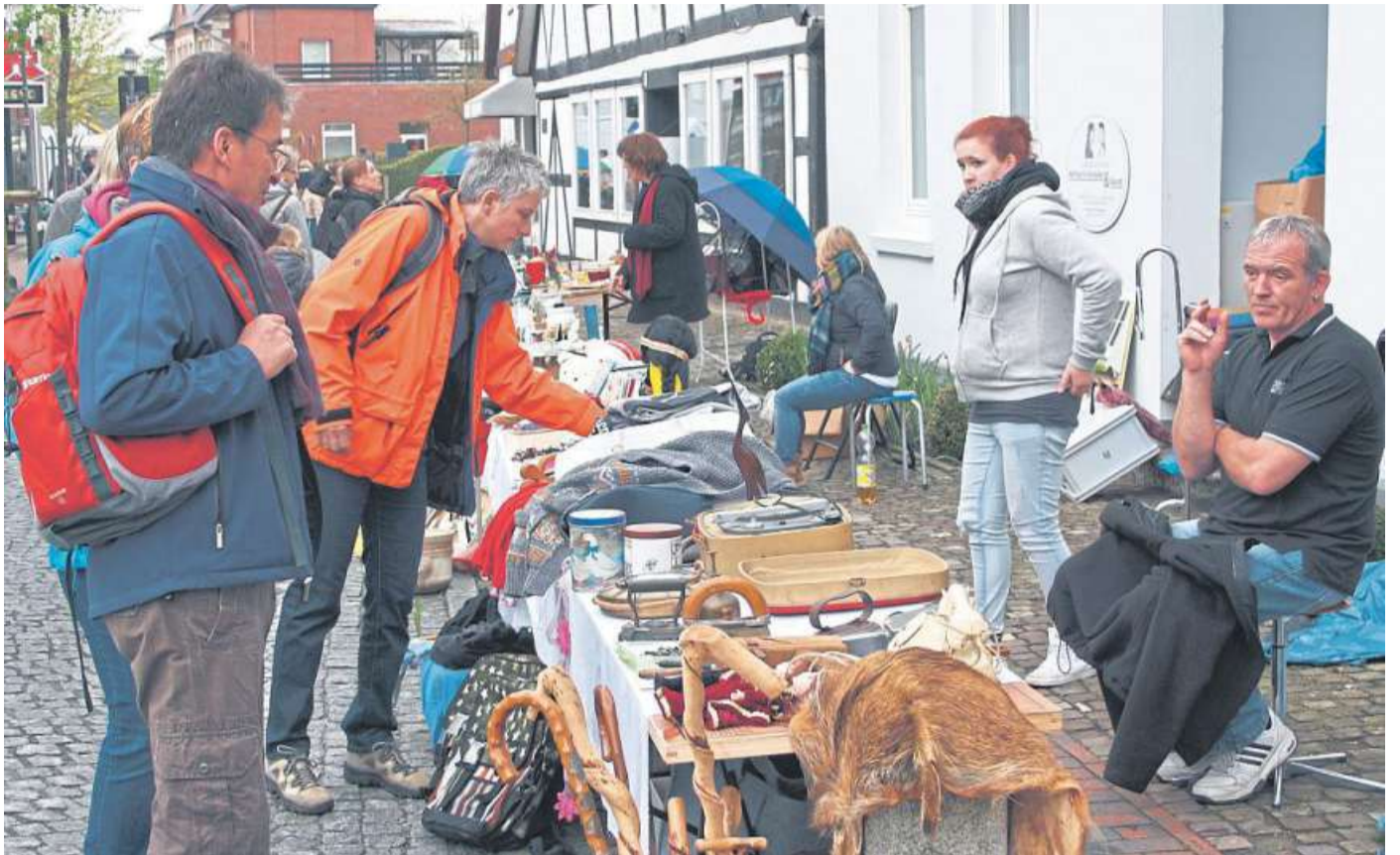
Der Flohmarkt zieht Schnäppchenjäger wie auch Händler gleichermaßen an.