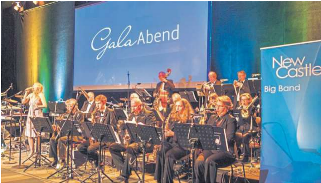
Die „New Castle Big Band“ dorgt für einen der musikalischen Programmpunkte des Holtorfer Erntefestes.

Höhepunkt des Festes soll die Wahl der Holtorfer Erntekönigin sein. Vor zwei Jahren wurde diese Ehre Leonie Ritz zuteil, die mittlerweile auch Spargelkönigin geworden ist. Sie wird gegen 17 Uhr zusammen mit Hauptsponsor Udo Werfelmann die Schärpe an die neu gewählte Königin übergeben.