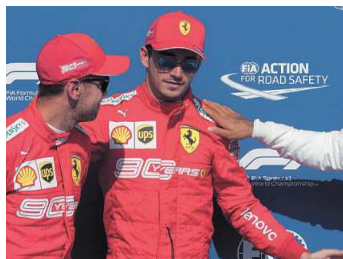
Sebastian Vettel (links) und Charles Leclerc freuen sich über die gemeinsame erste Ferrari-Startreihe.

Scuderia-Kollege Charles Leclerc sicherte sich ganz überlegen den ersten Startplatz für das heutige Rennen (15.10 Uhr/RTL) und lag mehr als sieben Zehntelsekunden vor Vettel. „Wir freuen uns auf das Rennen, wir haben