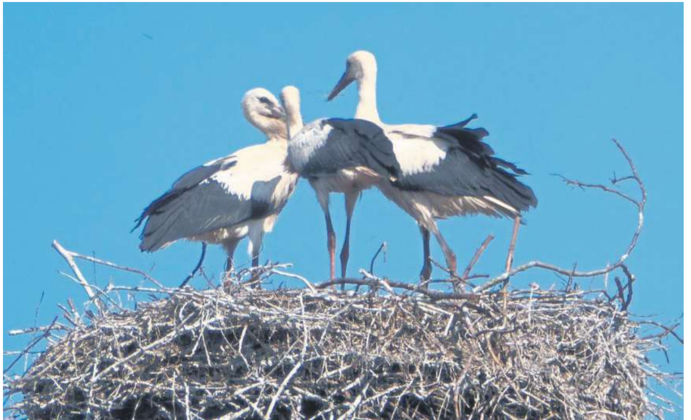
Es war ein gutes Jahr für Störche – wie hier in Haßbergen.

Der Anteil der „Ostzieher“, der den Winter in der Sahelzone im Raum Tschad und Süd-Sudan verbracht hatte, kam ab dem 20. März zurück. „Auffällig war dann, dass es in diesem Frühjahr wieder einmal eine größere Anzahl Ostzieher gegeben hat, die erst Ende April/Anfang Mai angekommen sind. Sie waren bis Südafrika gezogen und kamen wegen der größeren Entfernung entsprechend später zurück“, berichtet