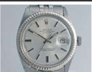
Markenuhren werden auch angenommen.