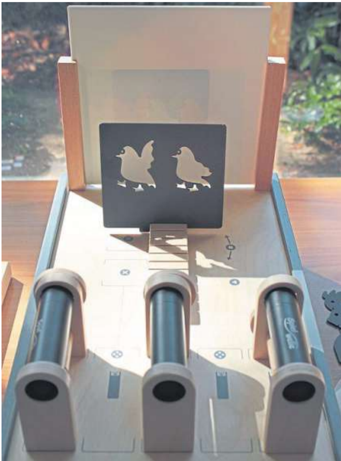
Dieses Schattenexperiment trägt den Titel „Optiko“.