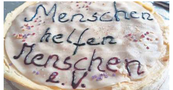
Eine Torte gab es zur Vereinsgründung.

Die Will-iN-Mitarbeitenden laden für Dienstag, 27. August, ab 15 Uhr zum Abschlussfest in den Diakoniegarten hinter dem Weserschloss ein. Der Verein „Menschen helfen Menschen“ wird dabei für kulinarisches sorgen. Bei schlechtem Wetter wird das Treffen in das Gemeindehaus St. Martin verlegt.