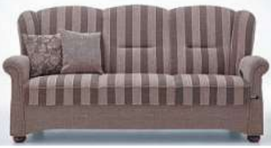
Sofa in 4 Längen lieferbar

3-sitzer XL 226 cm 3-sitzer 196 cm 2,5-sitzer 176 cm 2-sitzer 140 cm