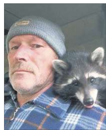
Ansprechpartner für Waschbärprobleme und Schädlinge ist die Firma Mardervergrämung UG. ➔ Telefon 0152 03 96 38 97

Die geplagten Kunden freuen sich, dass nach der Vergrämung keine Geräusche mehr die Nachtruhe stören. Pfeffer, Radio, Urinsteine, Diesel, Essig usw. sind ebenso kreative wie erfolglose Hausmittel. Diese kosten nur Zeit und Geld. Etwa 10000 Bilder belegen unsere Einsätze – die zugleich auch den Erfolg belegen.