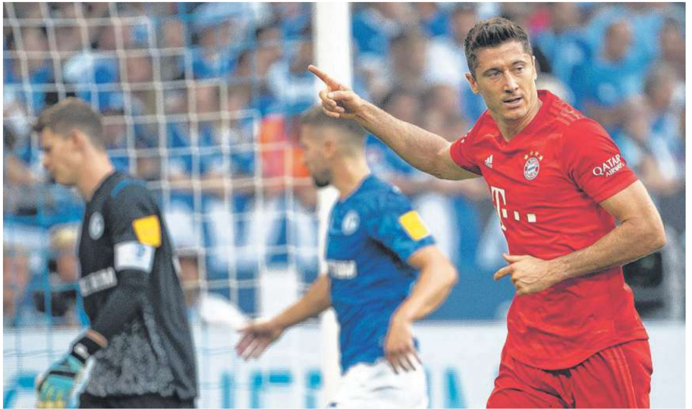
Nicht zu stoppen: Robert Lewandowski erzielte in dieser Saison alle fünf Tore des FC Bayern - auf Schalke traf er dreimal.

Der vom FC Barcelona ausgeliehene Brasilianer Coutinho, kam in der 57. Minute zusammen mit dem ebenfalls in den vergangenen Tagen erst von Inter Mailand verpflichteten Ivan Perisic in die Partie. „Er ist erst seit zweiein-