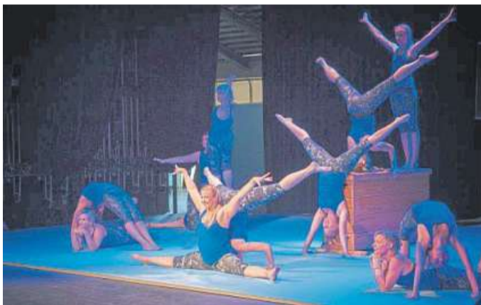
Die Holtorfer Sportvereinigung gehört zu den Aktiven.

Den ganzen Tag über gibt es auf dem Theatervorplatz, im Theatersaal sowie beim benachbarten „Tag der Vereine“ – im Bereich der Mühlen-