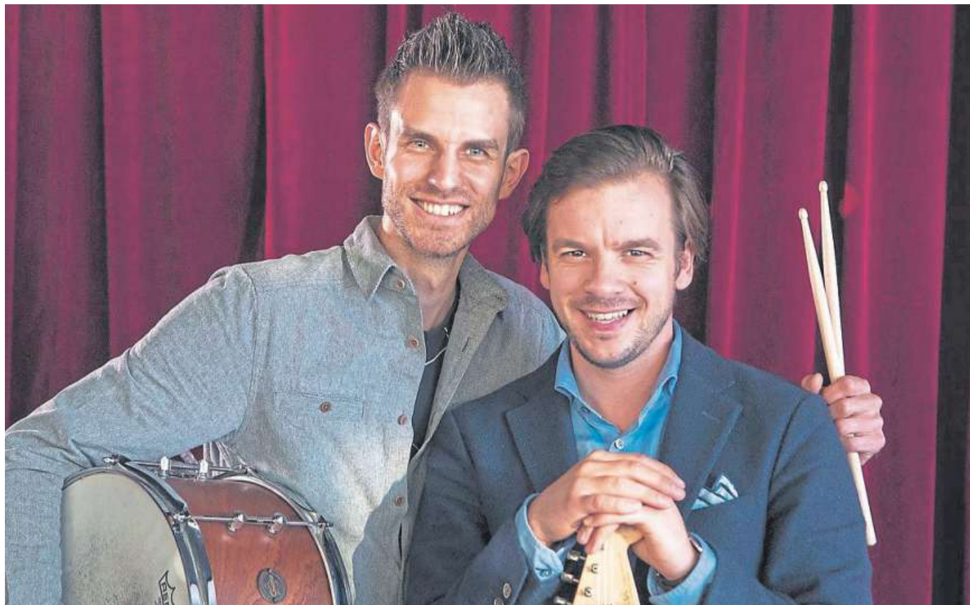
Das Team Bröker wird wieder zum beliebten Rudelsingen animieren: als Höhepunkt des Theaterfestes.