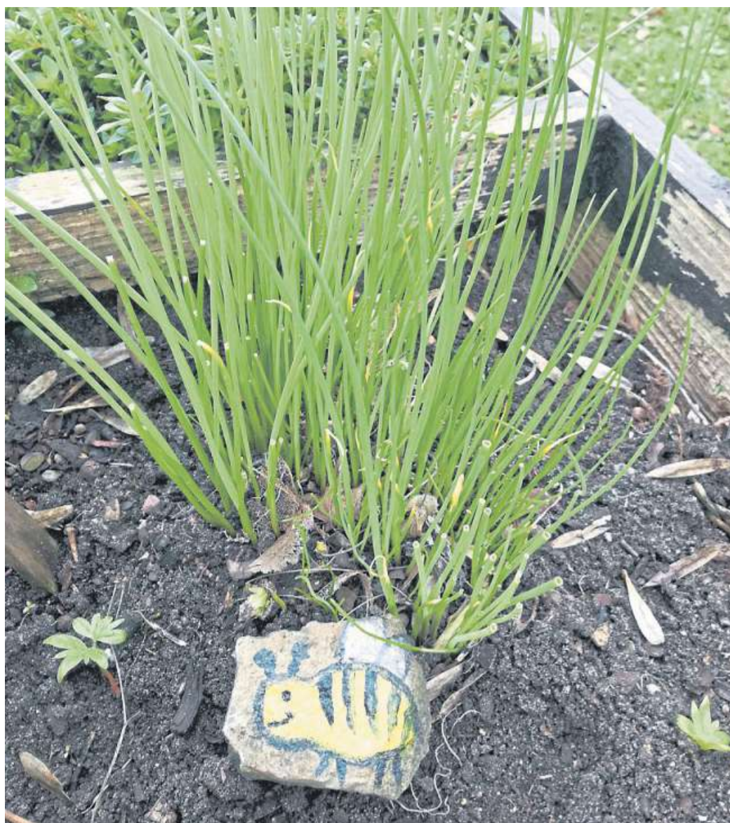
Mit einer Aktion zu den Weserstones beginnt die Woche der Diakonie.

Und einen Hinweis dazu hat der BUND dazu noch: „Achten Sie bei der Wahl der Grillkohle auf eine regionale Herkunft des Holzes, vor allem sollte kein Tropenholz in der Grillkohle sein.“ Und: Bei der Wahl des Fleisches sollten es nach Möglichkeit Produkte regionaler Weide-, Bio- oder Neulandhaltung sein. „Für Fleischerzeugung aus Massentierhaltung wird Soja aus Übersee verfüttert, für dessen Anbau auch der Regenwald gerodet wird“, erläutert der BUND. Na, dann: schönen Sonntag und guten Appetit!