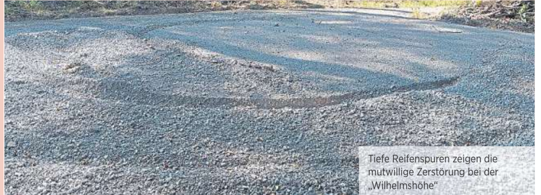
Tiefe Reifenspuren zeigen die mutwillige Zerstörung bei der „Wilhelmshöhe“

Die Wiederherstellung der historischen Promenaden hat gerade erst begonnen und schon