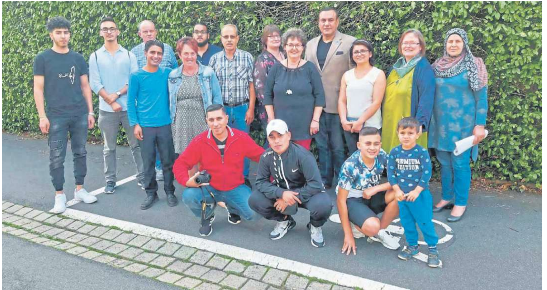
Die Gründungsmitglieder des Vereins „Menschen helfen Menschen“.

Und es gab viel zu berichten: von schlimmen Fluchterfahrungen, von getrennten Familien, gelungener Familienzusammenführung, von Feierabendgesprächen, von Integrationserfolgen in Form von Interviews, von Flüchtlingsinitiativen und Begegnungscafés, von Veranstaltungen, von Vereinen und Institutionen und ihrer Arbeit, von Unterschieden in den Kulturen und Gemeinsamkeiten, von Verzweiflung und nie endender Hoffnung auf