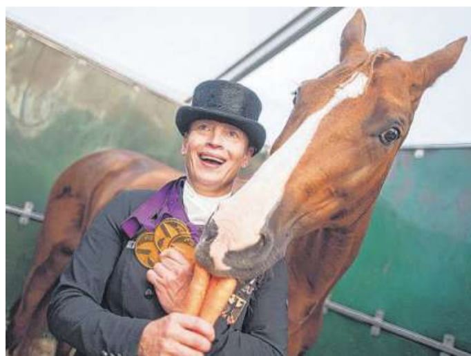
Unschlagbares Duo: Isabell Werth jubelt mit ihrer Stute Bella Rose ihren 20. Titel bei einer Europameisterschaft.

persönlichen Bestmarken“, kommentierte die Bundestrainerin: „Das ist unglaublich.“