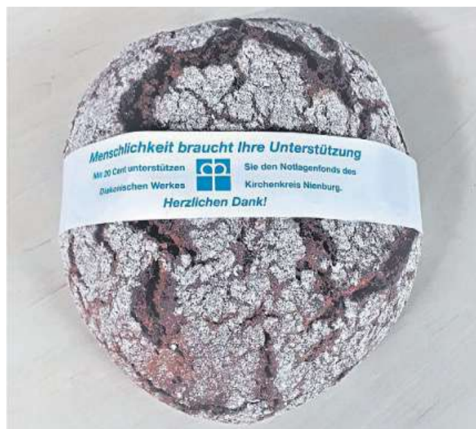
Einige Bäckereien bieten wieder Diakonie-Brod an.

Den Abschluss macht am Sonntag, 8. September, ein Diakonie-Gottesdienst im Stadtgarten an der Weser ab 17 Uhr. Die am 1. September gesammelten Statements werden dort einfließen. Musikalisch umrahmt wird der Gottesdienst von den Tonperlen und dem Posaunenchor St. Martin. Bei sehr schlechtem Wetter wird der Gottesdienst in die Kirche St. Martin in der Innenstadt verlegt.