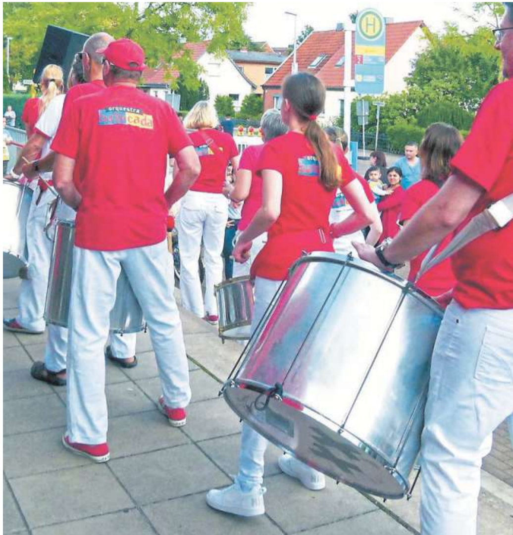
Sorgt auch in diesem Jahr beim Stadtteilfest in der Lehmwandlung für gute Laune und heiße Rhythmen: das Orchestra Batucada.

Informationen rund um die Angebote des Vereins wie „Eltern-Talk“ und „Hausaufgabenhilfe“, aber auch die zahlreichen Seniorenangebote werden präsentiert und als Gäste und Kooperationspartner sind das „QUINN“-Projekt der Stadt, die Klimaschutzagentur und Classic-Carsharing dabei. Die benachbarte Kita „Arche Noah“ ist traditionell mit einem Stand vertreten, an dem sich Kinder schminken lassen können und für das gute Wetter an diesem Nachmittag sorgt wie immer das „Orchestra Batucada“ aus Hannover mit Samba-Rhythmen, die jede Regenwolke vertreiben. „Das Bund-Länder-Pro-