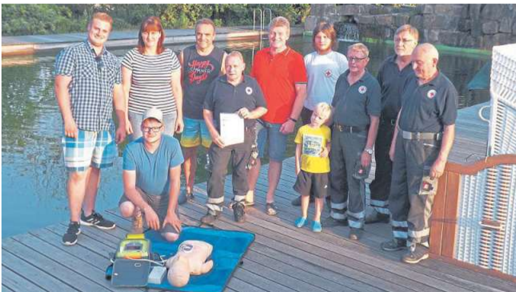
Den Defibrillator überreichten DRK-Vertreter an den Vereinsvorstand.