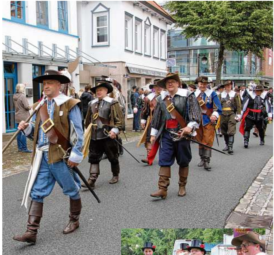
„Dat Wählige Rott“ ist fester Bestandteil des Scheibenschießens.