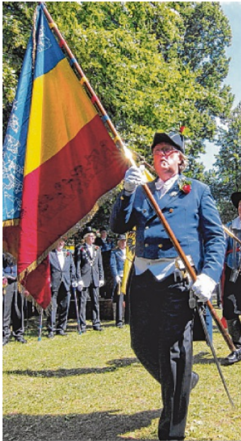
Der Papagei an der Königskette erinnert heute noch an das frühere Schießen.

Das Nienburger Scheibenschießen hat eine lange Geschichte