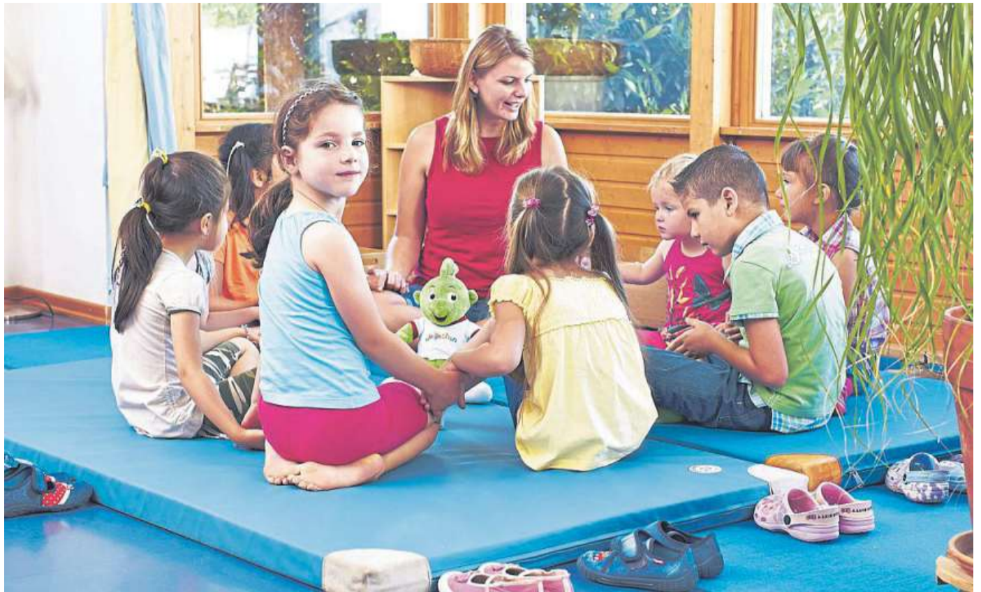
Auch in den Kitas in Drakenburg, Binnen, Leese und Erichshagen-Wölpe wurde das Präventionsprogramm eingesetzt.

In einem anspruchsvollen Studiendesign mit 62 bundesweit zufällig ausgewählten Kindertagesstätten in ländlichen und städtischen Regionen wurden die Effekte des Programms untersucht. Während die eine Hälfte der ausgewählten Einrichtungen das Programm in den Kita-Alltag integriert hatte, nahmen die 31 anderen aus der sogenannten Kontrollgruppe im Messzeitraum von zwölf Monaten nicht an JolinchenKids teil.