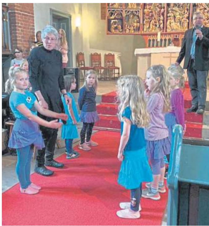
Auf geht's zur „Tarantella“.