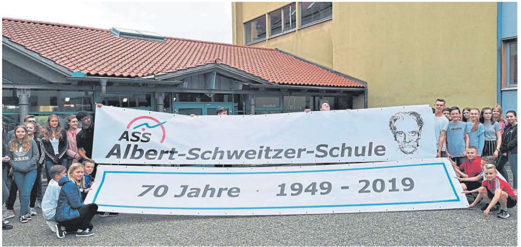
Vor 70 Jahren erhielt Nienburgs ASS ihren Namen: Seit Donnerstag weist dieses Banner auf das besondere Ereignis hin.