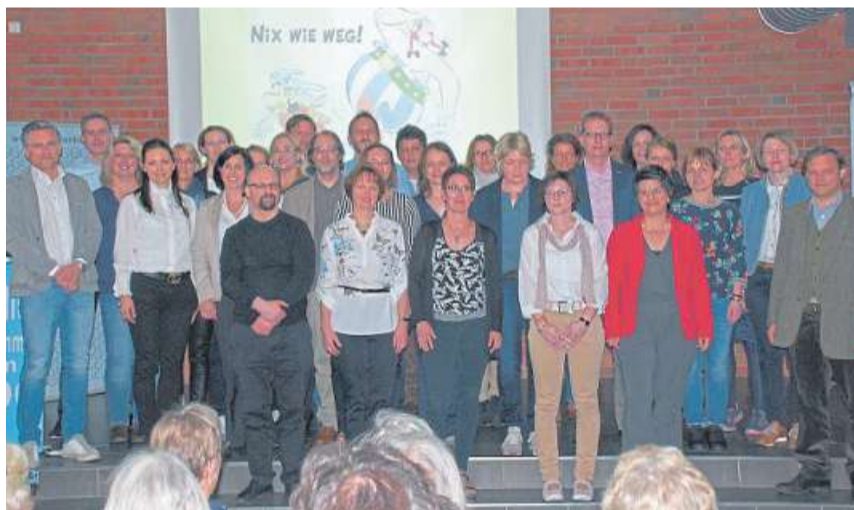
Freudiges Wiedersehen auch nach 40 und nach 25 Jahren. In beiden Fällen bereits mit männlichen Mitschülern.