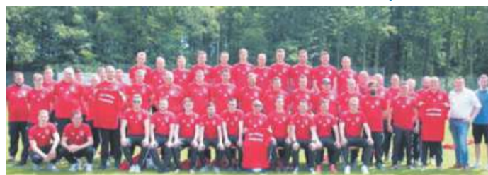
Herrenmannschaften des TSV Loccum im neuen Dress

Dank einer großzügigen Spende von gleich drei lokalen bzw. regionalen Unternehmen freuen sich die Fußballer der drei Herrenteams des TSV Loccum e.V. 1895 zum Abschluss der diesjährigen Saison über neue Trainingsbekleidung und können sich zur neuen Saison im einheitlichen Dress präsentieren. Die drei Mannschaften sowie die gesamte Fußballsparte möchten sich hierfür ganz herzlich bei der Fa. REWE aus Rehburg, beim Autohaus Schmidt + Koch aus Bremen sowie bei der Fa. Taures Gesellschaft für Investmentberatung aus Hamburg bedanken. Ein großes Dankeschön geht auch an die Fa. Sport-Shop Hiller aus Rehburg für die professionel-