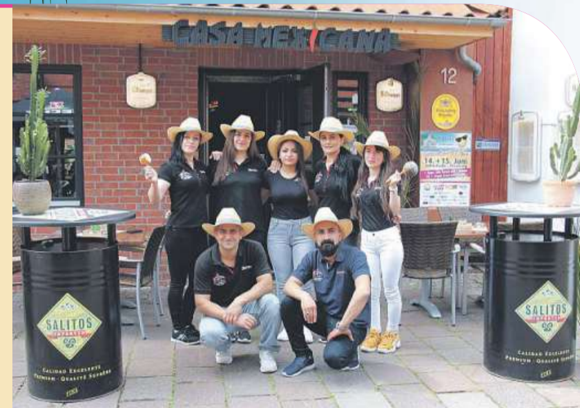
Das Team vom Casa Mexicana freut sich auf viele Besucher.