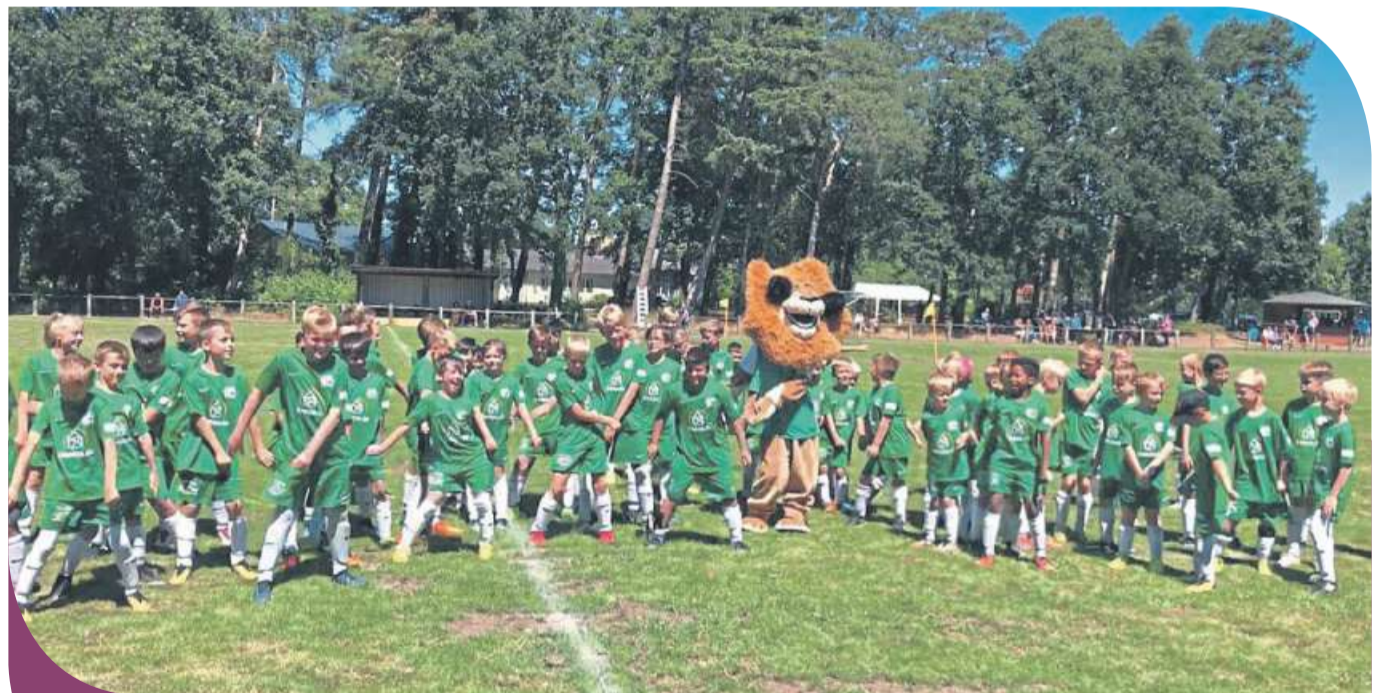
Die Fußballschule des Bundesligisten SV Werder Bremen war im vergangenen Jahr zu Gast auf dem Sportgelände des SV Hämehausen. 76 Kinder zwischen sechs und 13 Jahren nutzten die Möglichkeit, intensives Training unter professioneller Leitung zu erleben und bekamen das Werder-Camp-Abzeichen.