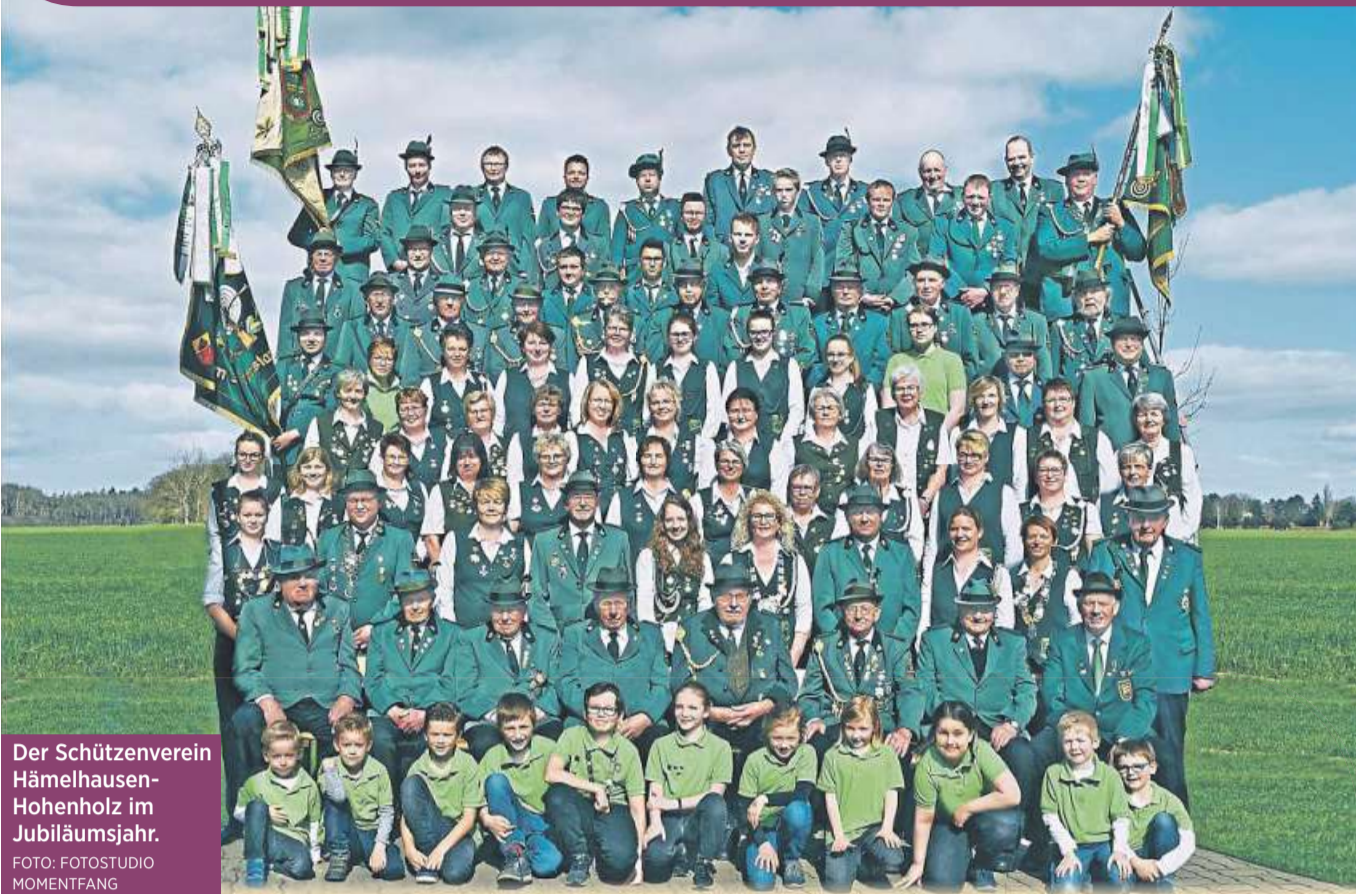
Der Schützenverein Hämelhausen-Hohenholz im Jubiläumsjahr.

15. Juni Schießen und Königsball • 22. Juni Beatabend • 23. Juni Festkommers