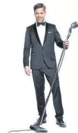
Tom Gaebel kommt am 24. August nach Haßbergen.

Da alle Mitglieder der Band Sänger und Multi-Instrumentalisten sind, haben „The Whistlin' Donkeys“ einen unverwechselbaren eigenen Sound geschaffen, für den sie bekannt geworden sind. Sie haben traditionellen und zeitgenössischen Stücken ihren eigenen Stempel aufgedrückt.