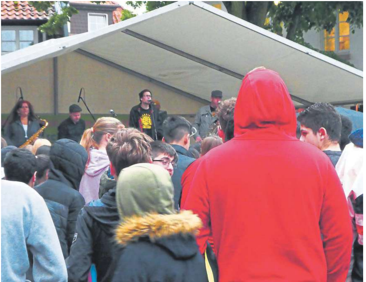
„Komm, wir ziehen in den Frieden“: Rund 1300 Schülerinnen und Schüler waren zum „Fest der Demokratie“ auf den Kirchplatz gekommen.