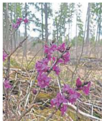
Gefährlich, giftig, schön: der wilde Seidelbast.

„Wir möchten das Wissen um giftige Pflanzen verbreiten, um Eltern und Erzieherinnen Ängste und Unsicher-