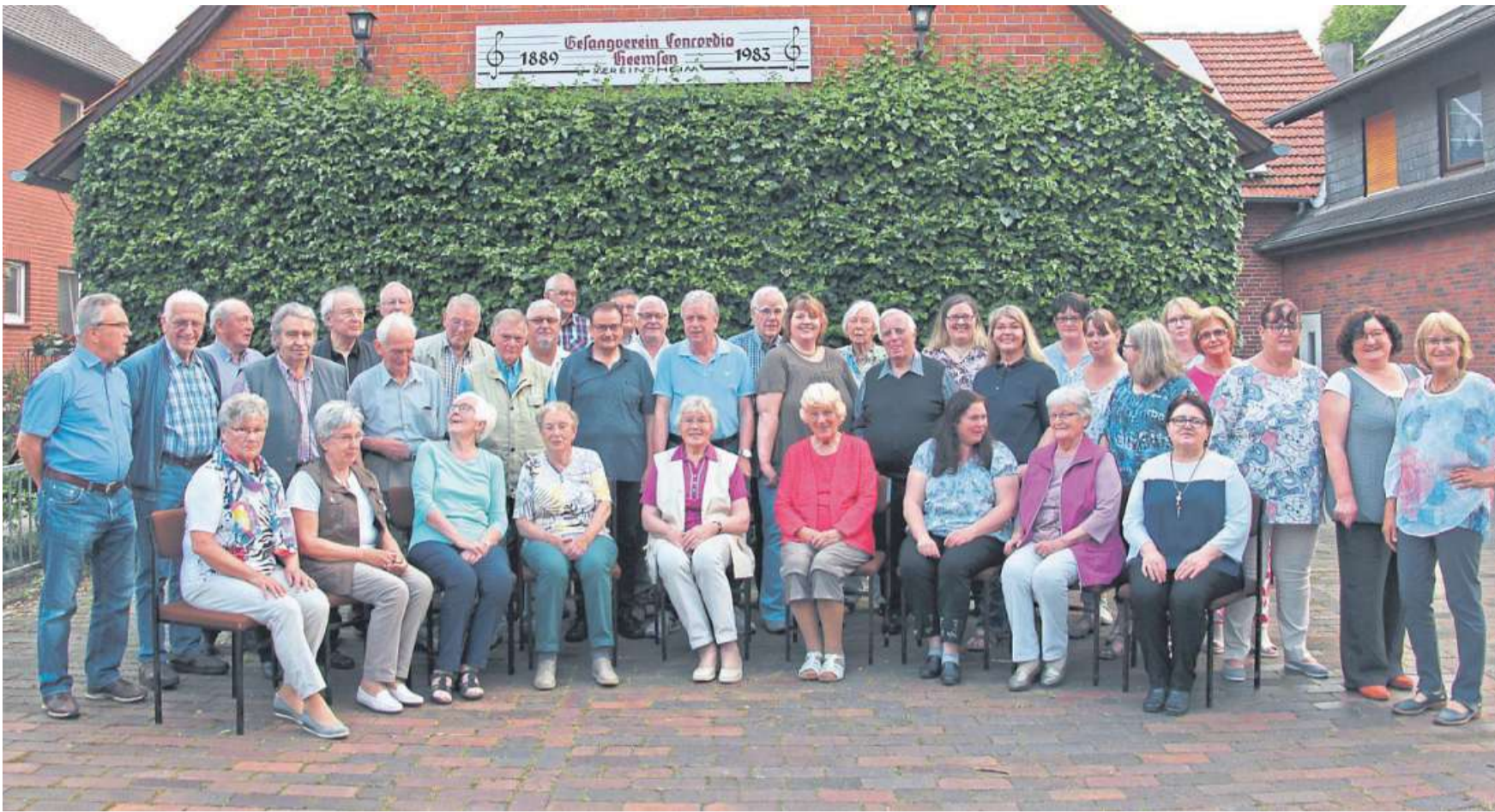
Der MGV Erichshagen-Wölpe und der Gemischte Chor „Concordia“ Heemsen arbeiten schon seit Jahren gut zusammen. Am kommenden Sonntag richten sie – nicht zum ersten Mal – in der Aula der Heemser Schule das Kreis-Chorfest aus. Erwartet werden rund 200 Sängerinnen und Sänger.