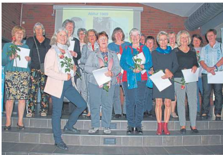
Eine Rose für die Ehemaligen: Das MDG hatte die Abiturjahrgänge 1959 (oben links) und 1969 (oben rechts) zu einem Wiedersehen eingeladen.