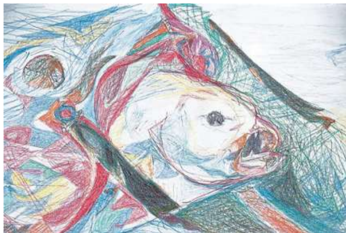
Arbeiten von Klaus Focke aus Kirchwahlingen sind ab dem 12. Mai in Rethems Burghof zu sehen.

Vernissage in Rethems Burghof am 12. Mai um 15 Uhr / Klaus Focke aus Kirchwahlingen stellt seine Werke aus