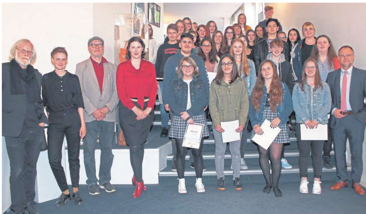
Über 30 Jugendliche nahmen am 1. Jugendkunstpreis des Landschaftsverbandes Weser-Hunte teil.