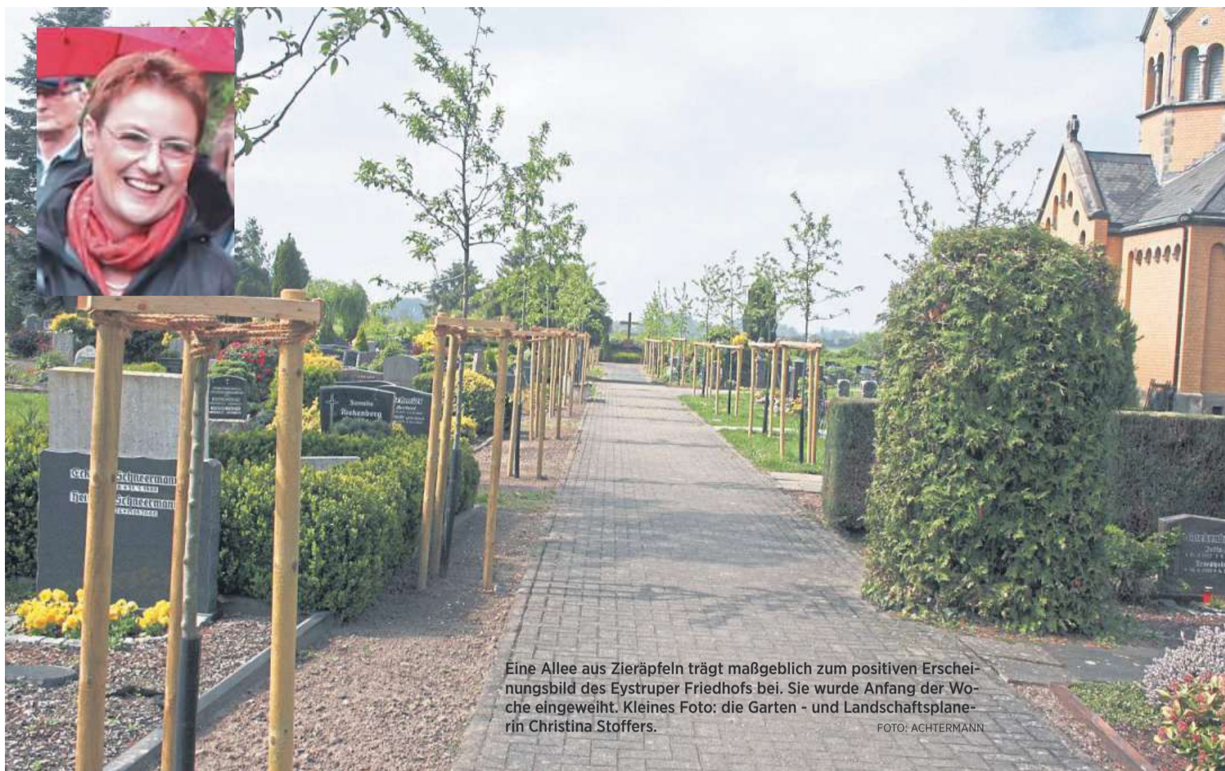
Eine Allee aus Zieräpfeln trägt maßgeblich zum positiven Erscheinungsbild des Eystruper Friedhofs bei. Sie wurde Anfang der Woche eingeweiht. Kleines Foto: die Garten- und Landschaftsplanerin Christina Stoffers.