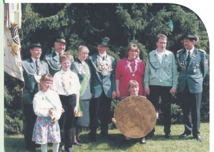
Das bisher letzte Jubiläum feierte der Verein vor 25 Jahren.