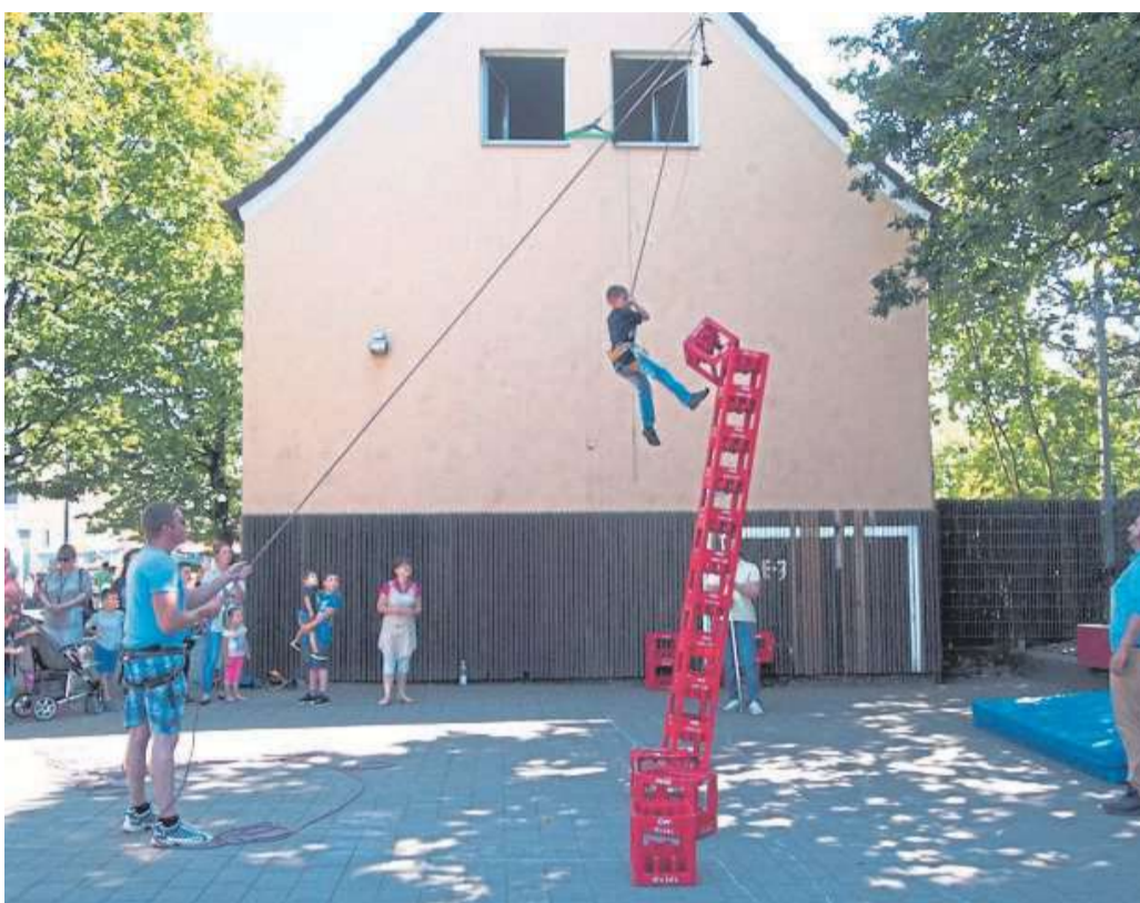
Am kommenden Sonnabend lädt das CJD anlässlich seines 50-jährigen Bestehens zu einer bunten Feier in den Zeisigweg ein.

Eröffnet wird die Feierstunde um 12 Uhr mit einer ökumenischen Andacht und um 13 mit Begrüßungsworten von Landrat Detlev Kohlmei-