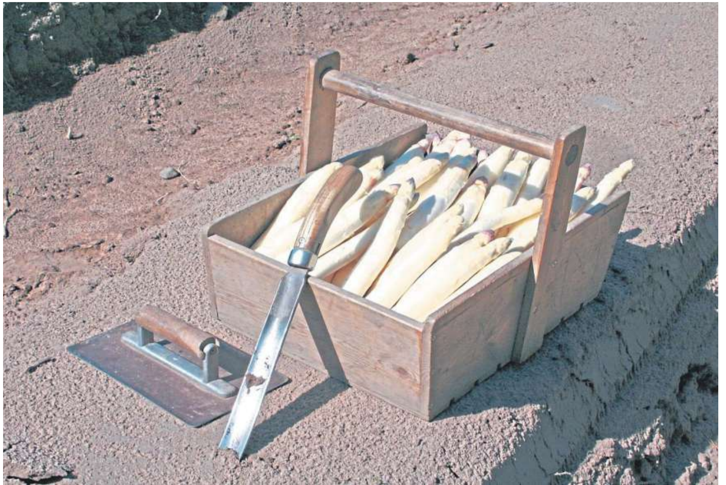
Nienburgs Edelgemüse ist nicht nur bei den Einheimischen beliebt. Die Spargelzeit lockt auch zahllose Gäste in die Region. Die HARKE am Sonntag verlost unter ihren Leserinnen und Lesern fünf Spargelkisten (unten links). Unten rechts das Spargelmuseum. FOTO: MWT

Ein Höhepunkt der diesjährigen Saison ist das Nienburger Spargelfest: Am Sonntag, 19. Mai, findet es rund um das Niedersächsische Spargelmuseum mit der Kür der Nienburger Spargelkönigin statt. Mit dabei sind wieder niedersächsische Produktköniginnen. Weiterhin gibt es Führungen durch das Spargelmuseum, Spargelspezialitäten, ein Schaukochen mit dem DEHOGA-Kreisverband Nienburg und das Nienbur-