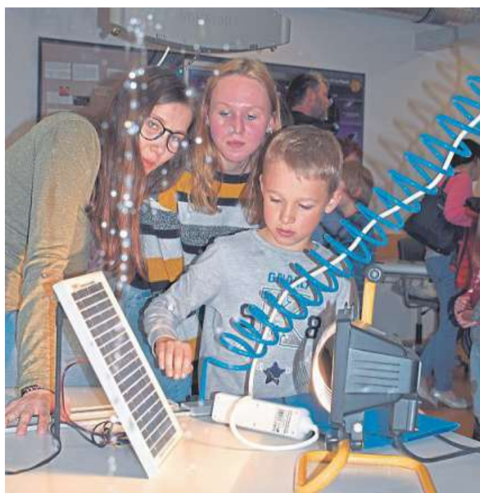
Die Fontäne läuft durch die Photovoltaik-Anlage, also nur bei genügend Licht.