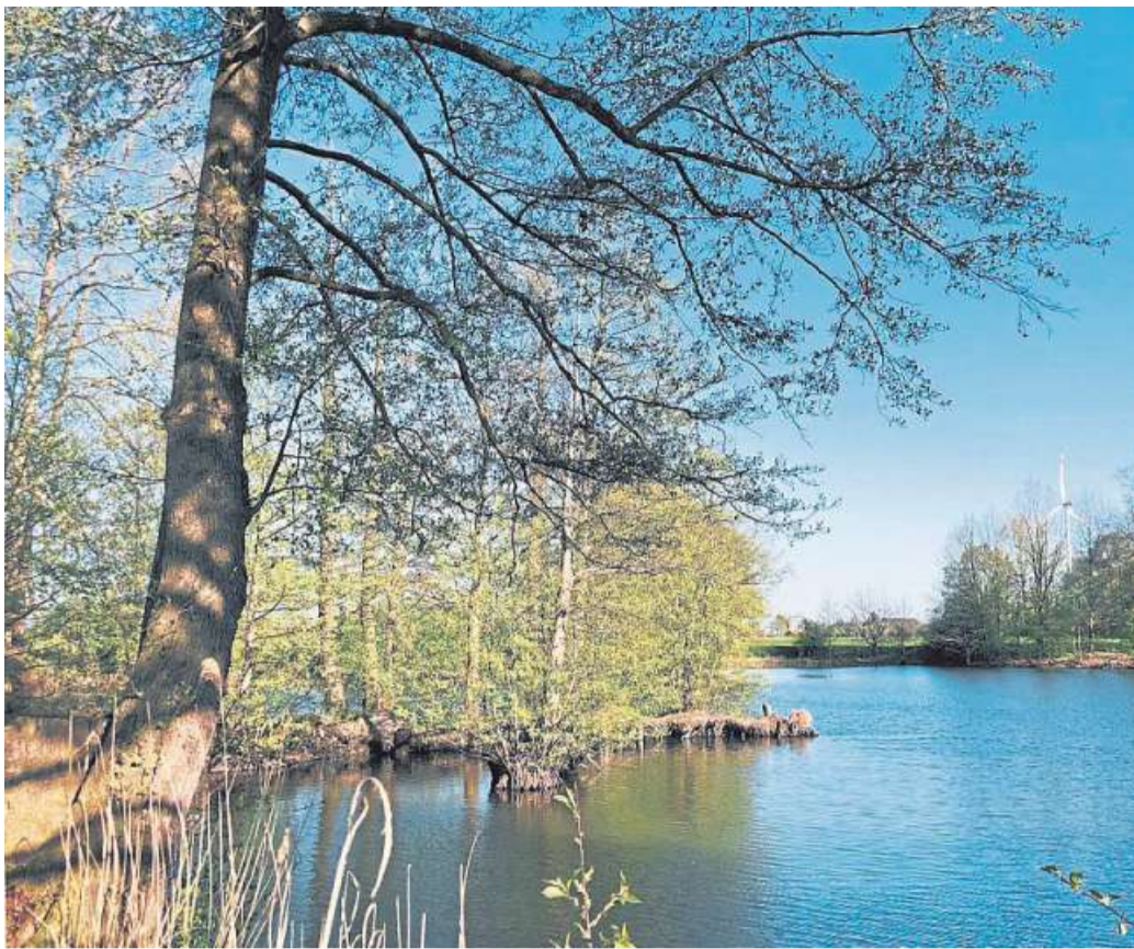
Wer mit dem Fahrrad auf dem Grafen-Ring unterwegs ist, passiert unter anderem den Bucker Dom und den Alveser See.