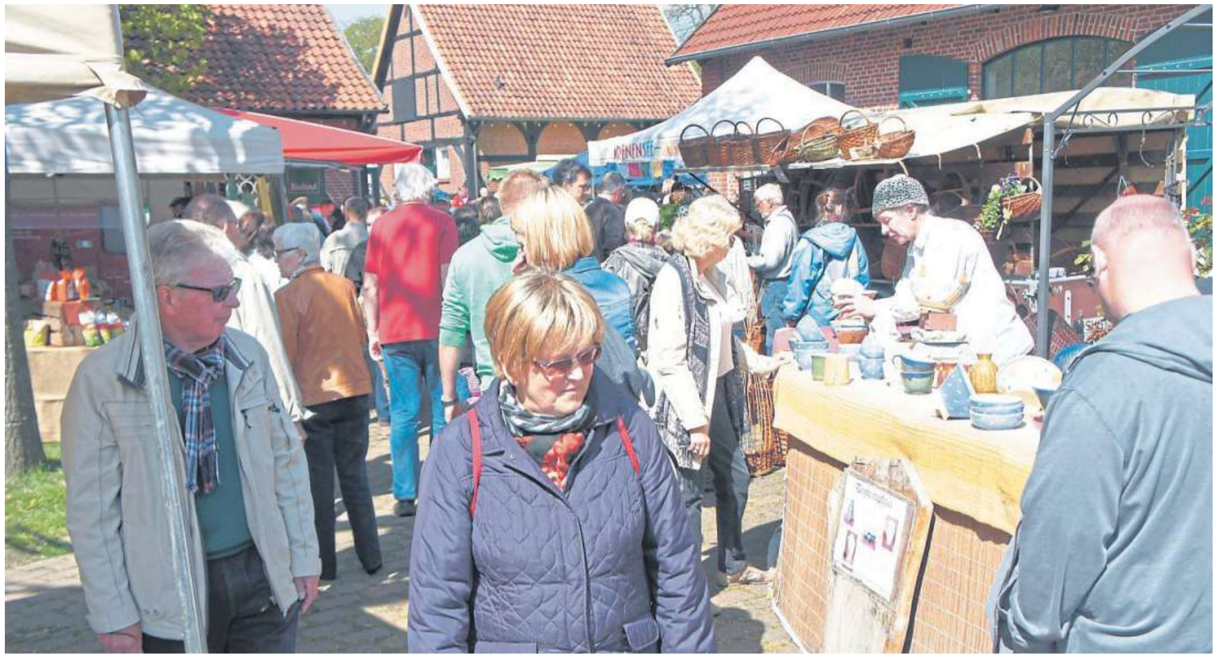
Der Ökologische Markt in Mardorf zieht stets zahlreiche Besucher an.