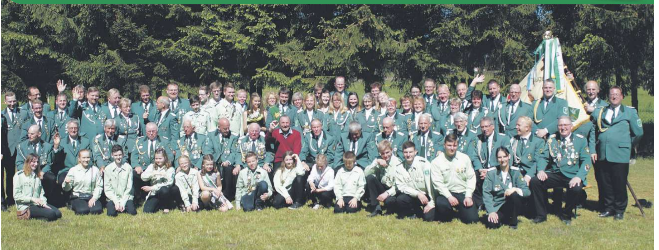
Der Schützenverein Gandesbergen freut sich über das 100-jährige Bestehen.

des Schützenvereins Gandesbergen Samstag, 11. Mai und Sonntag, 12. Mai 2019