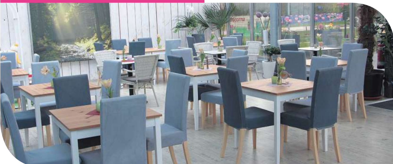
Hausgemachte Kuchen und Torten können Gäste im Café genießen.

Wir gratulieren und wünschen für die Zukunft weiterhin viel Erfolg.