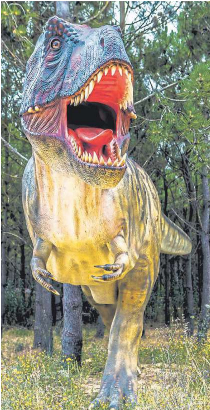
Der Dinopark ist in die neue Saison gestartet.

Die lebensgroßen, wissenschaftlich korrekten Dinosauriermodelle werden in Abstimmung und enger Zusammenarbeit mit internationalen Wissenschaftlern gebaut. Als anerkanntes Forschungs- und Kompetenzzentrum arbeitet der Dinopark seit Jahren in Kooperationen mit dem Steinmann-Institut der Uni-