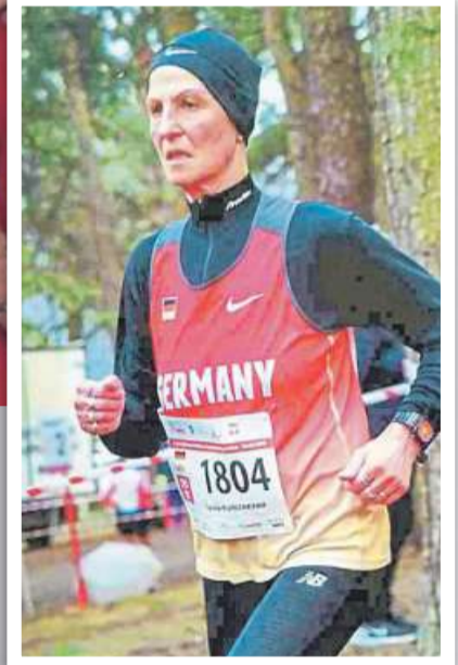
eine Medaille mit nach Hause an die Mittelweser zu bringen. hgh

Britinnen waren schneller als das Trio des Deutschen Leichtathletik-Verbandes. Mit diesem Erfolg gelang es der Schwimmmeisterin aus dem Nienburger „Wesavi“, wie schon bei all ihren bisherigen WM-Teilnahmen, auch dieses Mal