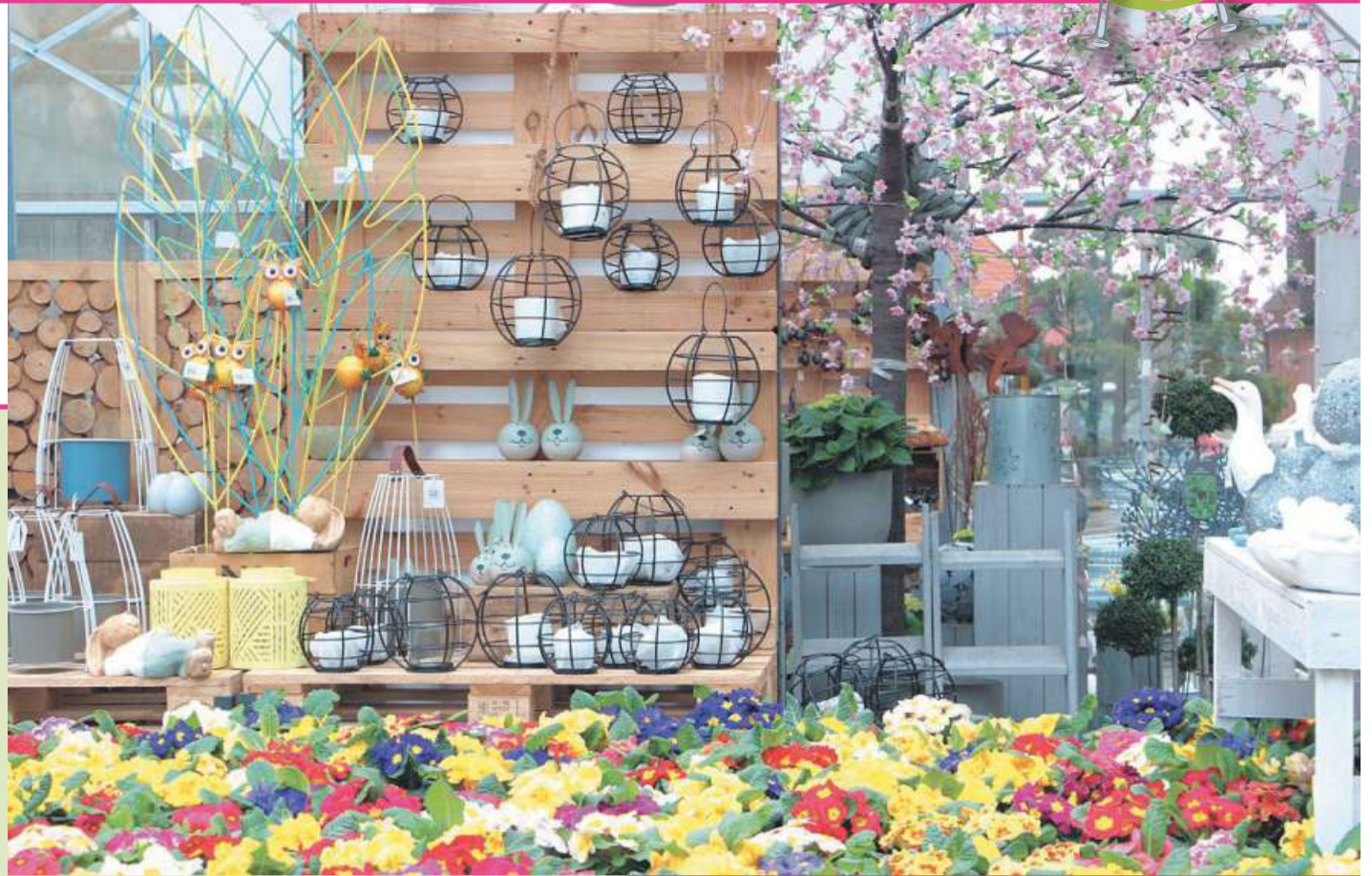
Blumen und Schönes für den Frühling bietet das Gartencent.