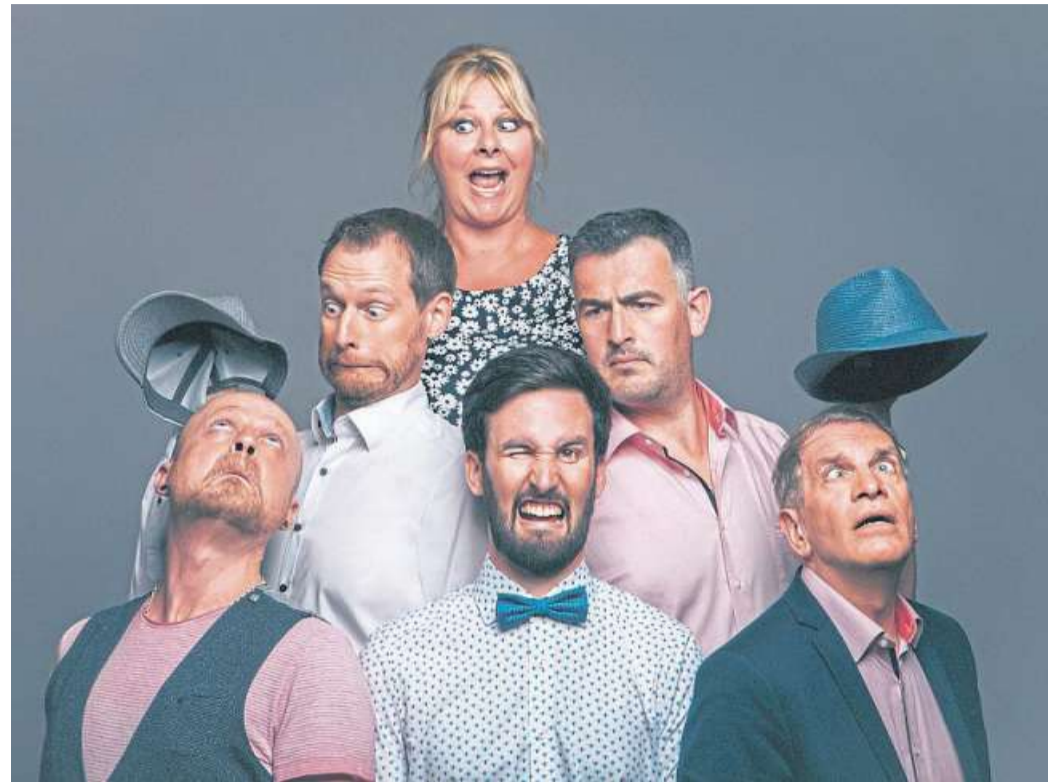
Das Ensemble CASH-N-GO tritt mit fünf Sängern plus Sängerin auf.

Das Ensemble CASH-N-GO aus Augsburg ist einer der Unterhaltungsschlager der europäischen A Cappella-Szene, räumten die fünf Sänger mit ihrer Sängerin doch beim Internationalen A Cappella Wettbewerb in Graz bereits mehrere Preise ab. Überhaupt bietet die Band einen abwechslungsreichen Mix aus Pop-, Rock-, R&B- und Jazznummern, eingebet-