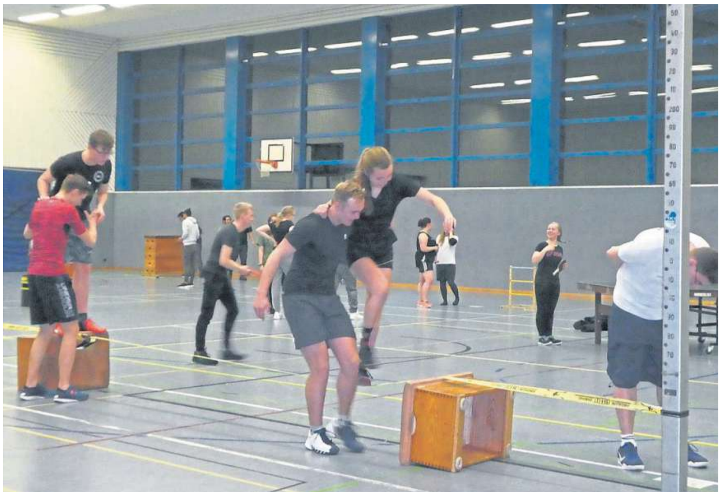
Integration durch Sport: für den Mitternachtssport 2019 hatten sich acht Teams angemeldet.

CJD-Projekt „Willkommen in Nienburg“ / Heute: der Mitternachtssport 2019 in der TKW-Halle