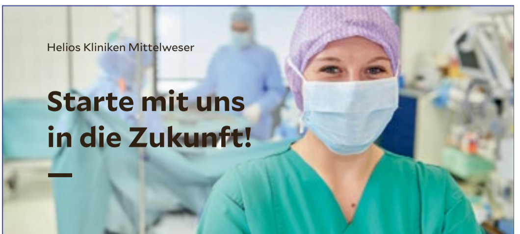
Helios Kliniken Mittelweser