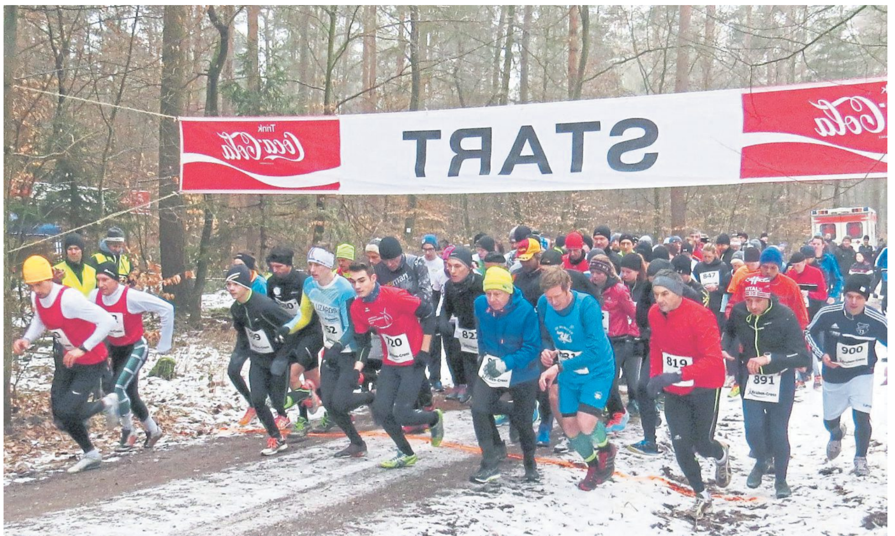
Die Frage nach den Wetterbedingungen beim Krähen-Cross 2019 lässt sich heute noch nicht beantworten. Vor zwei Jahren lag Schnee beim Start über 5000 Meter.