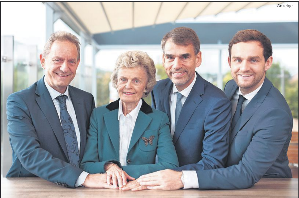
Inhaberfamilie Struckmann in 3 Generationen!