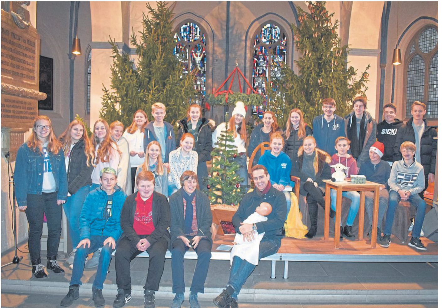
„Zur Krippe her kommet..“ hieß das Stück, zu dem das MDG in die Martinskirche einlud.

19 Schülerinnen und Schüler hatten sich neben dem normalen Unterricht getroffen,