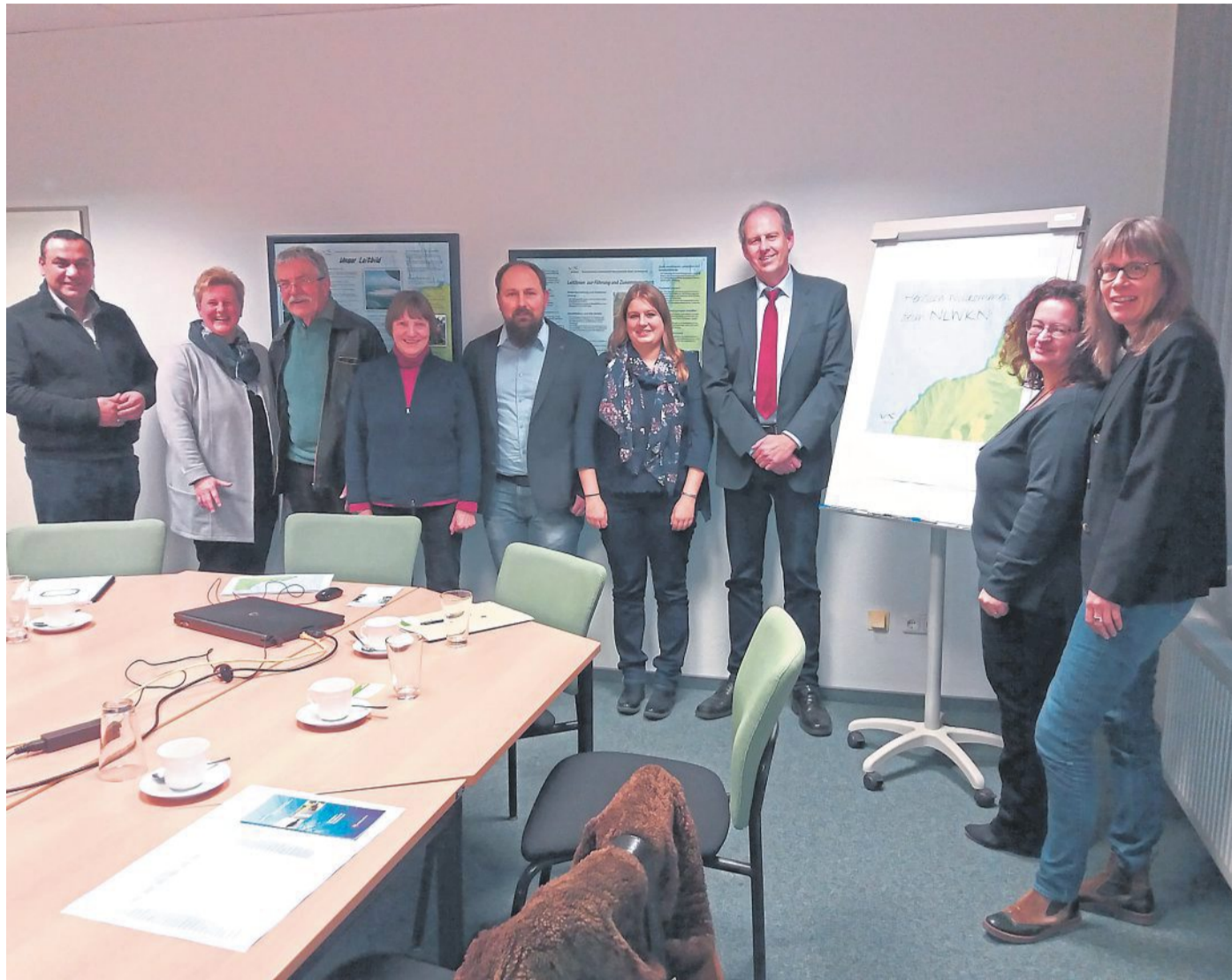
Wie steht es um unser Wasser? Um diese Frage zu klären, besuchte die Nienburger Kreistagsgruppe Bündnis 90/Die Grünen und Die Linke den Niedersächsischen Landesbetrieb für Wasserwirtschaft, Küsten- und Naturschutz in Sulingen.

Weiter heißt es: Alle vorgestellten Maßnahmen müssen von einer Reduzierung der Belastungen durch Stickstoff und Phosphor begleitet werden. Die Herbstdüngung kann nur noch in begründeten Ausnahmen zugelassen werden. „Bevor wieder über eine ‚eiskalte Enteignung der Landwirte‘ lamentiert wird: die Gewässerrandstreifen sollten mehr als fünf Meter breit sein. In Baden-Württemberg sind sogar zehn Meter Breite vorgeschrieben. Bei weiterer Belastung unserer Gewässer wird schließlich die steuerzahlende Mehrheit von