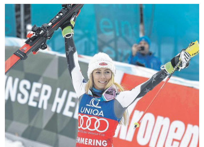
Ein gewohntes Bild: Mikaela Shiffrin beim Jubel.

Elf der zwölf vergangenen Slalom-Rennen hat die junge