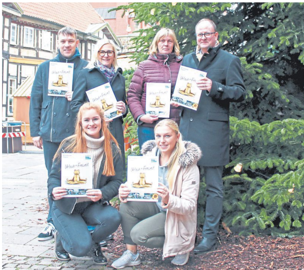
Das Team der Mittelweser-Touristik mit der neuen Broschüre.

LANGENDAMM. Traditionell am zweiten Sonntag des Jahres laden der Langendammer Ortsrat und die St.-Johannis-Gemeinde zum Neujahrsempfang in das Gemeindehaus ein. In diesem Jahr ist es der 13. Januar, wenn im Anschluss an den 10-Uhr-Gottesdienst zurückgeschaut, aber auch ein Blick ins dann noch ganz junge Jahr geworfen werden soll. Dazu gibt es wieder Suppe und Getränke. Eingeladen fühlen dürfen sich neben den Vertreterinnen und Vertretern der örtlichen Vereine auch alle anderen Einwohnerinnen und Einwohner, heißt es in der Einladung der Veranstalter. nis