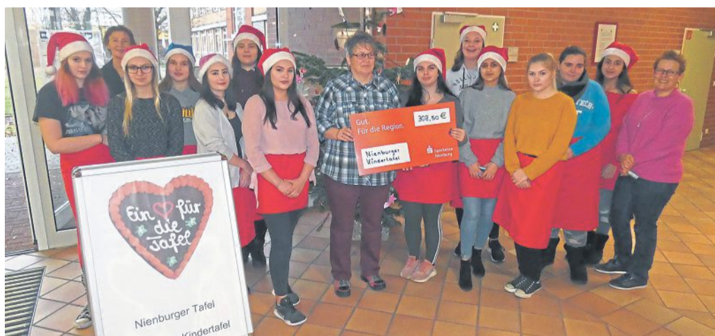
Das Foto zeigt die Schülerinnen der BFS Hauswirtschaft mit ihren Fachpraxislehrerinnen sowie Frau Walter von der Nienburger Tafel.