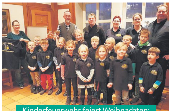
Kinderfeuerwehr feiert Weihnachten: Neue Poloshirts und Spenden für die Brandverletztenhilfe

Mit den „Löschhummeln“ wissen die Ortsfeuerwehren Landesbergen und Brokeloh einen starken Nachwuchs hinter sich. Die Kinderfeuerwehr traf sich jüngst zur Weihnachtsfeier am Feuerwehrgerätehaus – große Freude herrschte bei den Kindern, als es zur Überraschung in den Landesberger Mühlengasthof ging. Die Gastgeber hatten der Kinderfeuerwehr neue einheitliche Poloshirts gespendet – beim Abendessen bedankten sich die Kinder und das Betreuer-Team für die Unterstützung bei der Beschaffung der neuen Bekleidung. Doch die Kinder spendeten auch selbst in der Weihnachtszeit für einen guten Zweck: Mit einem Verkaufstand beim Landesberger Weihnachtsmarkt sammelten die „Löschhummeln“