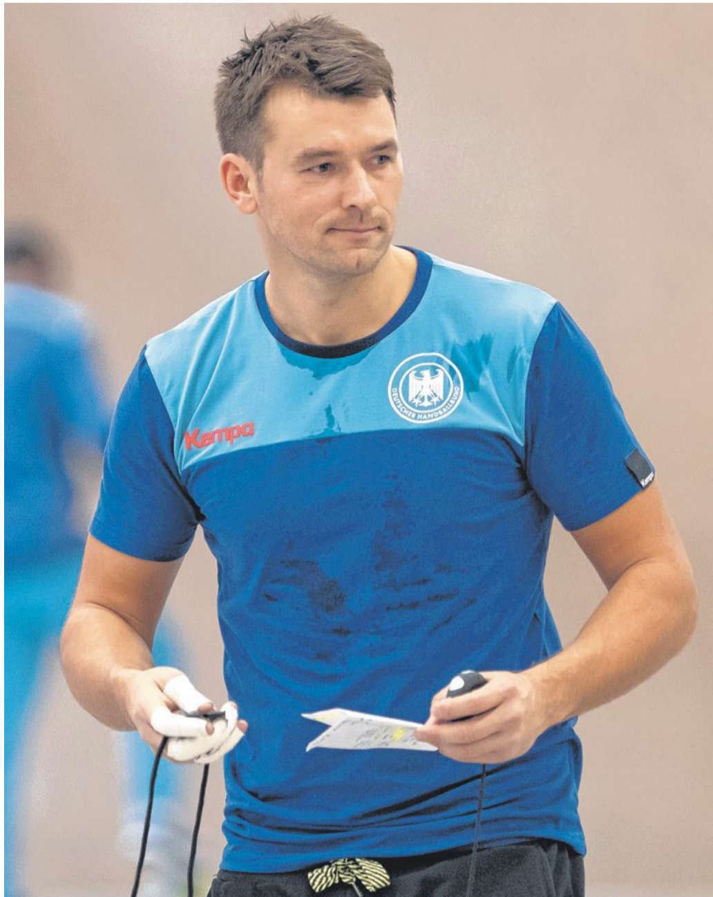
Endlich geht es los: Bundestrainer Christian Prokop bereitet sich seit Freitagabend mit der Handball-Nationalmannschaft in Barsinghausen auf die kommende Heim-WM vor.

Für den Kurz-Lehrgang in Barsinghausen setzt Prokop