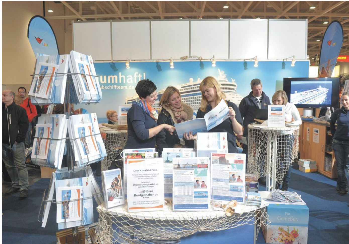
In Hannover findet vom 31. Januar bis 4. Februar die abf 2018 statt. Kreuzfahrten sind ein großes Thema.

Darüber hinaus finden Urlaubshungrige in der Themenwelt „Reisen & Urlaub“ bei rund 200 Reisebüros, Fremdenverkehrsämtern und Busunternehmen individuelle Beratung zu attraktiven Destinationen rund um den Globus. Interessante Impressionen bietet zudem das Reisen