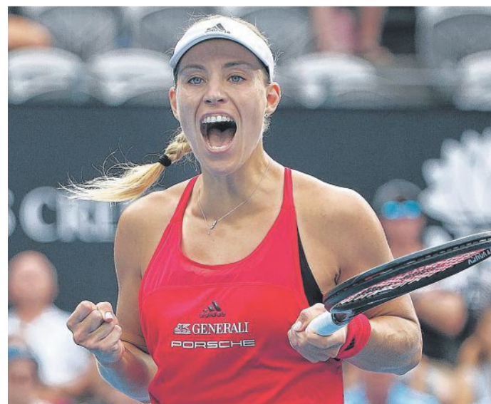
Angelique Kerber geht nach dem Turniersieg in Sidney gestärkt in die am Montag beginnenden Australian Open.

„Eine Angie, als hätte es 2017 nicht gegeben. Es ist schön, sie so zu sehen“, sagte die deutsche Damen-Chefin Barbara Rittner. „Mit dem Selbstvertrauen, dem offensiven Spiel und dem verbesserten Aufschlag ist hier alles möglich“, sagte Rittner.