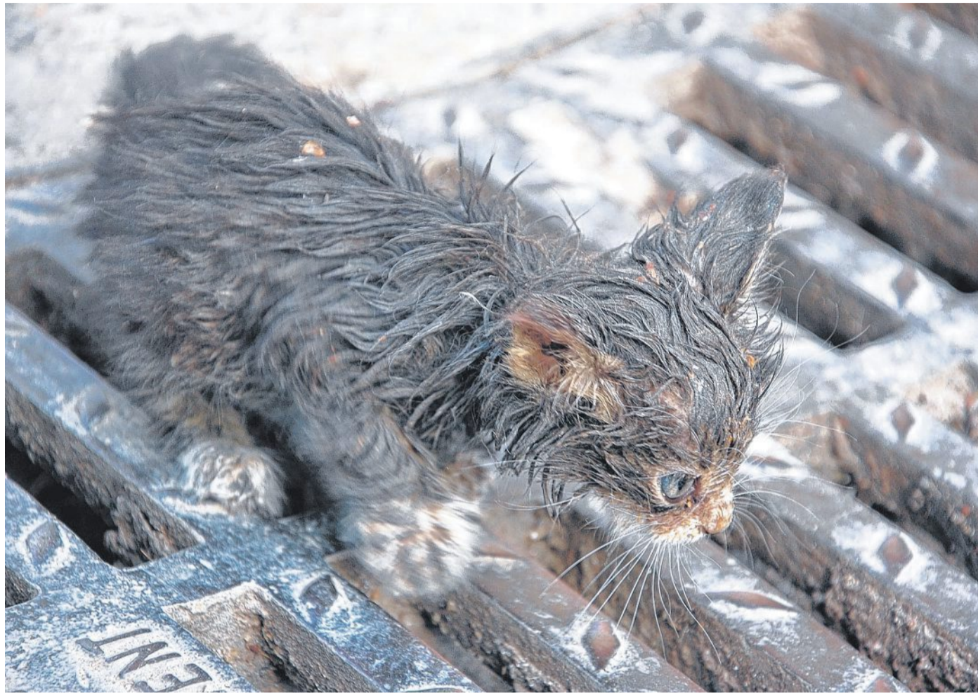
Auch Nienburgs Tierschützer atmen auf. Das Land hat 200 000 Euro für die Kastration verwilderter Hauskatzen zur Verfügung gestellt.

Die Tierärztekammer verwaltet den Förderfonds, in den die Projektmittel fließen. Der Landesverband des Deut-