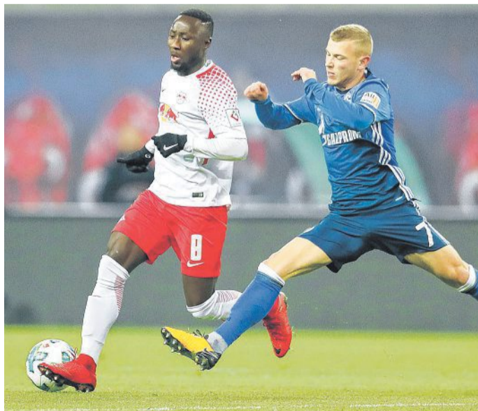
Leipzigs Naby Deco Keita (links) ist hier einen Schritt schneller als Schalkes Max Meyer.

Tedesco reagierte - noch nicht in der Pause, aber wenig später. Denn RB bestimmte die Partie, war dem zweiten Tor nahe, als Daniel Caligiuri einen Sabitzer-Freistoß an den S04-Pfosten lenkte. In Marko Pjaca und Bree Embolo brachte der Gäste-Coach zwei frische Kräfte. Und gleich die erste Aktion nach deren Einwechslung brachte den Ausgleich. Abwehrchef Naldo war aufgerückt und traf nach einem Freistoß per Kopf. Also musste Werner ran. Er kam für Augustin und traf nur sechs Minuten nach seiner Einwechslung. Und nun machten die RB-Profis die mühsame erste Halbzeit vergessen und erhöhten.