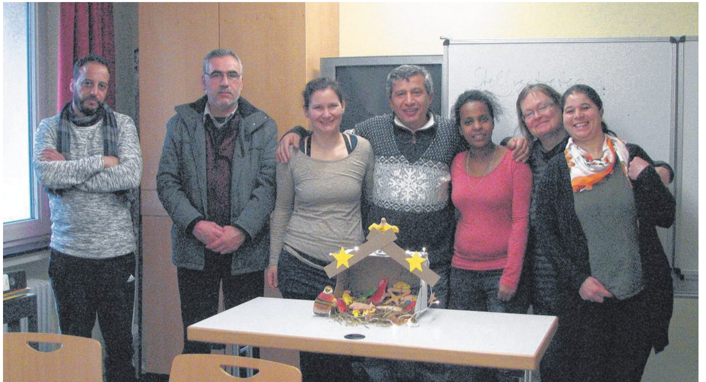
Ende der PerFACT-Maßnahme: Teilnehmer der PerFACT-Maßnahme verabschiedet.

Sowohl für uns als Team, als auch für die teilnehmenden stellte das Projekt eine Bereicherung dar. Im Verlauf gab es immer wieder regen Austausch über Gemeinsamkeiten und Unterschiede