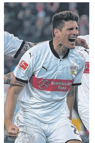
Stuttgarts Stürmer Mario Gomez.