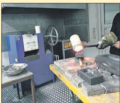
Eigene Schmelzöfen minimieren Kosten bei Der GOLDMANN

Schnell, diskret und unkompliziert Ihre erste Adresse für Goldankauf in Nienburg