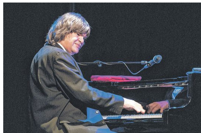
... gemeinsam mit Axel Zwingenberger.

➔ Tickets kosten an der Abendkasse 30 Euro. Im Vorverkauf gibt es sie für 25 Euro im Autohaus Grünhagen, Auf dem Kuhkamp 3 in Hoya unter Telefon (04251) 672740, bei Leder Meyer in der Georgstraße 20 in Nienburg unter Telefon (05021) 3147, in der Buchhandlung Meyer, Bahnhofstraße 44 in Bruchhausen-Vilsen, Telefon (04252) 859, und bei Blumen Hartmann, Obere Straße 1-3 in Verden, Telefon (04231) 83821.