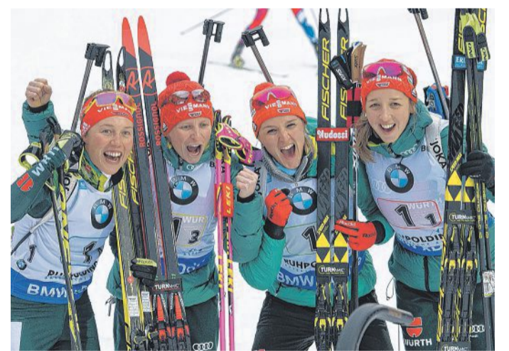
Im Jubel vereint präsentiert sich die Frauen-Staffel nach dem Erfolg in Ruhpolding.

40 Tage vor dem Teamrennen am 22. Februar in Pyeongchang feierten die deutschen Skijägerinnen ihren zweiten Saisonsieg und standen damit in allen drei Staffelfrennen des Winters auf dem Podium. Vor 24 000 Zuschauern gewann das deutsche Quartett gestern vor Italien (2,9 Sekunden zurück) und Schweden (17,2). „Es ist cool, vor dieser Kulisse zu ge-