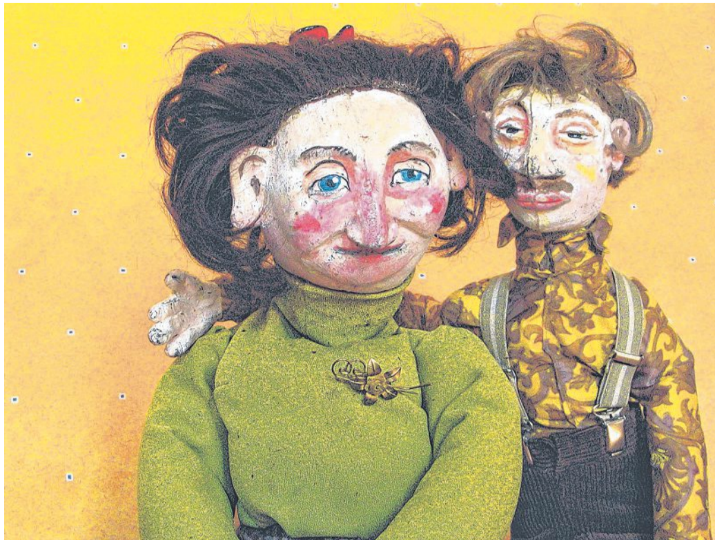
Loriot's „Szenen einer Ehe“ stehen im Mittelpunkt des Puppenspiels.

Wer kennt nicht die Dialoge aus „Das Ei“: „Berta ... das Ei ist hart“, oder „Der Feierabend“: „Was machst du gerade, Hermann?“, oder „Die