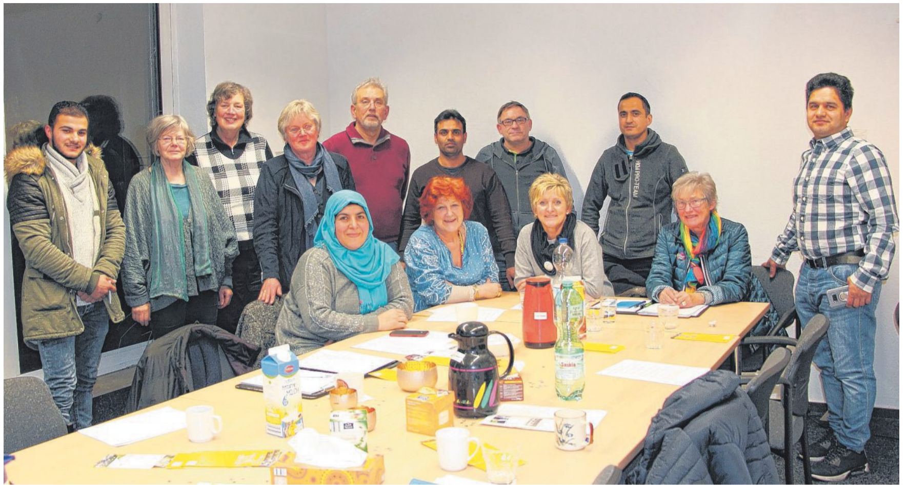
Die Flüchtlingsinitiativen aus Nienburg, Holtorf, Liebenau und Marklohe waren in den Räumen des Diakonischen Werks in Nienburg zusammengesessen, um über weitere gemeinsame Angebote zur Integration von Flüchtlingen zu beraten.

Jede Show kann für sich besucht werden. Der Eintritt ist jeweils frei. Und wer sich für mehr als nur einen Vortrag interessiert, kann in den Pausen einen guten Kaffee oder Kakao, versüßt mit exotischem Gebäck, und einen feinen Rum aus Kuba oder Costa Rica Pausen probieren. DH