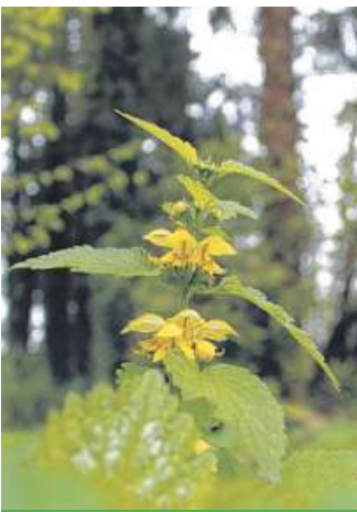
Teilnehmer können auch nicht so bekannte Wildkräuter kennenlernen.

Zwei besondere Führungen stehen in Bad Rehburg am kommenden Wochenende an.