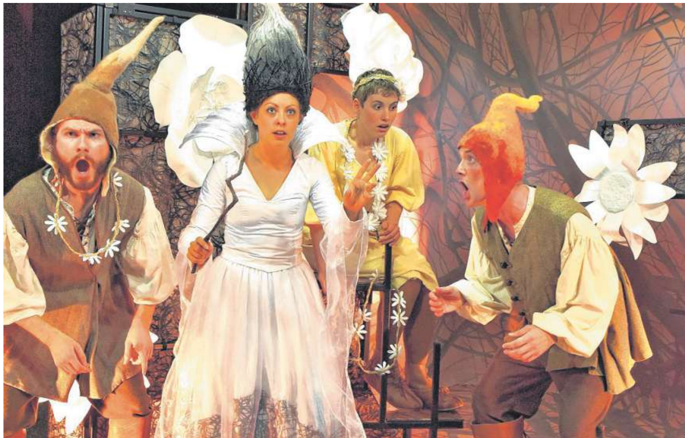
In dem phantasievollen Märchen „The Dark Lord and the White Witch“ kommen vor allem die jüngsten Englisch-Schüler auf ihre Kostüme.