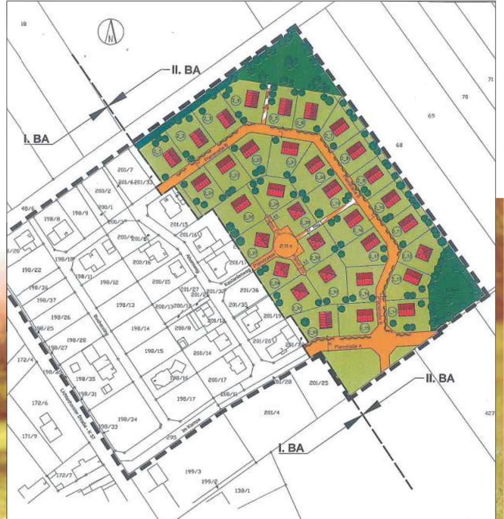
In dem grün hinterlegten Gebiet liegen die Bauplätze, die über die Lichtenhorster Straße erreichbar sind. GRAFIK: NLG

Hallenbad und vieles mehr. Das Nahverkehrsnetz der Landeshauptstadt Hannover ist schnell erreichbar (10 km Entfernung). Ferner besteht eine gute Anbindung an die A7 und B6.“ Frei sind noch Bauflächen in den Größen von 541 Quadratmetern (27050 Euro) bis 819 Quadratmetern (48321 Euro). Interessenten können sich bei der NLG (04231) 921230 oder über die Homepage www.nlg.de sowie bei der Gemeinde Steimbke (05026) 98080 und über die Internetadresse www.steimcke.de melden. DH