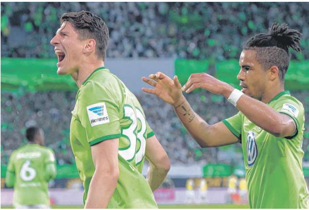
Mario Gomez (links) schreit seine Freude nach dem 1:1-Ausgleichstor gegen Mönchengladbach heraus. Dennoch muss er mit seinem Team weiter um den Klassenerhalt zittern.