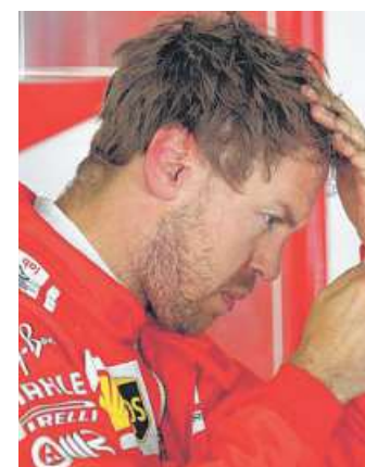
Sebastian Vettel

So kommt es am Sonntag gleich am Start zum aufregenden Duell zwischen dem Vierfach-Champion Vettel und dem Dreifach-Weltmeister Hamilton. Die Pole Position und der Start sind in Barcelona besonders wichtig, da auf dem 4,655 Kilometer langen Kurs nur schwer überholt werden kann.