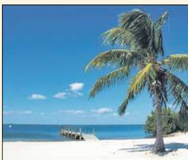
Frischen Sie Ihre Urlaubskasse auf.

Seit über 5 Jahren in Nienburg Ihre erste Adresse für Goldankauf in Nienburg