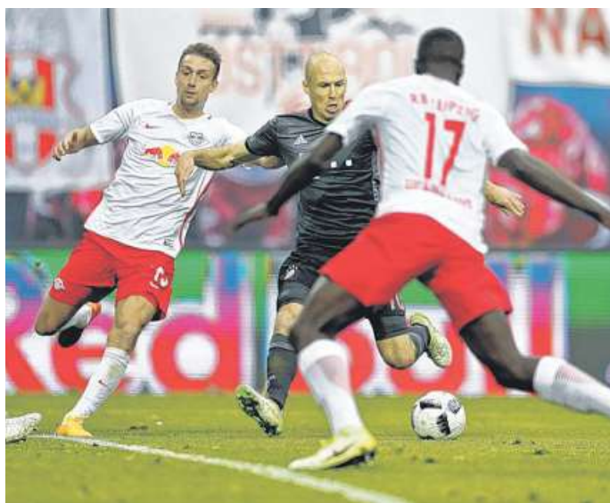
Die Entscheidung: Arjen Robben (Mitte) trifft zum 5:4 gegen Marcel Halstenberg (links) und Dayot Upamecano.

Eine Woche nach dem vorzeitigen Einzug in die Champions League schienen die gut erhaltenen Leipziger Bayern-Präsident Hoeneß mit Vehemenz widerlegen zu wollen. Dieser hatte vor dem Duell des Meisters beim Tabellenzweiten geraten, RB müsse das Konzept mit den jungen Spielern aufgeben, um in der kommenden Saison in der europäischen Meisterklasse zu bestehen. Die Retourkutsche der Leipziger: Vier Gegentore für die Bayern - die meisten in dieser Bundesliga-Saison für das Team von Carlo Ancelotti.