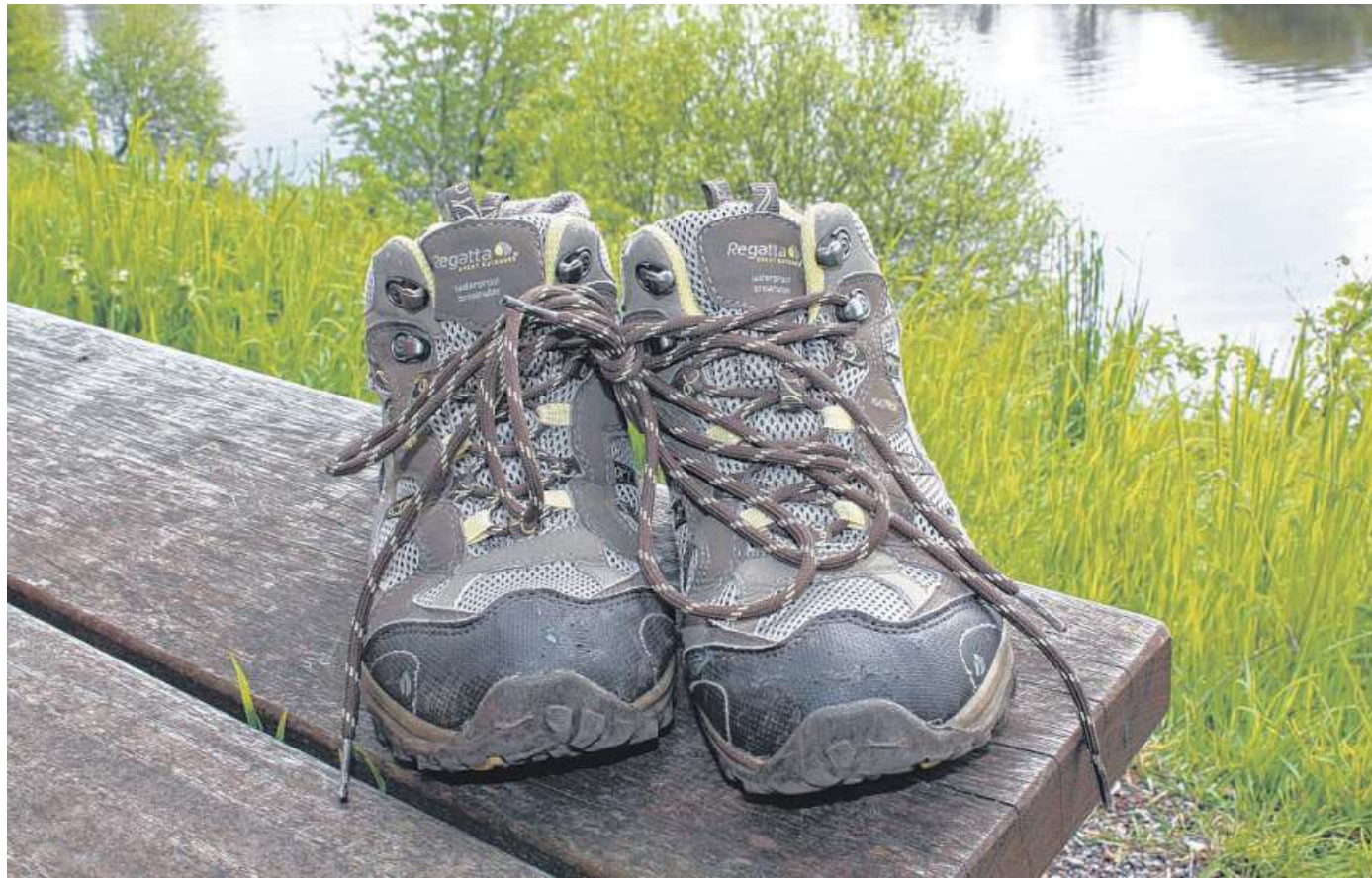
Die Mittelweser-Region wartet mit allerlei attraktiven Wandertouren auf.

• Die schönsten Punkte des Flecken Langwedel zeigt die Wandertour „Langwedel – Zwischen Schloss und Burg“. Bestehend aus zwei Routen, der nördlichen und der südlichen Route mit jeweils acht Kilometern Länge führt die Tour durch die abwechslungsreiche Natur und Sehenswürdigkeiten der Gemeinde. Dabei geht es auch über die älteste Straße Langwedels mit uraltm Eichenbestand, entlang am Schloss Etelsen mit Schlosspark und Mausoleum, vorbei an historischen Mühlen und Kirchen, durch unberührte Natur im Landschaftsschutzgebiet sowie zur Freilichtbühne im Da-