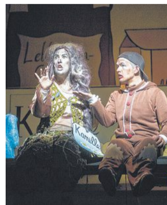
Das Nienburger Theater zeigt in vier Vorstellungen das Familien-Musical „Der Lebkuchenmann“.

Zum Inhalt: Auf dem Küchenschrank ist der Teufel