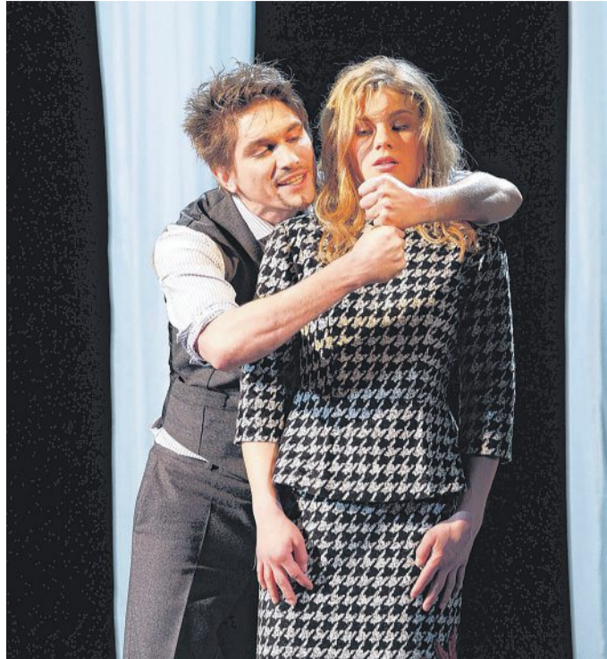
Das Theater für Niedersachsen ist mit zwei Vorstellungen von „Effi Briest“ am 11. und 12. Dezember im Nienburger Theater zu Gast. Für die Vorstellung am Sonntagnachmittag können die Leserinnen und Leser der Harke am Sonntag ein Cliquenticket gewinnen.

Ausgehend von einem realen Fall, der im preußischen Berlin für einen Skandal sorgte, beschreibt Theodor Fontane in dem 1895 entstandenen