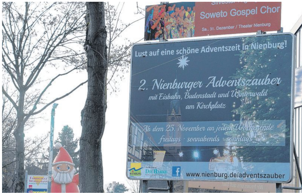
Seit Mitte der Woche lädt Nienburg auch auf diesem Wege zum Adventszauber ein.