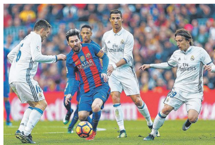
Im Duell der Superstars Lionel Messi gegen Cristiano Ronaldo (Mitte) gab es beim 1:1-Remis keinen Sieger.

Real war verletzungsge-schwächt in das Duell der spanischen Titanen gegangen. Dem Rekordmeister von Trainer Zinedine Zidane fehlte neben Kroos auch Flügelstürmer Gareth Bale, der sich beim Champions-League-Spiel gegen Sporting Lissabon am Knöchel verletzt hatte und mindestens zwei Monate pausieren muss. Kroos hatte dagegen am Freitag überraschend früh erstmals wieder an einem Training teilgenommen.