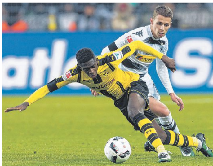
BVB-Stürmer Ousmane Dembele (links) lieferte eine Topleistung beim 4:1-Galassieg gegen Gladbach ab.

Ousmane Dembélé (64.) und dem dreifachen Torvorbereiter Marco Reus untermauerten die Dortmunder ihren Anspruch auf einen Champions-League-Platz. Dass auch Abwehrspieler Lukasz Piszczek (15.) vor 81 360 Zuschauern im ausverkauften Signal Iduna Park traf, rundete die Vorstellung des BVB ab. Das macht Mut für das Endspiel um den Gruppensieg in der Champions League am Mittwoch bei Real Madrid.