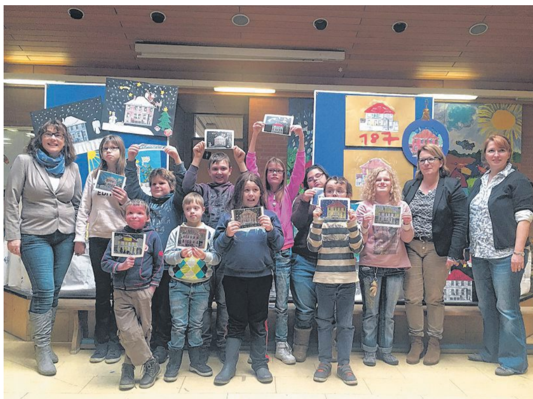
Die Jurorinnen und die Kinder mit den selbst gebastelten Weihnachtskarten.