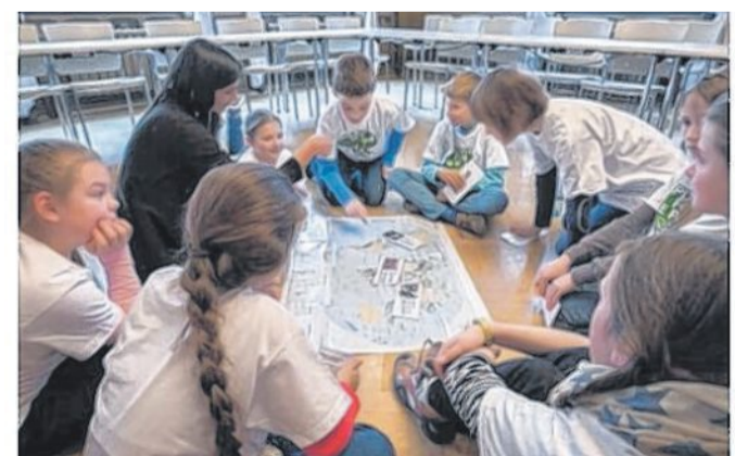
Am 12. November findet in der ASS die „Plant-for-the-Planet“-Akademie für Kinder und Jugendliche statt.

„Plant-for-the-Planet“-Akademie Kinder ab acht Jahren in Nienburg