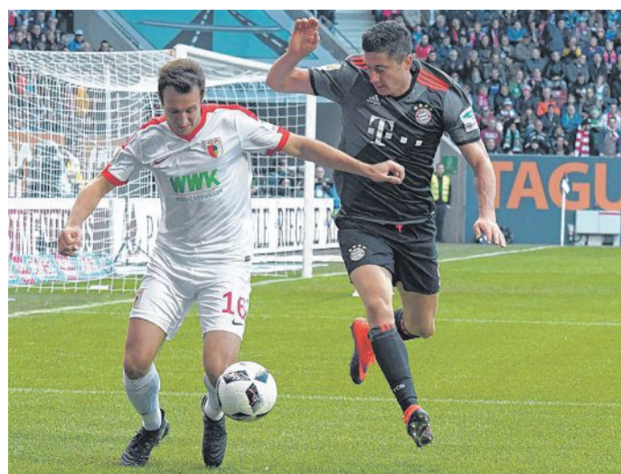
Kaum zu stoppen: Robert Lewandowski (rechts) traf doppelt beim 3:1-Auswärtssieg der Bayern in Augsburg.

Auf der anderen Seite rettete Hitz gegen Robben (62.) und bei zwei Kopfbällen von Mats Hummels (69./72.). Der Weltmeister war für Javi Martínez, der muskuläre Probleme hatte, in die Partie gekommen. „Wir wollen vorne wegmarschieren in der Tabelle“, sagte Hummels. Zwei Punkte beträgt der Vorsprung auf Verfolger RB Leipzig.