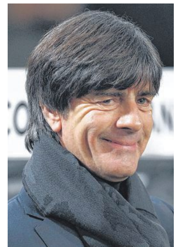
Bundestrainer Joachim Löw steht kurz vor einer Verlängerung bis 2020.

Eine frühzeitige Verlängerung kommt aber keinesfalls überraschend. Löws bisheriger Vertrag war bis 2018 datiert, die erfolgreiche Titelverteidigung in Russland ist das nächste große Ziel. Der 56-Jährige hatte zuletzt „das ein oder andere Gespräch mit dem Verband“ angekündigt. „Zu gegebener Zeit werden wir uns sicherlich mal zusammensetzen und nach vorne denken“, hatte Löw gesagt. DFB-Präsident Reinhard Grindel bekräftigte erst am Donnerstag den Willen zur Verlängerung: „Ich habe im-