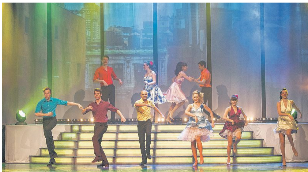
„Best of Musical Starnights“ - nach 2015 ist diese Musical-Show erneut im Nienburger Theater zu Gast.

Sängerinnen und Sänger aus Deutschland und England stehen gemeinsam mit den besten Tänzern des Londoner West End auf der Bühne und verwandeln den Abend in ein unvergessliches Erlebnis. Doch nicht nur stimmlich und akrobatisch verführt „Best of Musical Starnights“ in die Welt der 50-jährigen Musicalgeschichte, mehr als 250 farbenprächige Kostüme, eindrucksvolle Videoprojektionen und schließlich eine informative und unterhaltsame Moderati-