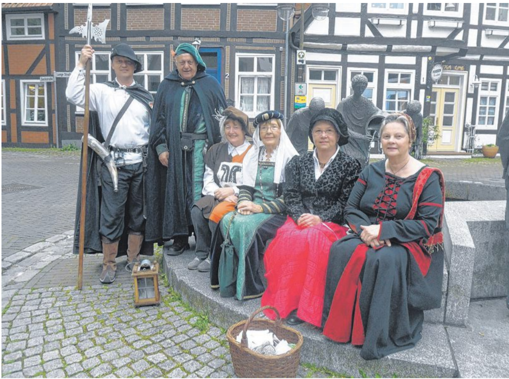
Nienburg entdecken mit den Stadtführerinnen und Stadtführern.