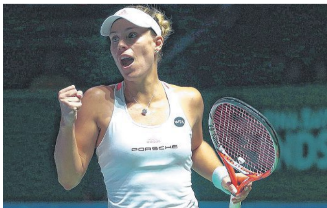
Angelique Kerber macht mit ihrer Gegnerin Agnieszka Radwanska kurzen Prozess.

„Ich bin schon relativ froh, dass es zu Ende geht und ich alles Revue passieren lassen kann“, sagte Kerber. „Es reicht dann auch für dieses Jahr.“ Noch hat sie den Urlaubsstrand aber nicht vor Augen.