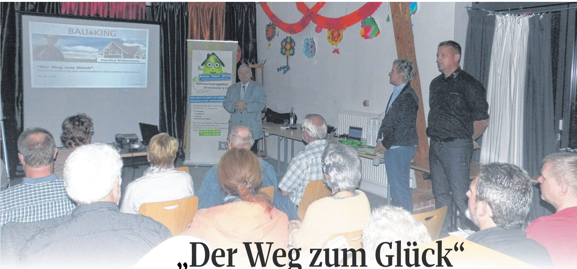
Der Vortrag „Der Weg zum Glück - Gebäudesanierung aus verschiedenen Blickwinkeln betrachtet“ war sehr gut besucht.

INFORMATIONEN AUS DER SAMTGEMEINDE LIEBENAU MIT DEN GEMEINDEN BINNEN UND PENNIGSEHL UND DEM FLECKEN LIEBENAU