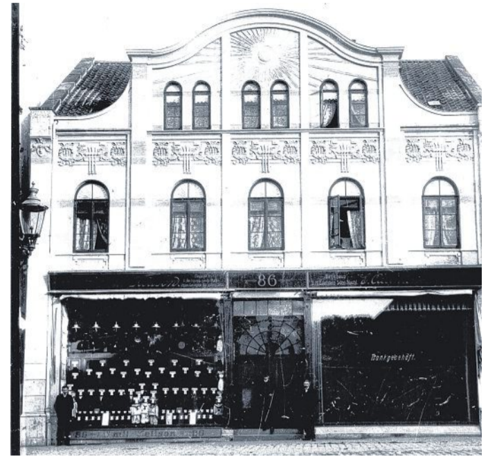
Eine Aufnahme des Gebäudes Lange Straße 86 (um 1925) als Wohnhaus und Bankgeschäft.