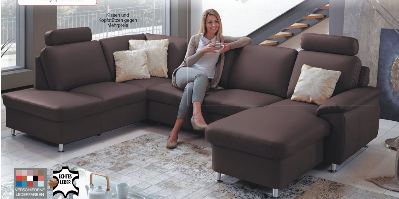
Kissen und Kopfstützen gegen Mehrpreis

Diese Wohnlandschaft sieht nicht nur klasse aus, sondern bietet zudem Platz für die ganze Familie und besticht durch hervorragenden Sitzkomfort dank Kaltschaumpolsterung. Der Echtlederbezug in braun und die Chromfüße unterstreichen das tolle Design. Viele Komfortfunktionen lassen sich gegen Mehrpreis ergänzen. Art. Nr. 0685 0131