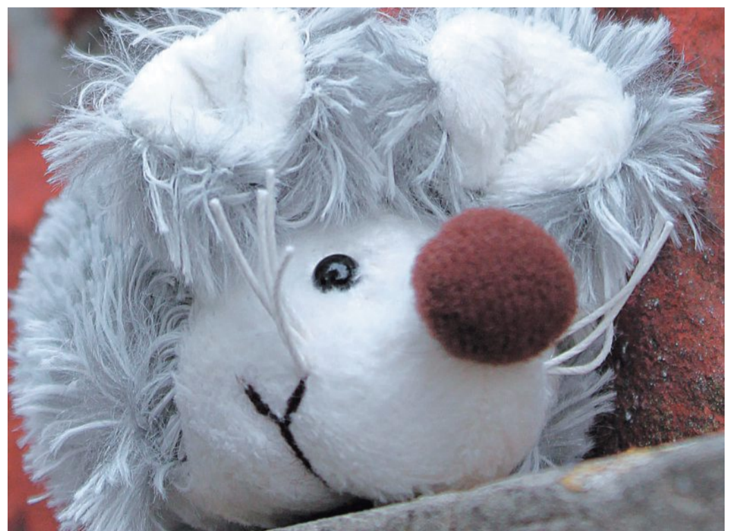
Am 9. Oktober können Kinder anlässlich des Mühlentages der Samtgemeinde Bruchhausen-Vilsen auf „Mäusejagd“ gehen.

➔ Noltesche Mühle (Mühlenweg, Süstedt): 1997 ging die Mühle samt Mühlenteich in das Eigentum der Gemeinde Süstedt über und wurde von da an bis 1999 gründlich restauriert. Seit 1998 treibt die