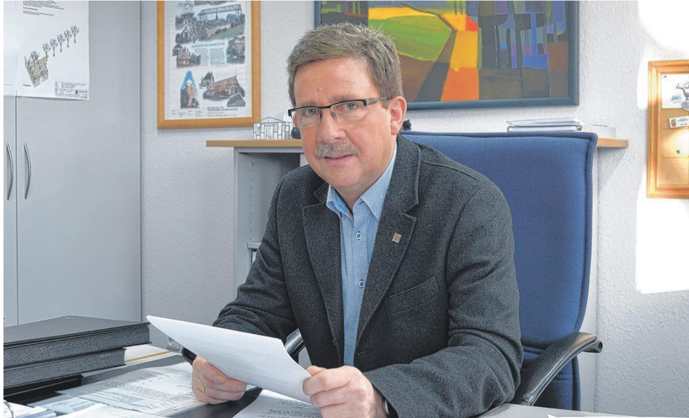
In diesen Tagen erhalten die Eltern der noch verbliebenen Klassen 7 bis 10 Post von Samtgemeindebürgermeister Fietze Koop. Wie es mit der Heemser Schule weitergeht, hängt auch von den Schülerzahlen ab. Inoffiziell geht man in Heemsen davon aus, dass die Oberschule im Sommer 2018 ausläuft.