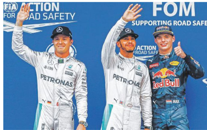
Gewohntes Bild: Lewis Hamilton (Mitte) war gestern Schnellster vor Nico Rosberg (links) und Max Verstappen.

Hamiltons Überlegenheit muss dem Deutschen für das 16. von 21 Saisonrennen heute jedoch zu denken geben.