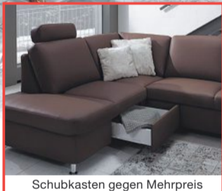
Schubkasten gegen Mehrpreis

** bisher geforderter Preis 2981,-** 1499,- Aktions-Preis