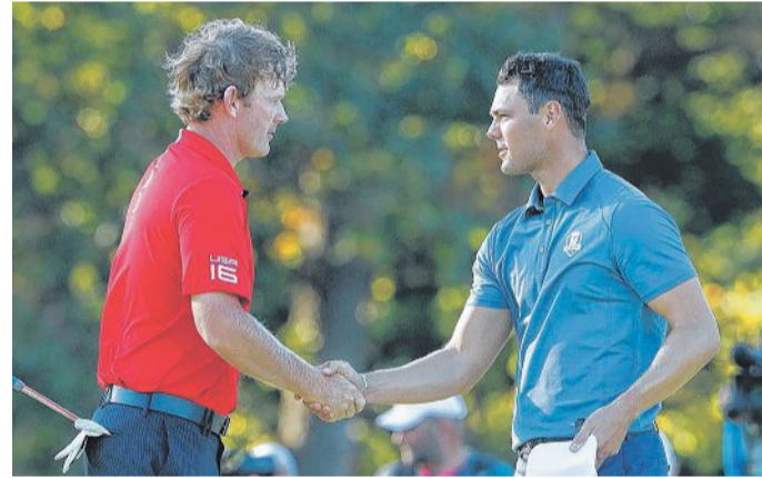
Nach seinem bisherigem enttäuschenden Auftritt beim Ryder Cup schaut Martin Kaymer (rechts) vorerst nur noch zu.

Den ersten Punkt für die Europäer holten Olympiasieger Justin Rose und Rio-Silbermedaillengewinner Henrik Stenson. Sie siegten gegen Jordan Spieth und Patrick Reed. Auch Sergio Garcia und Rafa Cabrera Bello gewannen ihre Partien im Modus Fourball, bei dem jeder Profi seinen eigenen Ball