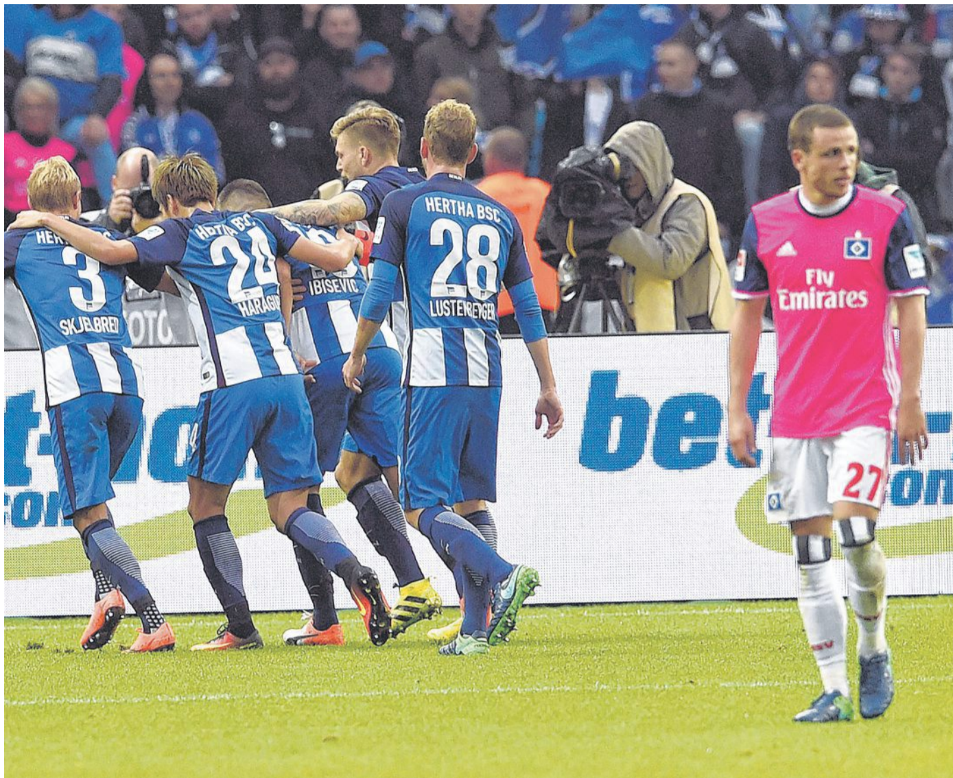
Während Hertha-Torschütze Vedad Ibisevic (verdeckt) mit seinen Mitspielern jubelnd abdreht, schaut der Hamburger Nicolai Müller (rechts) zu seiner Trainerbank.

Hertha nahm den Kampf an, wirkte entschlossener und fand über den Einsatz auch zu schönen Spielzügen - genau wie es Trainer Pal Dardai vorgegeben hatte. Der vom FC Augsburg gekommene Alexander Esswein, der nach dem Verletzungsausfall von Peter Pekarik erstmals von Beginn an spielte, bediente