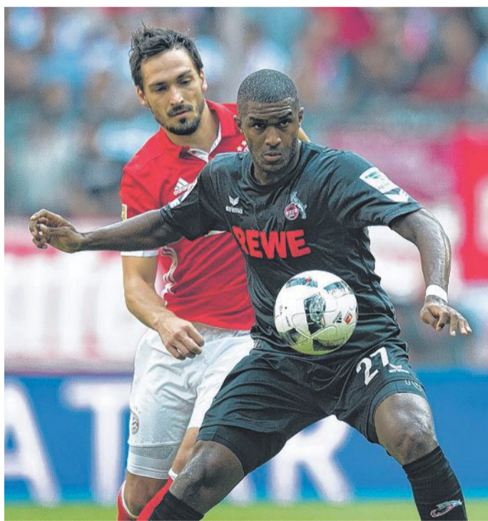
Kölns Torschütze Anthony Modeste und Münchens Mats Hummels kämpfen hier um den Ball.

Auf frisch verlegtem Rasen begann der Nachmittag gleich gegen die lange ultradefensiven Gäste. Die Kölner beschränkten sich erst