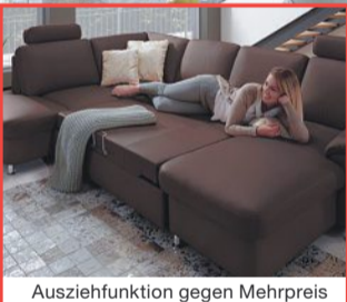
Ausziehfunktion gegen Mehrpreis