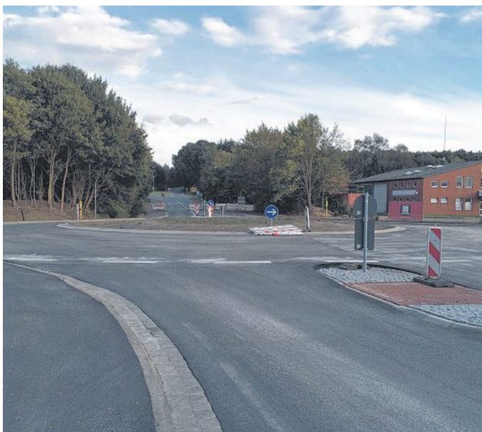
Der Kreiselneubau an der Hannoverschen Straße bei Langendamm endet voraussichtlich am kommenden Mittwoch. Ab Donnerstag soll der Verkehr wieder fließen.