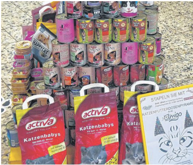
Ab Dienstag findet im „Futterhaus“ an der Ziegelkampstraße erneut eine „Futterpyramide“ zugunsten bedürftiger Katzen des Amigo-Vereins statt.

Aufgrund der sehr guten Resonanz der Futtersammelaktion im Futterhaus an der Ziegelkampstraße 30 hat der Amigo e.V. das Angebot erhalten, eine dritte Sonder-Aktion ab kommenden Dienstag, 4. Oktober, zu starten. Diese „Herbst-Pyramide“ soll, sollte sie genauso gut angenommen werden, wie die Dosen-Pyramide und die Junior-Pyramide jeweils im Januar beziehungsweise im Juni des Jahres, dann ist geplant, die Herbst-Aktion jeweils einem bestimmten Projekt der Streuerhilfe zu widmen. In diesem Jahr sollen auch hier die Spenden ausschließlich für die Tiere der Fichtestraße und Umgebung