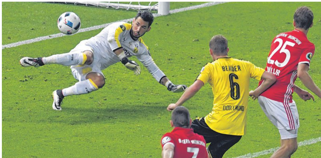
Dortmunds Torwart Roman Bürki (links) rettet hier in höchster Not gegen Bayerns Thomas Müller. BVB-Abwehrspieler Sven Bender schaut zu.

Auf große Chancen warteten die Zuschauer zunächst vergeblich. Ein Distanzschuss und ein Kopfball von Thomas Müller (4. und 22. Minute) - mehr ließ der BVB in der ersten halben Stunde nicht zu. Auch, weil Mats Hummels in