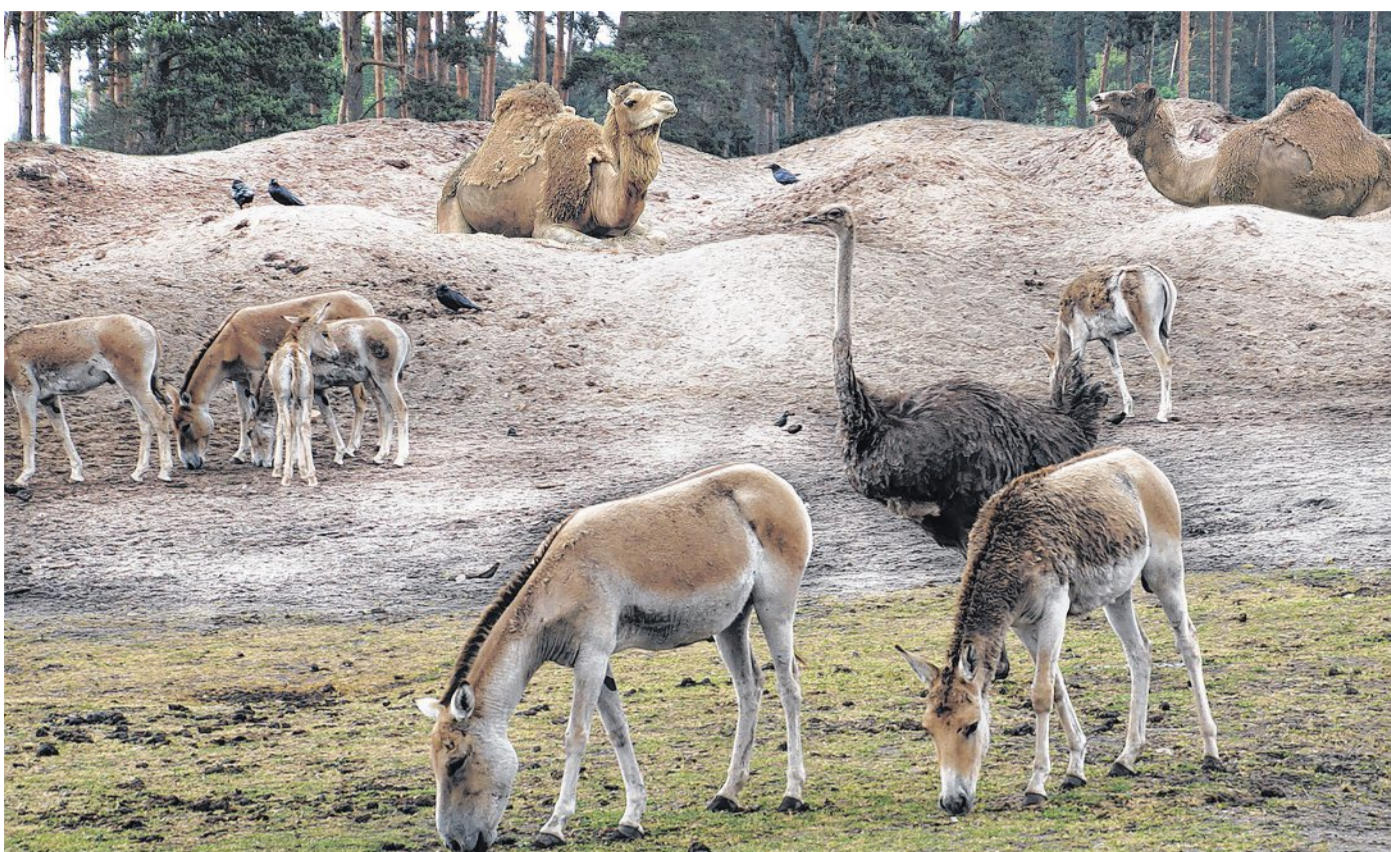
In der „Serengeti-Safari“, in der die Besucher 1500 wilde und exotische Tiere aus unterschiedlichen Ländern in einer naturnahen Umgebung hautnah erleben können, ist im Wild-Areal Nordafrika eine neue Wüstenanlage entstanden.

Die „Graetz Quad-Safari“ ist das neue Action-Highlight in der „Abenteuer-Safari“. In rasanten Quads geht es hoch hinaus und steil bergab über einen anspruchsvollen Parcours auf den Spuren des deutschen Indiana Jones, Paul Graetz. Wie auch Gra-