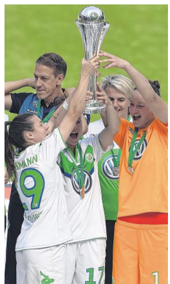
Die VfL-Spielerinnen mit dem DFB-Pokal.

pique Lyon. Fünf Tage vor dem Königsklassen-Endspiel in Italien präsentierte sich der VfL allerdings in keiner guten