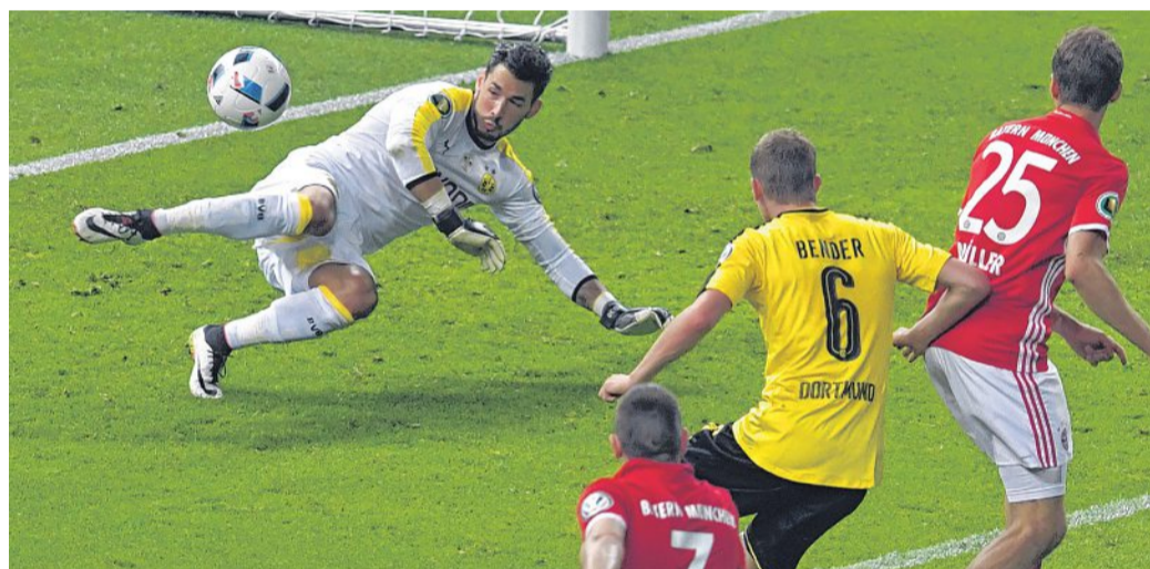
Dortmunds Torwart Roman Bürki (links) rettet hier in höchster Not gegen Bayerns Thomas Müller. BVB-Abwehrspieler Sven Bender schaut zu.

Auf große Chancen warteten die Zuschauer zunächst vergeblich. Ein Distanzschuss und ein Kopfball von Thomas Müller (4. und 22. Minute) - mehr ließ der BVB in der ersten halben Stunde nicht zu. Auch, weil Mats Hummels in