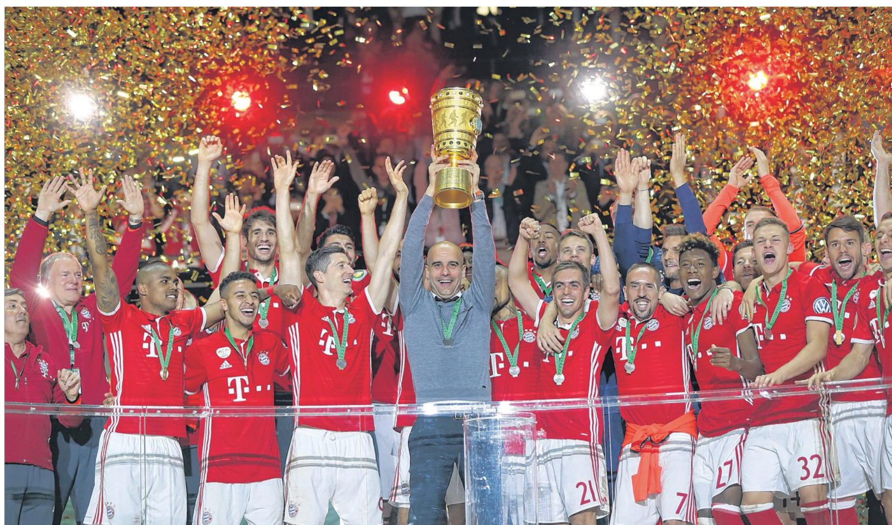
Da ist der Pott: Die Bayern-Spieler jubeln nach dem DFB-Pokalsieg mit ihrem Trainer Pep Guardiola.

BERLIN. Die Sportfreunde Lotte und der SV Waldhof Mannheim bestreiten die Topspiele um den Aufstieg in die 3. Fußball-Liga. Die Auslosung gestern ergab, dass der Südwest-Meister Mannheim am Mittwoch um 19 Uhr beim Sieger der Weststaffel antreten muss. Das Rückspiel ist für den 29. Mai, 13.30 Uhr, angesetzt. Um die beiden anderen Plätze in der 3. Liga kämpfen VfL Wolfsburg II und Jahn Regensburg sowie Elversberg und der FSV Zwickau. Zwickau hatte erst gestern die Meisterschaft in der Regionalliga Nordost perfekt gemacht.