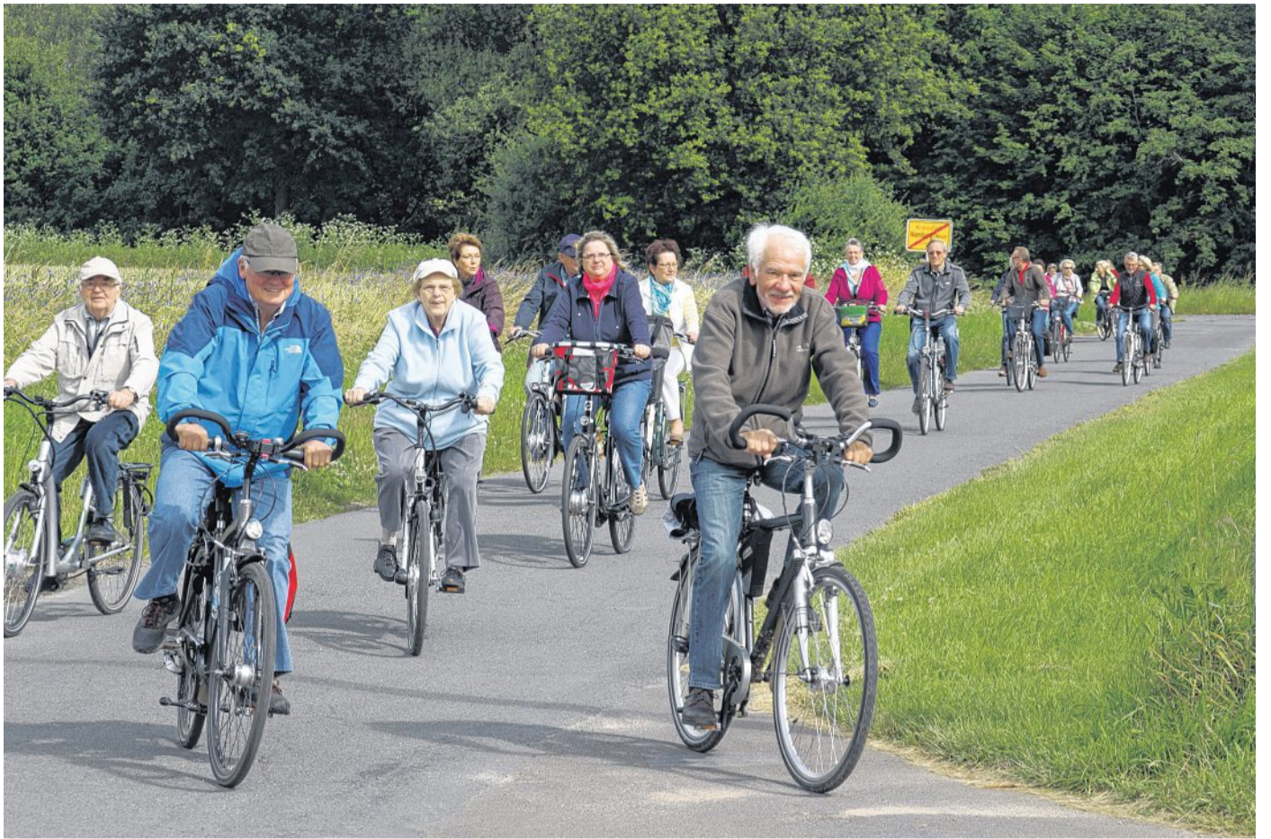
Entspannt Radfahren und quasi nebenbei Näheres über die Betriebe in der Umgebung erfahren: Das ist auch in diesem Jahr der Sinn der Veranstaltung, zu der der Gewerbeverein Heemsen am 19. Juni einlädt.

Karten für das Frühstück gibt ab sofort für zehn Euro