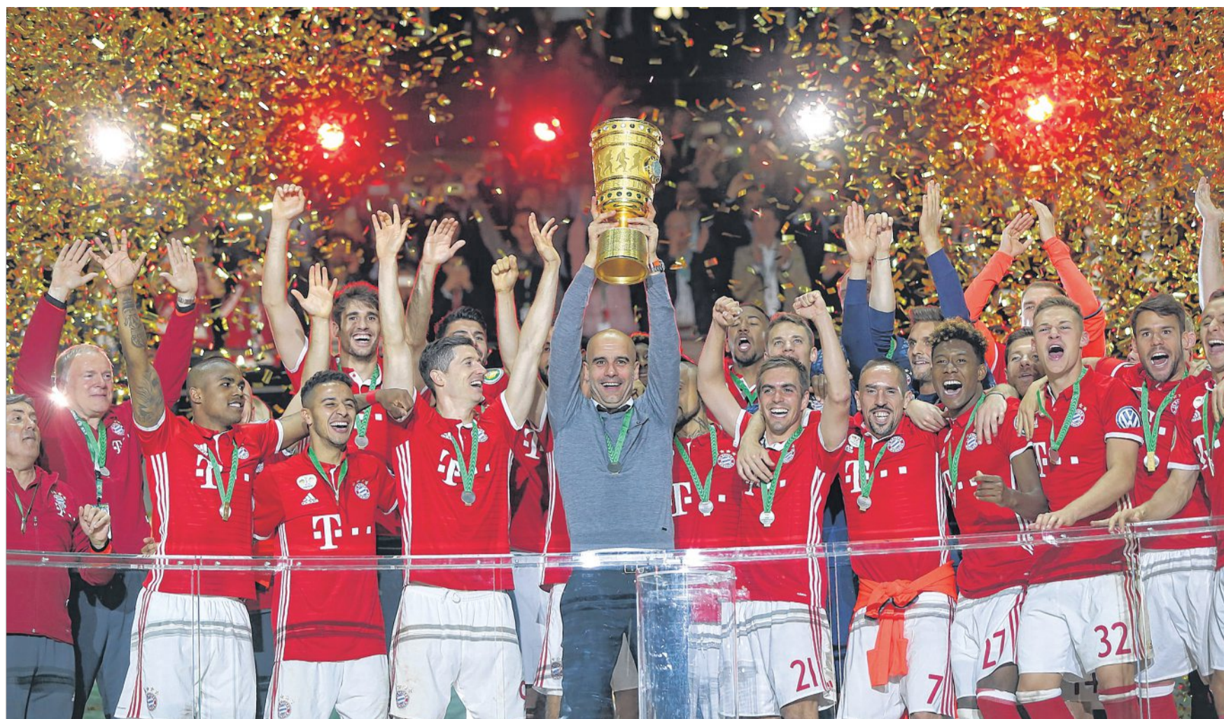
Da ist der Pott: Die Bayern-Spieler jubeln nach dem DFB-Pokalsieg mit ihrem Trainer Pep Guardiola.

BERLIN. Die Sportfreunde Lotte und der SV Waldhof Mannheim bestreiten die Topspiele um den Aufstieg in die 3. Fußball-Liga. Die Auslosung gestern ergab, dass der Südwest-Meister Mannheim am Mittwoch um 19 Uhr beim Sieger der Weststaffel antreten muss. Das Rückspiel ist für den 29. Mai, 13.30 Uhr, angesetzt. Um die beiden anderen Plätze in der 3. Liga kämpfen VfL Wolfsburg II und Jahn Regensburg sowie Elversberg und der FSV Zwickau. Zwickau hatte erst gestern die Meisterschaft in der Regionalliga Nordost perfekt gemacht.