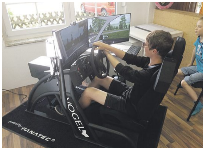
Fahrsimulator in der Fahrschule Schindler!

Die Fahrschule Schindler aus Rodewald freut sich über den Verkehr umgesetzt werden. Hier einige paar weitere Vorteile für den Fahrsimulator: Durch die drei großen Monitore hat man ein breites Blickfeld und kann auch den Querverkehr gut einsehen. Über die Spiegel im Sichtfeld erfährt man, was hinter und neben einem geschieht. Über eine Kamera wird die Blickführung festgehalten – so erkennt das System, ob der Schulterblick gemacht wurde! Lenkrad: Für ein realitätsnahes Fahrgedühl ist im Simulator ein spezielles Lenkrad mit Kraftrückkopplung Force-Feedback verbaut. Kupplung, Bremse und Gas – hier lernt man an einer echten PKW-Pedalerie, die sich wie im Straßenverkehr werden stetig wiederholt, bis zur Perfektion, und können dann im realen Verkehr umgesetzt werden.