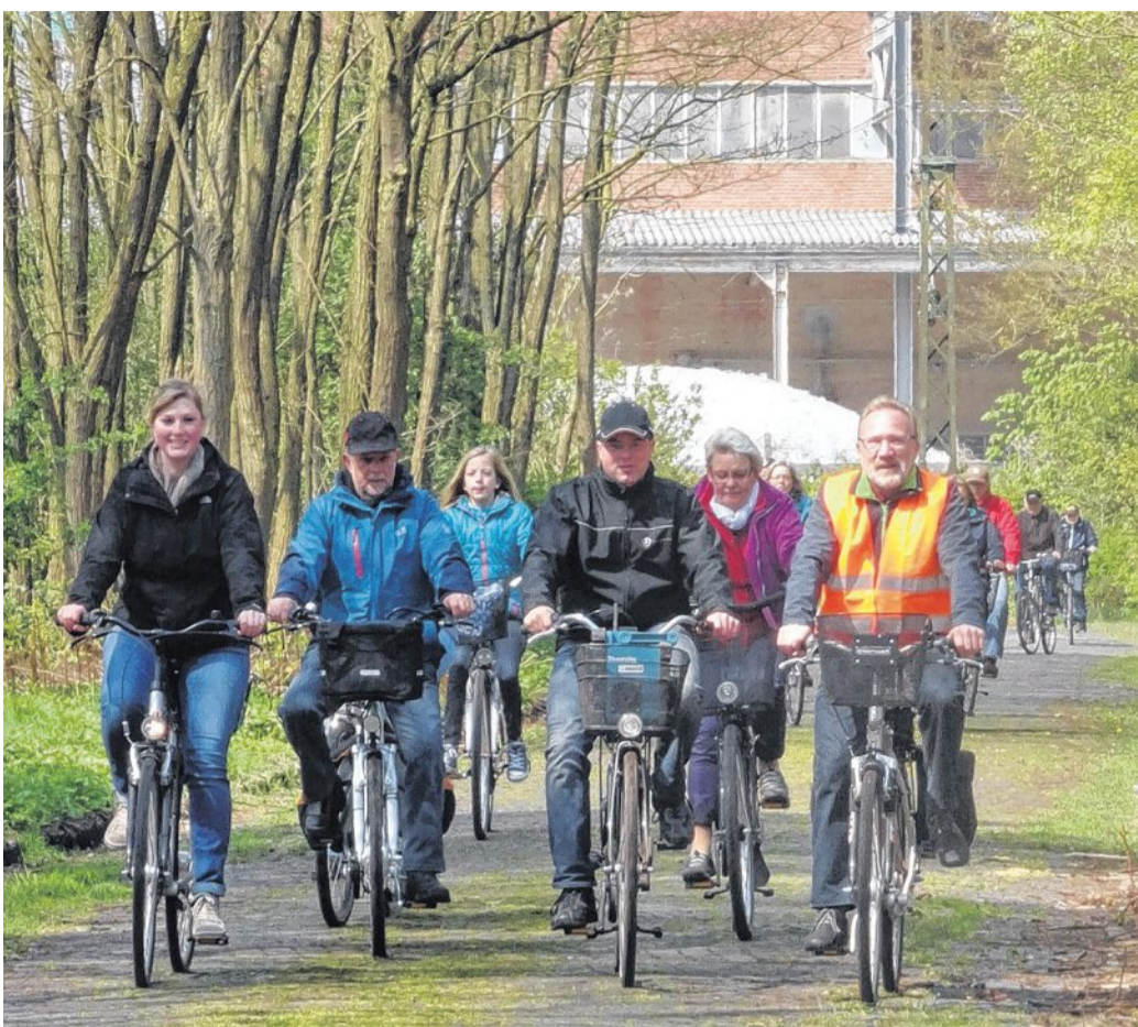
Die traditionelle Maitour der SSG Rohrsen führte dieses Mal zur Feuerwehrtechnischen Zentrale nach Holtorf.