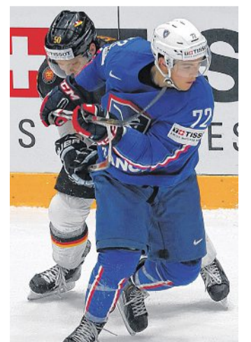
Die DEB-Auswahl verlor gegen Frankreich.

Im Schlussabschnitt fehlten dem deutschen Team richtig gefährliche Möglichkeiten gegen die Franzosen, die als eingespiltes Ensemble gelten. Auch die Verlängerung blieb torlos. Und am Ende besiegelte das Shootout die erste deutsche Auftakt-Pleite seit 2013.