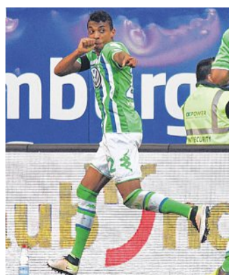
Luiz Gustavo erzielte das Tor zum 1:0-Sieg.