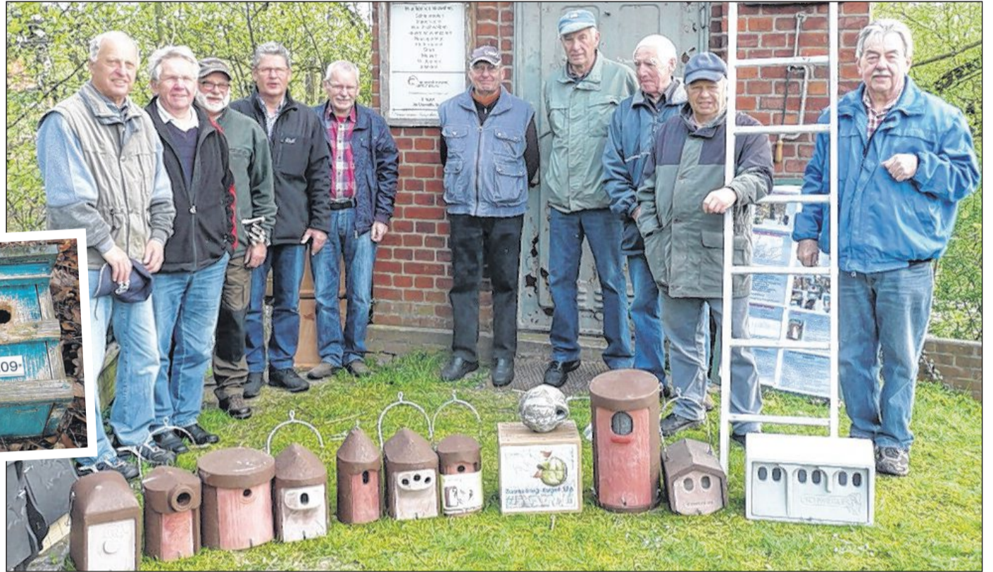
Die gut gelaunten Vogelfreunde mit den neuen Nisthöhlen.

Zwei Drittel der 340 vom Heimatverein Steyerberg betreuten Nisthöhlen konnten nicht zuletzt dank der Zuwendung der Bingo-Umweltstiftung erneuert werden.