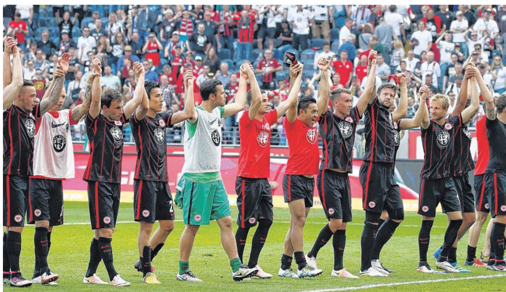
Unglaublich: Mit einer grandiosen Leistung siegte Eintracht Frankfurt im Heimspiel 1:0 gegen Borussia Dortmund und ließ sich nach Abpfiff von den Fans feiern.