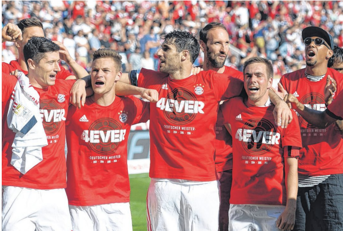
Deutscher Meister 2016: Der FC Bayern feiert nach dem 2:1-Erfolg in Ingolstadt den 26. Titelgewinn

Frankfurt. Borussia Dortmunds Geschäftsführer Hans-Joachim Watzke rechnet noch vor dem Bundesliga-Finale am nächsten Wochenende mit einer Entscheidung über einen möglichen Wechsel von Mats Hummels zu Bayern München. „Die Entscheidung liegt bei Mats, der Ball liegt bei Mats. Und er wird ihn in Kürze auch spielen, davon gehe ich aus“, sagte Watzke am Samstag vor dem Spiel des Tabellen-Zweiten bei Eintracht Frankfurt im TV-Sender Sky. „Ich rechne damit, dass es in der kommenden Woche eine Entscheidung gibt.“ Für die Bayern gehe es jetzt darum: „Will der Mats nach München oder nicht“, sagte Watzke. Von Differenzen in der Causa Hummels mit dem ehemaligen Bayern-Präsidenten und -Manager Uli Hoeneß könne indes keine Rede sein, versicherte Watzke.