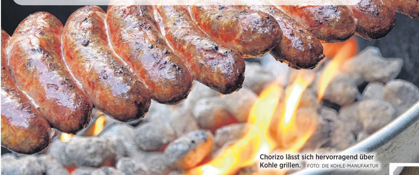
Chorizo lässt sich hervorragend über Kohle grillen.

Fünf zündende Tipps zum Grillen mit Kohle