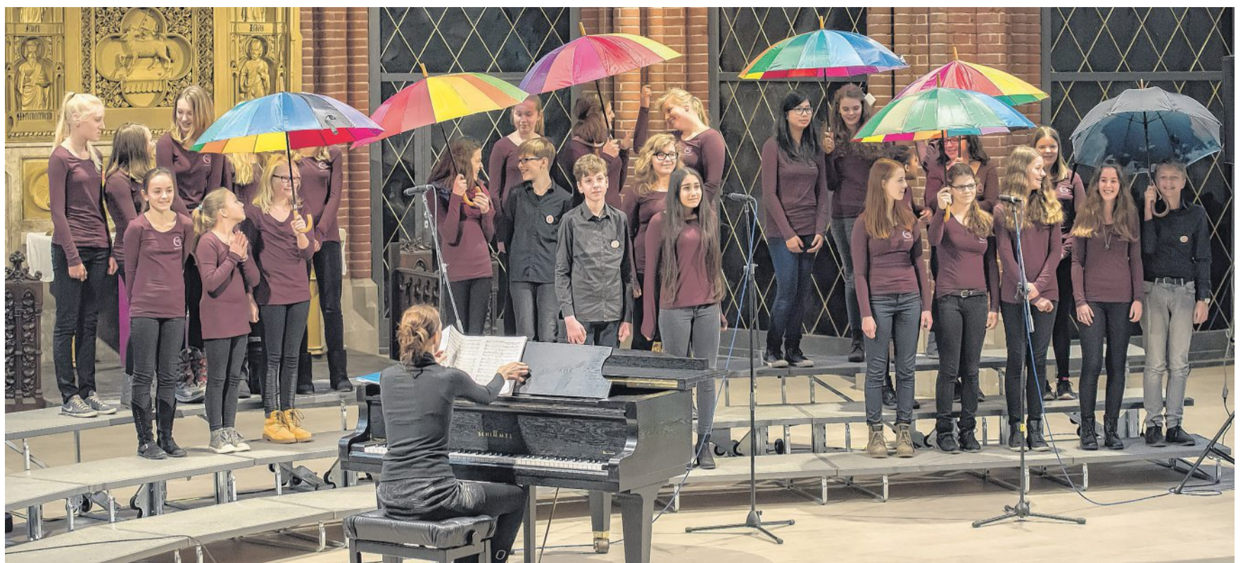
Die Chorklasse 7/8 des MDG präsentierte im November 2015 ein Chorstück mit Regenschirmen als Requisite in der Christuskirche in Hannover.

NIENBURG. Die Aktiven des Allgemeinen Deutschen Fahrrad-Clubs (ADFC) treffen sich am kommenden Freitag, 13. Mai, um 19:30 Uhr in Drakenburg im „Efes am Weserwehr“. Abfahrt mit dem Rad ist um 19 Uhr am Spargelbrunnen. Gesprochen wird über die Initiative des ADFC Niedersachsen zur vermehrten Einrichtung von Tempo-30-Zonen, die Critical-Mass-Aktion in Nienburg und über die Fahrradtouren zur Vorstellung der Wolfsrouten am 29. Mai. DH