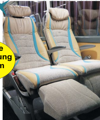
Super-Pullmann Sessel - 1 Meter Sitzabstand Beinauflagen - z.T. verstellbare Kopfstützen

inklusive Taxiabholung bis 50 km Umkreis von Hannover