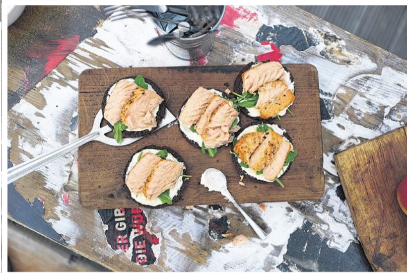
Für das Grillen eignen sich insbesondere fettreiche Fische wie beispielsweise Lachs.

Fleisch einstechen: Lebensmittel wendet man am besten mit einer Grillzange. Durch eine Gabel wird die Fleischstruktur zerstört und der Fleischsaft tritt aus. Dadurch geht auch ein Großteil des Geschmacks verloren. Darüber hinaus tritt das Fett aus den Speisen aus, wodurch zum einen das Fleisch austrocknet und zum anderen beim Hinuntertropfen auf die Kohle Rauch entsteht.