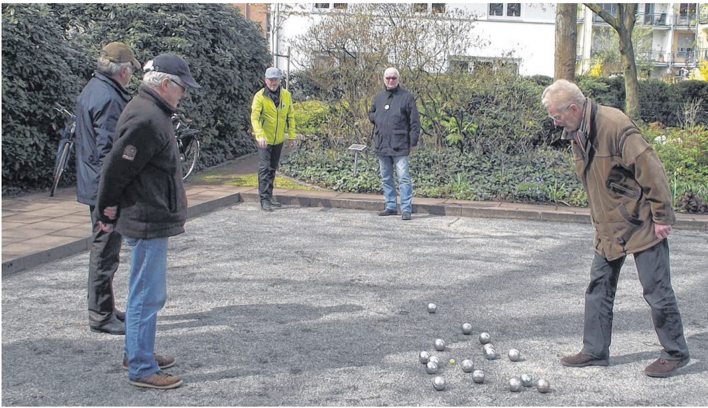
Am Sonnabend, dem 21. Mai, wird am Aue-Wall zwischen Museum und Neumarkt der 10. Geburtstag der Boule-Anlage gefeiert.