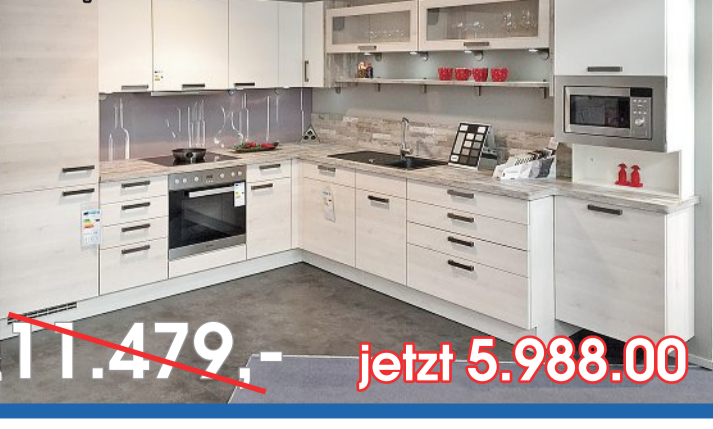
Winkelküche mit Miele-Elektrogeräten inkl. Spüle & Zubehör