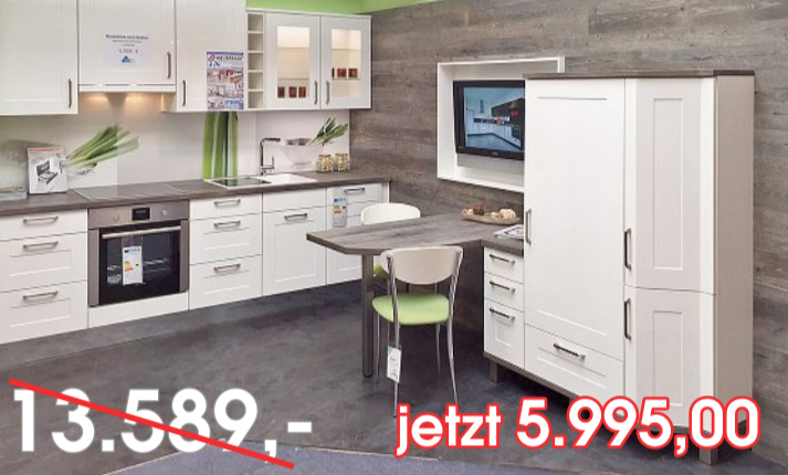
Einbauküche mit Bauknecht-Geräten