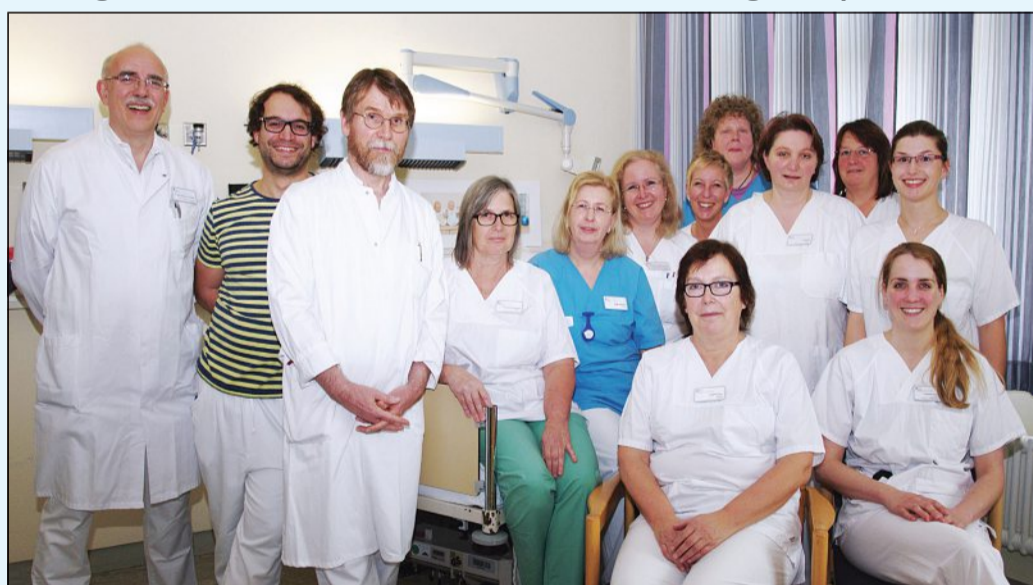
Kompetentes Team: Hebammen sowie Ärzte aus Gynäkologie und Kinderheilkunde kümmern sich um die Entbindung. Mit dabei sind auch immer die Hebammen-Schülerinnen.

Tag der offenen Geburtsklinik am Samstag, 9. April 2016