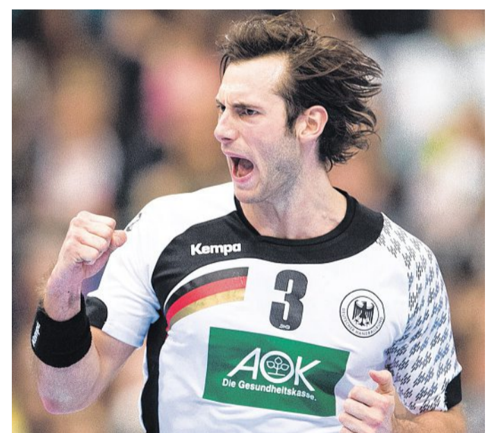
Deutschlands Weltklasse-Außenspieler Uwe Gensheimer war mit acht Treffern der beste Werfer.

Nach der ärgerlichen Schlappe gegen den Asienmeister Katar war die deutsche Mannschaft sichtlich bemüht, gegen den nächsten Hochkaräter einen weiteren Fehltritt zu vermeiden. Von Beginn präsentierte sich der Gastgeber mit der Leidenschaft, die das Team zum EM-Titel gebracht hatte, aber zuletzt vermissen ließ. „Wir werden jetzt nicht jedes Spiel gewinnen. Wir können gegen Dänemark auch mit fünf oder sechs Toren verlieren, wenn wir