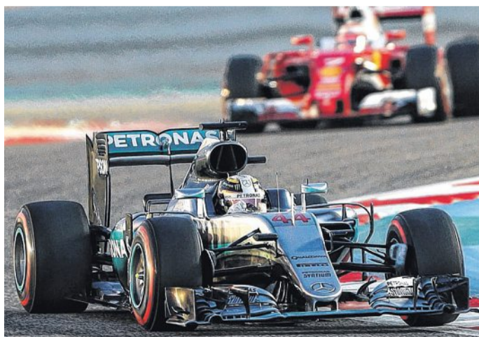
Lewis Hamilton feierte beim Qualifying zum Grand Prix in Bahrain die Pole Position.

Er siegte in den Jahren 2014 und 2015 unter dem Flutlicht in der Wüste von Sakhir. Gelingt es ihm auch in diesem Jahr, schafft er als erster den Hatrick in Bahrain. Nach Problemen im Training, das am Freitag Rosberg, am Samstag Vettel auf Rang eins abgeschlossen hatte, stellte der Brite Hamilton nach seiner 51. Pole erfreut fest: „Die letzte Runde war die beste, die erste gute dieses Wochenende eigentlich.“