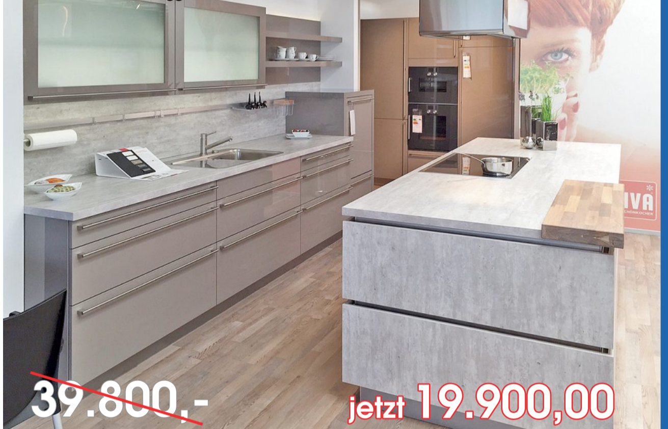
Einbauküche mit Gaggenau-Edel-Geräten