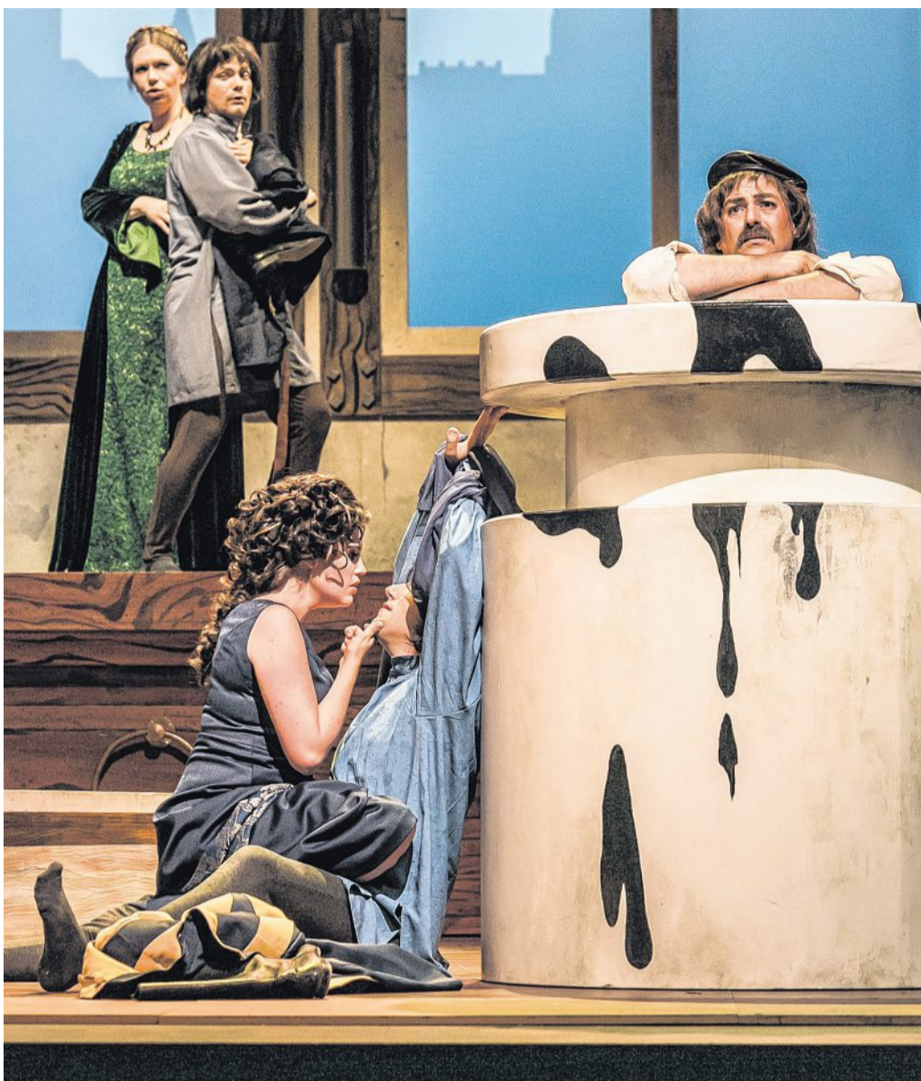
Das TfN zeigt am 6. April in einer Nachmittagsvorstellung die Operette „Boccaccio“.

Karten sind noch erhältlich an der Theaterkasse im Stadtkontor, Kirchplatz 4, Telefon