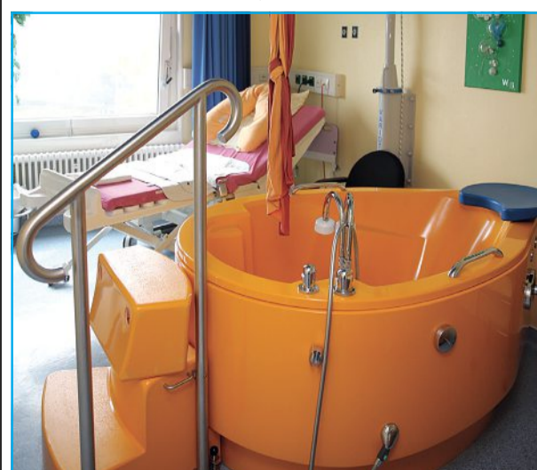
Die Wassergeburt ist eine Variante, im Klinikum Neustadt sein Kind auf die Welt zu bringen.