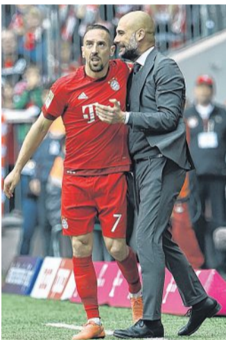
Franck Ribery jubelt mit Trainer Pep Guardiola.

Während der Tabellenvorletzte von Trainer Niko Kovac, der von 2001 bis 2003 in München aktiv war, weiter allergrößte Abstiegsorgen hat, setzte der Spitzenreiter vor 75 000 Zuschauern seine starke Bilanz fort. Die vergangenen 14 Partien nach einer Länderspielpause konnte der Rekordmeister alle gewinnen, in 18 von 19 Pflichtspielen in dieser Saison zu Hause gab es Siege.