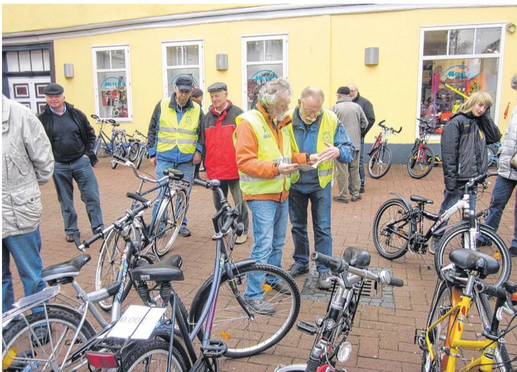
Fahrradflohmarkt am Posthof. Informiert wird auch über GPS- beziehungsweise Fahrradnavigationssysteme, hier liegt eine Interessenliste aus, und über die Fahrradcodierung des ADFC. ADFC

Vorgestellt wird für das Fahrradtourenprogramm 2016. Interessant für viele Radfahrer auf Tour dürfte das neue Angebot des ADFC zum Pannenschutz sein. Radlern mit einer Panne auf dem Weserradweg, an der Aller oder auf einer Alltagsroute