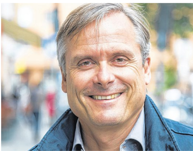
Am 8. Juni in Nienburg: der Kolumnist Axel Hacke.

Seit 25 Jahren schreibt Axel Hacke für das Magazin der Süddeutschen Zeitung, vom berühmten „Kleinen Erziehungsberater“ über „Das Beste aus meinem Leben“ zu „Das Beste aus aller Welt“. Tausend Texte sind so entstanden. Geschichten, die sich in den Köpfen und Herzen von inzwischen nicht nur einer Generation ausgebreitet haben. Axel Hacke ist mit ihnen zum beliebtesten deutschen