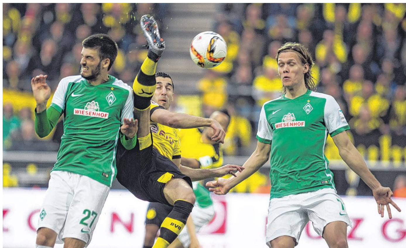
Spektakulär setzt sich der Dortmunder Henrikh Mchitarjan (Mitte) gegen Florian Grillitsch und Jannik Vestergaard durch. (von links)