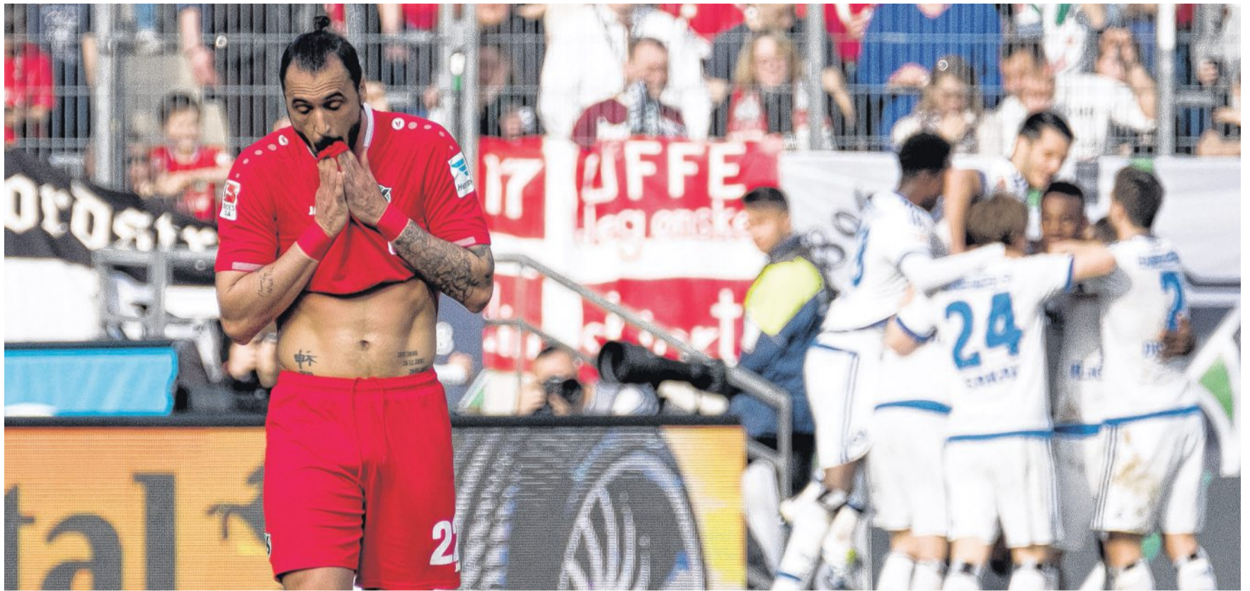
Während Hannover Stürmer Hugo Almeida es nicht fassen kann, jubeln im Hintergrund die Spieler des Hamburger SV.