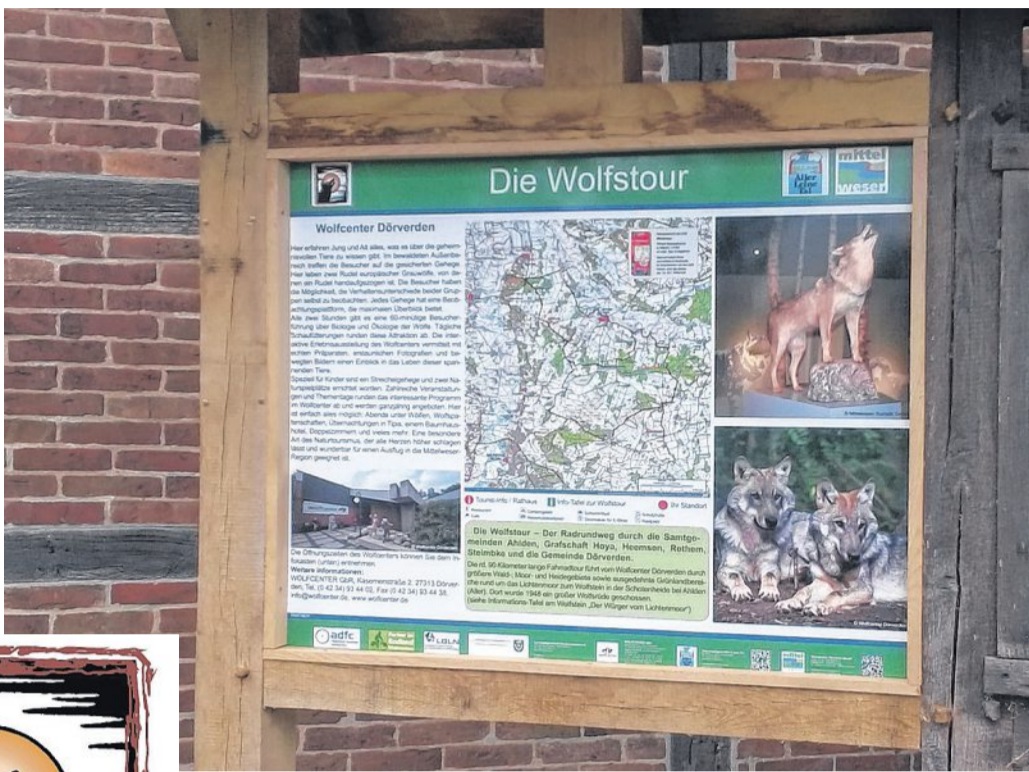
In Rethem wird am 17. April die neue Wolfsroute eröffnet.