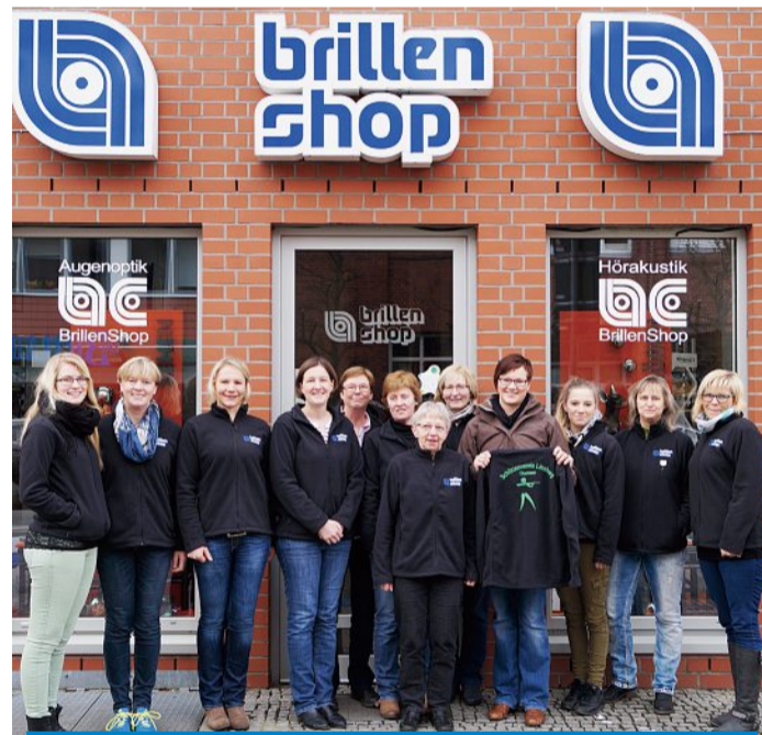
Brillen Shop sponsert Jacken für die Schützendamen aus Linsburg