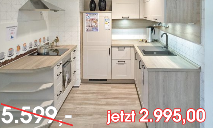
Einbauküche mit Bauknecht-Geräten