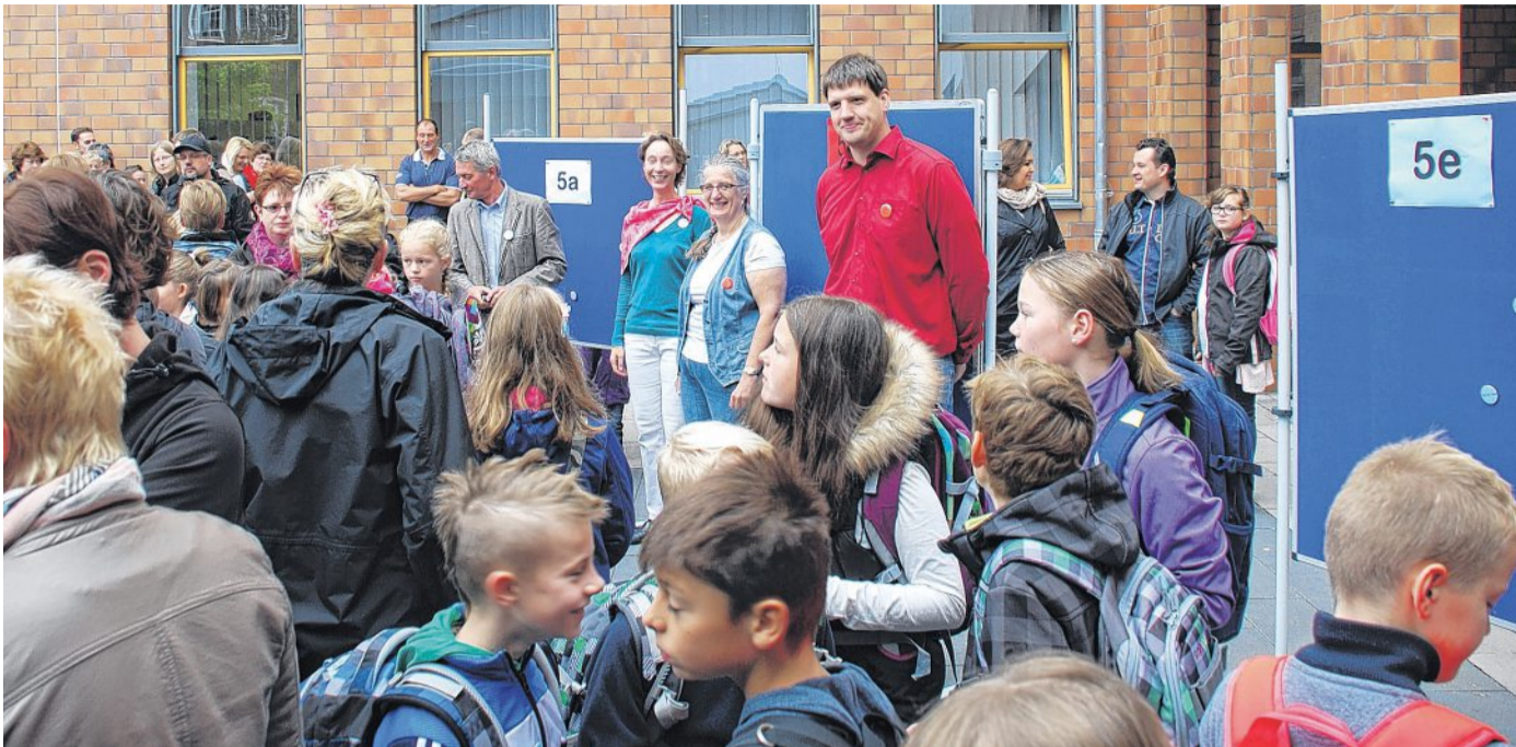
Am kommenden Donnerstag lädt das MDG Eltern der Jahrgangsstufe 4 zu einem Infoabend ein.

Musik, MINT, zweite Fremdsprache und Ganztagsbetrieb sind u.a. die Themen