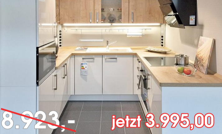
Einbauküche mit Bosch-Geräten