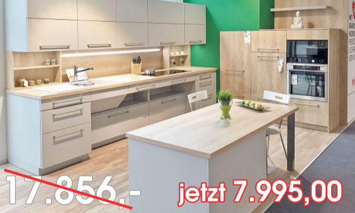
Einbauküche mit AEG-Geräten