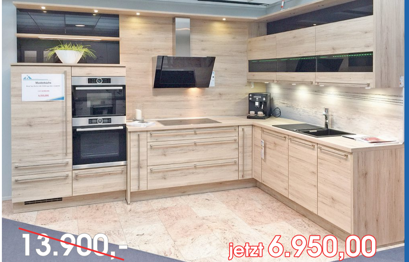
Einbauküche mit Bosch-Geräten u.v.m.