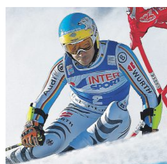
Felix Neureuther fuhr stark im Riesenslalom.

Hinter Neureuther sorgte Stefan Luitz mit Platz sieben für ein weiteres starkes Ergebnis. Einzig Fritz Dopfer blieb als 14. erneut unter seinem Niveau, steigerte sich aber zumindest im Vergleich zu den beiden ersten Riesenslalom-Rennen der Saison. „Ich hätte mir mehr erhofft“, meinte Dopfer. Auf Teamkollege Neureuther fehlten ihm am Ende mehr als eineinhalb Sekunden.