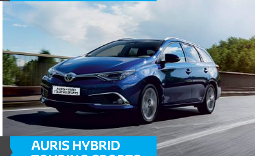
AURIS HYBRID TOURING SPORTS