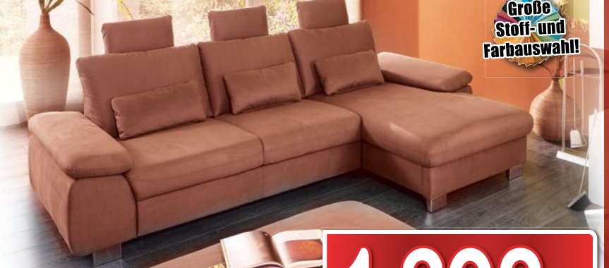
ECKKOMBINATION Stellfläche 290x184cm, Hocker extra. Weitere Funktionen gegen Mehrpreis.