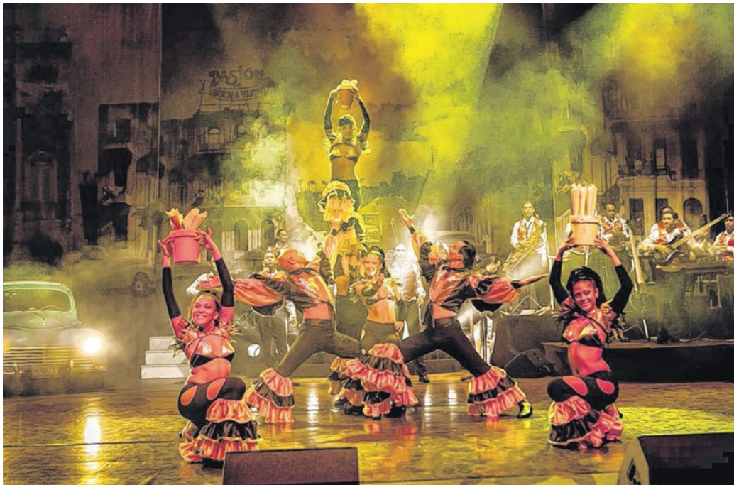
Am 5. Februar 2016 erneut in Nienburg zu Gast: die kubanische Musik- und Tanzshow „Pasión de Buena Vista“.

Ebenfalls zum zweiten Mal in Nienburg nach dem großen Erfolg in 2012 ist „Pasión de Buena Vista“ mit heißen kubanischen Rhythmen und mitreißenden Tänzen, und zwar am Freitag, 5. Februar 2016, um 20 Uhr. „Pasión de Buena Vista“ zeigt eine furiose, preisgekrönte Show mit mitreißenden Tänzen und traumhaften Melodien. Das 21-köpfige kubanische Ensemble mit Tänzern, Sängerinnen und Musikern in tollen Kostü-