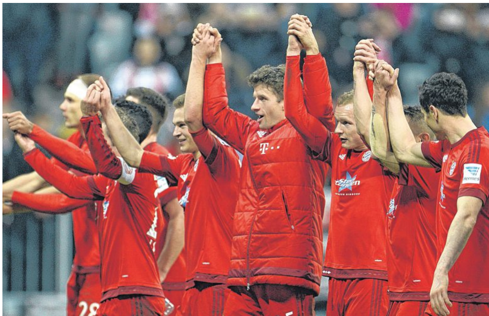
Gewohntes Bild: Bayern München feiert die Herbstmeisterschaft.

Der unterhaltsame und lange spannende Nachmittag ging vor 75.000 Zuschauern in der ausverkauften Allianz Arena trotz aller Warnungen von Pep Guardiola einigermaßen überraschend los. Die glänzend eingestellten Gäste mauerten nicht