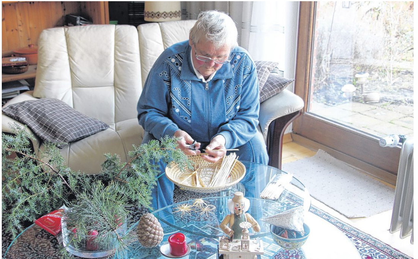
Sie vermisst ihre Eisbahn schon ein wenig, aber sie ist auch froh, dass sie die Adventszeit endlich genauso genießen kann, wie alle anderen. Mit Basteln, Handarbeiten oder Weihnachtsmarktbummel. Hagebölling

Wenn sie zuhause ist, bastelt sie neue Strohsterne. Die alten waren schon ganz ausgefranst. Oder sie handarbeitet. Tischdecken oder Decken zum Zudecken. „Letztes hab ich sogar meine Nähmaschine wieder her ausgeholt. Allerdings mit Bedie-