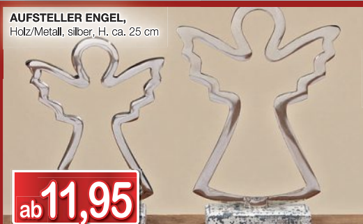
AUFSTELLER ENGEL , Holz/Metall, silber, H. ca. 25 cm