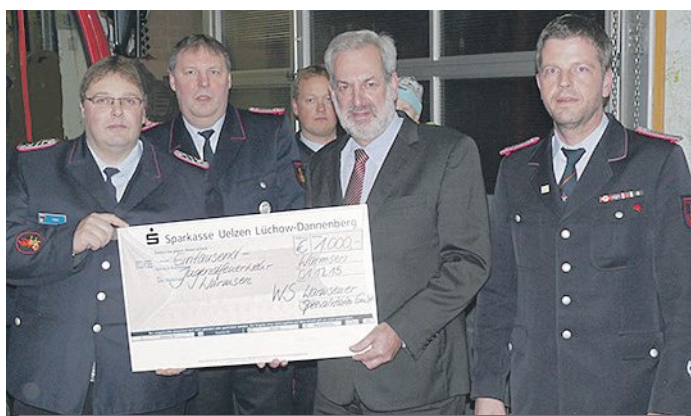
WS Warmseener Spezialitäten GmbH übergibt Spende an die Jugendfeuerwehr in Warmesen

ken oder wieder herzustellen um eine hohe Lebensqualität zu erreichen. Ein positives Lebensgefühl zu vermitteln und Selbstheilungskräfte zu mobilisieren ist ebenfalls Teil unseres Konzeptes. Bei bereits bestehenden gesundheitlichen Problemen kann mithilfe der Naturheilkunde regulierend eingegriffen werden. „Ich verbinde in meinem Institut die Behandlungsmöglichkeiten als Kosmetikerin und Heilpraktikerin auf ideale Weise. Bei fast jeder Hauterkrankung und vielen Erschöpfungszuständen ist ein ganzheitliches Konzept nötig, um nachhaltig positive Veränderungen herbeizuführen. Wir bieten neben den klassischen Kosmetik- & Wellnessbehandlungen auch medizinische und naturheilkundliche Behandlungen an, z. B. Lymphdrainage, Fußreflexzonenmassage oder die Ohrakupunktur aus der Traditionellen Chinesischen Medizin. Diese kann z. B. auch zur Gewichtsreduktion oder zur Raucherentwöhnung angewendet werden.“ „Auch Verspannungen und Rückenschmerzen werden mithilfe der klassischen Massage behandelt, wir bieten hier die Breuss-Massage bei Bandscheibenproblemen oder auch die Triggerpunktmassage bei lokalen und schmerzhaften Muskelverhärtungen an. In der medizinischen Kosmetik können wir mit dem Micro-Needling Narben, Schwangerschafts- und Dehnungsstreifen ästhetisch günstig beeinflussen. Auch für ein stärkeres Anti Aging ist diese Behandlung empfehlenswert.“ Das BeautyMed-Team freut sich auf Ihren Besuch!