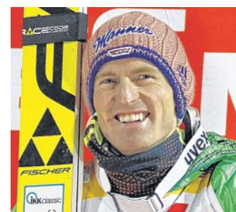
Severin Freund feierte seinen zweiten Saisonsieg.

Mit 305 Punkten verteidigte er das Gelbe Trikot des Gesamtführenden vor Prevc (264). Freund ist damit so gut wie noch nie in seiner Karriere in die Saison gestartet. Dank seiner hervorragenden Frühform trotz der Bayer selbst schwierigsten Bedingungen. Opfer der ständig wechselnden Winde wurde derweil Andreas Wellinger, der im ersten Versuch nur auf 114 Meter kam und als Halbzeit-20. alle Chancen einbüßte.