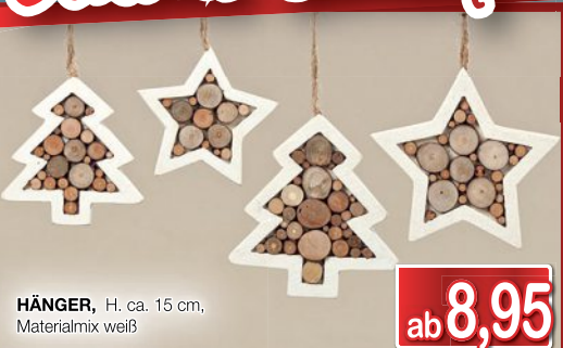
HÄNGER , H. ca. 15 cm, Materialmix weiß