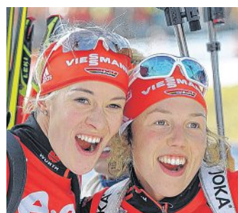
Maren Hammerschmidt (l.) und Laura Dahlmeier.

Die Winterbergerin war schon am Vortag als Zweite hinter Franziska Hildebrand ins Rampenlicht gestürzt. „Ich hätte nicht gedacht, dass es wieder so gut läuft“, sagte die 26-Jährige nach ihrem neuerlichen Klassenrennen. „Es ist wichtig, dass ich gemerkt habe, dass ich es wieder schaffen kann.“ Dahlmeier wunderte sich über sich selbst. „Vor ein paar Wochen hätte ich das nicht geglaubt“, befand sie. Nach ihrem dritten Weltcup-Sieg spielte sie auf die verkorkste Vorbereitung wegen ihrer gesundheitlichen Probleme an.