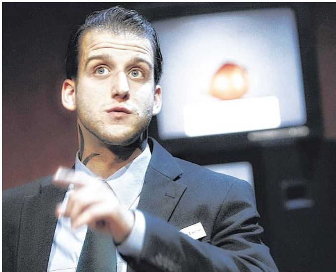
„NippleJesus“ wurde im Schauspielhaus Hannover bereits fast 150 Mal gespielt. Am Donnerstag ist das Kultstück in Haßbergens Alter Kapelle zu sehen.

„NippleJesus“ ist im Programm des Schauspielhauses ein Renner und wurde seit seiner Erstaufführung 2008 bereits fast 150 Mal gespielt. Und darum geht es. Ein Kunstwerk versetzt die Stadt in Aufruhr: Die Jesus-Collage aus pornographischen Bildern entfacht eine kontroverse Diskussion über Sinn und Unsinn der Kunst in deren Zentrum sich Dave, Ex-Türsteher und neuer Museumswärter, plötzlich befindet. Obwohl Dave von Kunst keine Ahnung hat und den Job im Museum ohne Idealismus beginnt, zieht ihn das umstrittene Kunstwerk bald in seinen Bann, und er sieht sich gezwungen, in der aufgeheizten