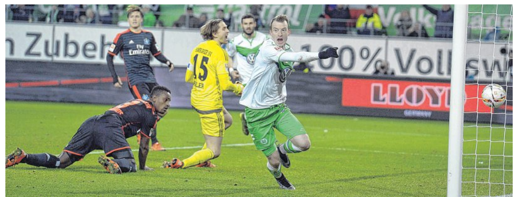
VfL Wolfsburgs Maximilian Arnold hat soeben den Ausgleich erzielt und dreht jubelnd ab.

Nach der Pause änderte sich das. VfL-Torjäger Bas Dost kam zur zweiten Halbzeit, später noch Daniel Caligiuri für Schürrle, so dass der VfL mehr Druck aufbauen konnte. Adler hatte nun ordentlich zu tun und zeichnete sich mehrere Male aus. Chancenlos war der Keeper, als Arnold eine Flanke von Vieira aus kurzer Distanz einschob. „Die kannst du nicht komplett vom Tor weghalten“, sagte Labbadia über die aufkommenden Wolfsburger.