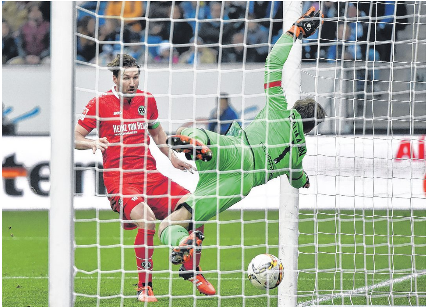
Seltener Aufreger: Hoffenheims Torwart Oliver Baumann rettet auf der Linie gegen Hannovers Christian Schulz.

„Das ist ein bitterer Nachmittag für uns. Ich denke, wir hatten genügend Torchancen, um was mitzunehmen“, meinte Chefcoach Michael Frontzeck, konnte damit aber nur ein paar wenige Kopfbälle gemeint haben. Nationalkeeper Ron-Robert Zieler erklärte: „Es ist extrem fatal, so einen Mitbewerber stark zu machen. Man sollte es eigentlich tunlichst vermeiden, gegen einen direkten Konkurrenten zu verlieren.“ Hannover fehlte allerdings in den verletzten Uffe Bech, Felix Klaus, Artur Sobiech und Hiroshi Kiyotake eine komplette Offensivreihe.