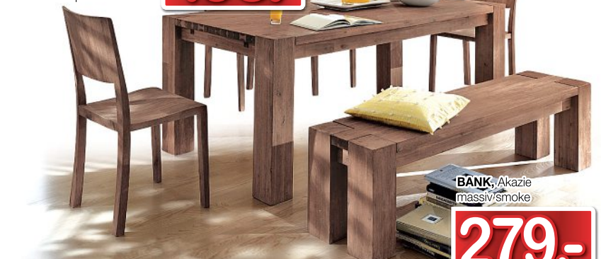
STUHL , Akazie massiv smoke JE 89,-