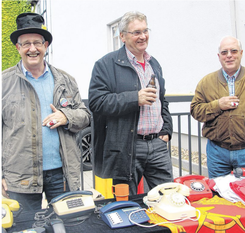
Nostalgie pur: Auch diese drei gut gelaunten Herren werden das Altstadtfest 2015 – trotz ihrer „schweren“ Verletzung – garantiert in guter Erinnerung behalten. Hagebölling

Kleine HamS-Umfrage ergab: Besucher kommen Jahr für Jahr aus Berlin oder Paderborn angereist. Und sogar aus England