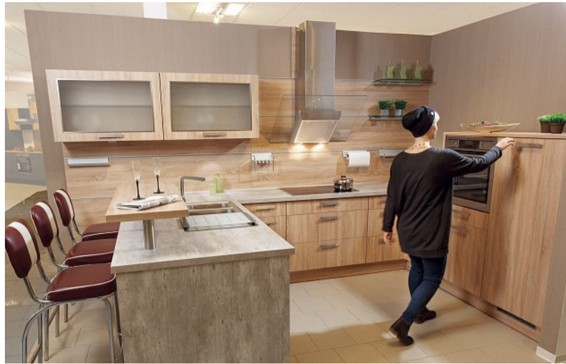
Die Fachberater vom Möbelhaus Henke planen Ihre neue Küche individuell mit Ihnen in der großen Musterausstellung mit fast 250 komplett aufgebauten Musterküchen.

Grau bis Schwarz. Die Farbtrends bei Küchenmöbeln umfassen derzeit vor allem Töne aus dem Grau-Bereich. Hellgrau, Betongrau, Industrie grau, Mausgrau, Dunkelgrau, bis hin zu Schwarz, stehen in den Produktionshallen der Industrie literweise bereit zum Abruf. Schwarz ist eine sogenannte unbunte Farbe. Sie wirkt vor allem elegant und ob man es glauben mag oder nicht, sie ist unauffällig. Gerade bei Objekten des Luxus lässt der Verzicht auf Farbe den Luxus selbstverständlich erscheinen, wie auch zum Beispiel bei kostbaren schwarzen Limousinen. Schwarz ist Eleganz ohne Risiko. Viele Kunden wollen das noble Schwarz und unterstreichen damit die dezente Wertigkeit ihrer neuen Küche. Beim Farbton Grau liegt der Fall etwas anders. Schon ein sehr helles Grau wirkt nicht so kühl wie ein hartes Weiß. Grau wirkt außerdem stets elegant und ist pflegeleichter als Weiß. Es lässt sich sehr gut mit warmen Holzönen beispielsweise von der Küchenarbeitsplatte kombinieren. Gerne werden heute auch Frontmaterialien und Farben miteinander kombiniert. So mutet im Oberschrankbereich warmes Kirschbaumfurnier sehr gut mit lackierten grauen Fronten im Unterschrankbereich an.