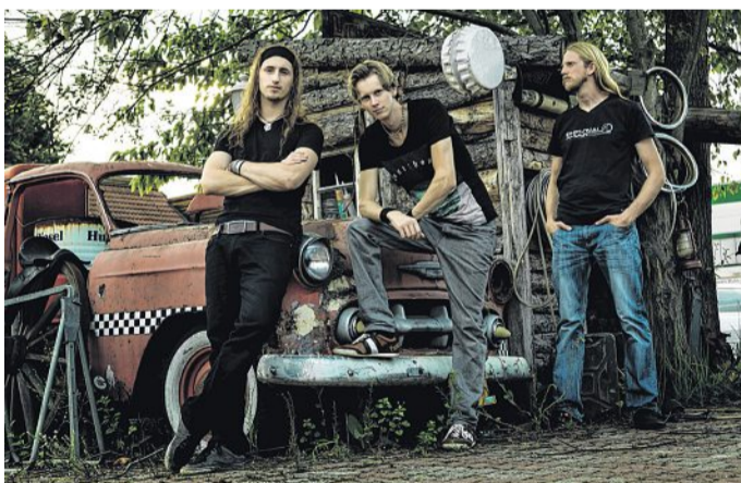
„I Think I Spider“: Am kommenden Sonnabend erneut im Kulturwerk.

Indoor-Musik-Event „I Think I Spider“ am 10. Oktober erneut im Nienburger Kulturwerk