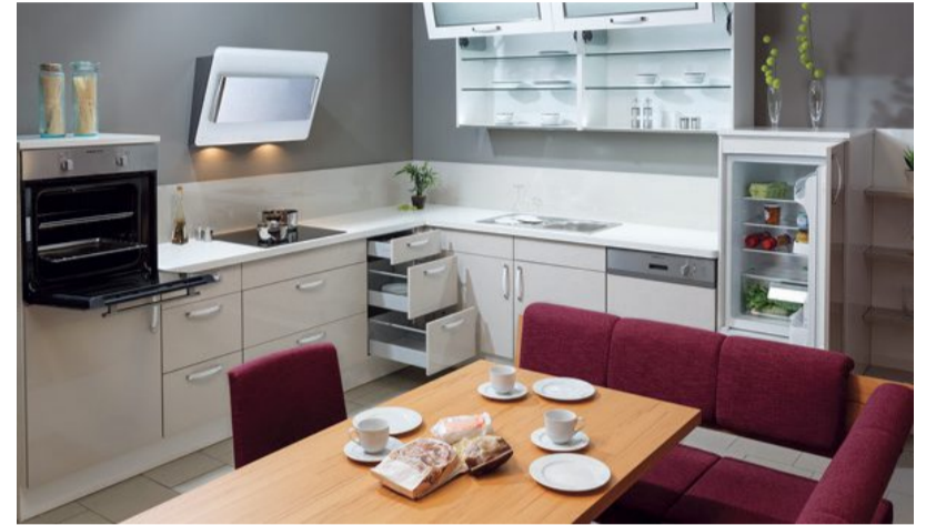
Die Besucher können in der großen Musterausstellung mit über 250 komplett aufgebauten Küchen alles sehen, anfassen und planen.

man viele Jahre auch optisch Freude haben sollte. Die sandfarbene Küche in Kombination etwa mit einer Edelstahlarbeitsplatte wirkt zeitlos schön und in Kombination mit einer Natursteinarbeitsplatte aus der gleichen Farbfamilie geschmackvoll und harmonisch. Alles in allem können Küchenkäufer aus einem vielfältigen und attraktiven Farbangebot ihre persönlichen Farbwünsche frei wählen. Die Fachberater von Henke-Küchen helfen gerne bei der Auswahl der richtigen Kombination