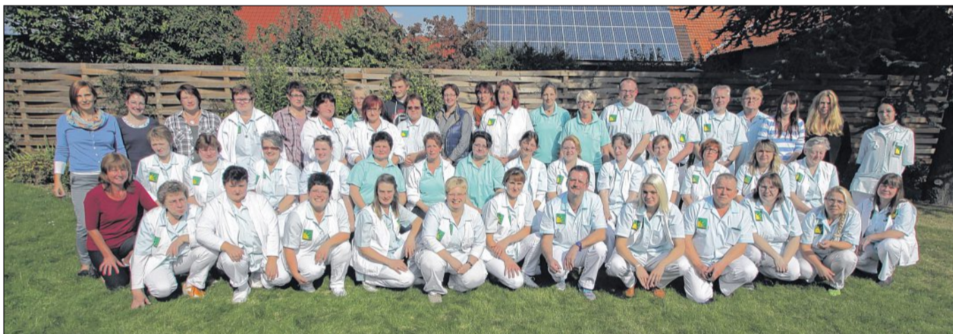
Das Team der SEKURA Kranken- und Altenpflege GmbH

ner Hand anzubieten, und damit den Menschen zu ermöglichen, so lange wie möglich in ihrer eigenen Häuslichkeit zu bleiben.