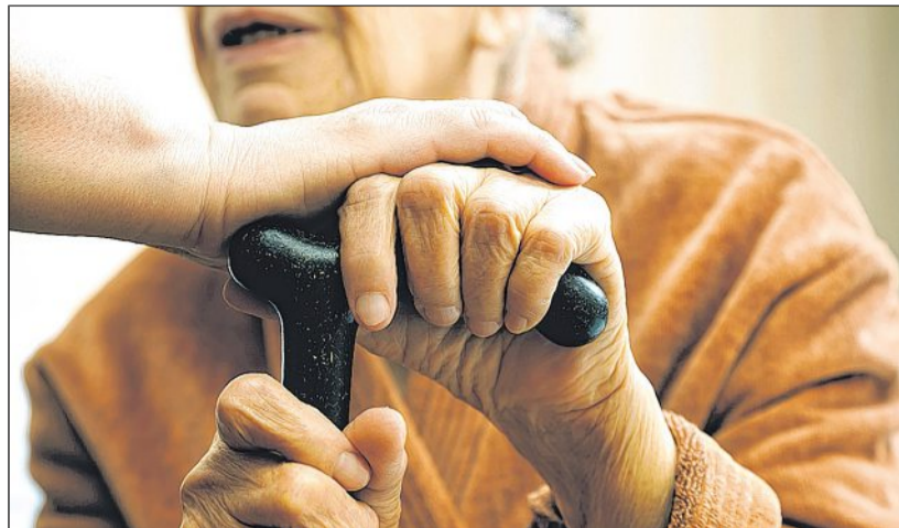
Eine stundenweise Verhinderungspflege unterstützt den Pflegenden.