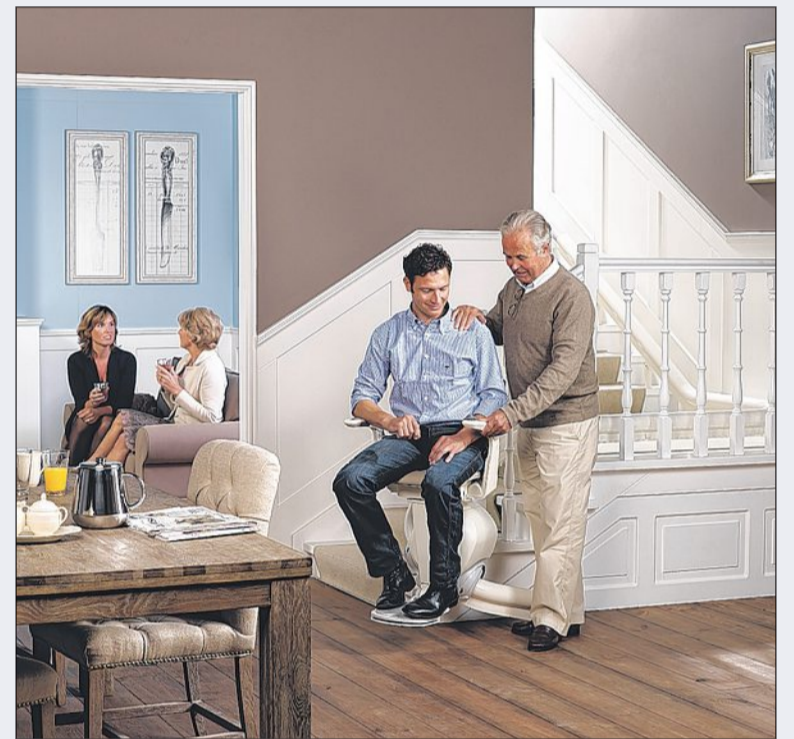
Durch den Treppenlift kann man im eigenen Haus bleiben.