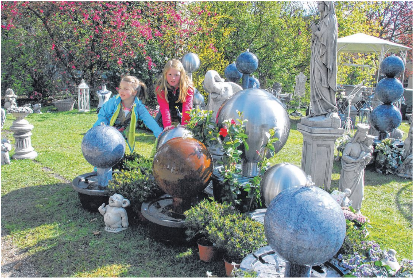
Shopping im Grünen und Top-Entertainment: die Landpartie 2015 präsentiert sich vom 28. bis 30. August mit neuem Profil.

Vor allem aber hat die Landpartie im vergangenen Jahr eines gezeigt: Sie wird von den Besuchern wie eine Auszeit vom