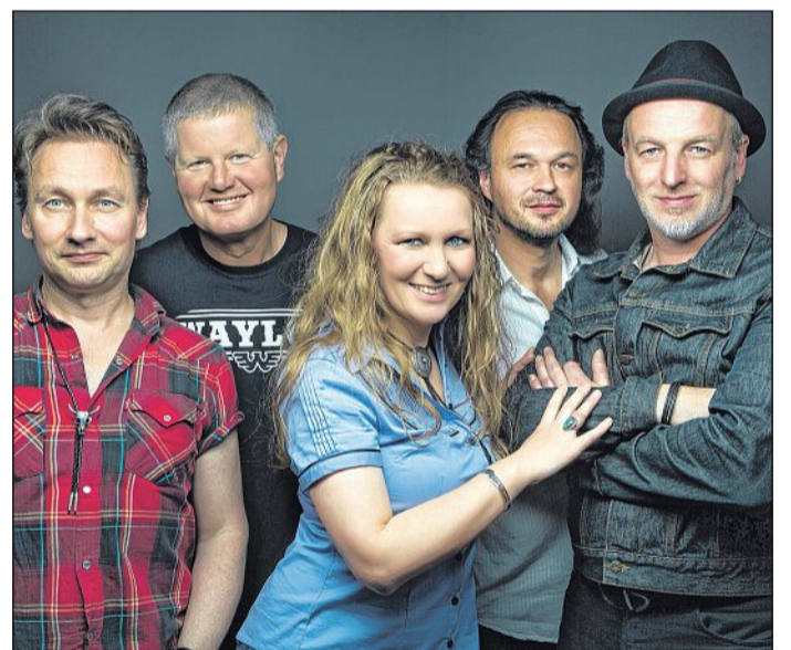
Die deutsche Country-Band „Slow Horses“