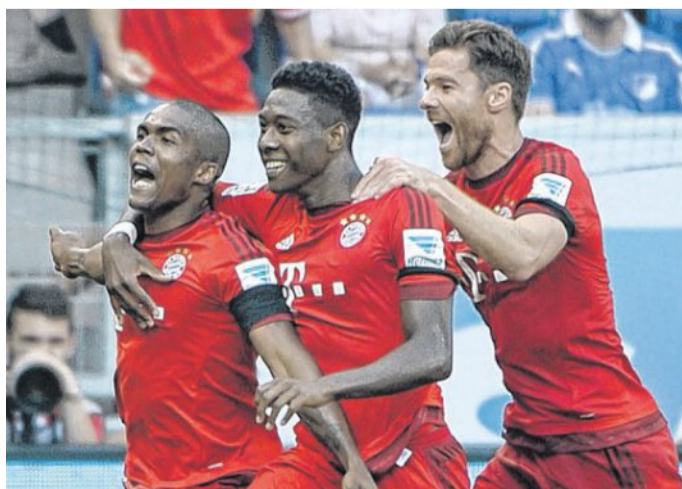
Die Bayern-Spieler Douglas Costa, David Alaba und Xabi Alonso (von links) bejubeln den Sieg in Sinsheim.

„Ich bin sehr zufrieden, vor allem mit der Leistung. Das war eines der besten Bundesligaspiele meiner Mannschaft in den vergangenen drei Jahren“, lobte Bayern-Coach Pep Guardiola. Mit seinem Tor in der 90. Minu-