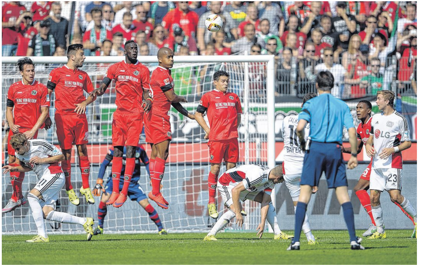
Ins Tor gezielt: Leverkusens Hakan Calhanoglu (verdeckt) trifft mit diesem direkten Freistoß zum 1:0-Endstand in Hannover.

Leverkusen steckte vor 39.100 Zuschauern in der nicht ausverkauften Arena den Ausfall des Millionen-Zugangs Charles Aránguiz gut weg. Nicht nur der chilenische Nationalspieler, der nach einem Riss der linken Achillessehne monatelang ausfallen wird, fehlte in der Startelf.