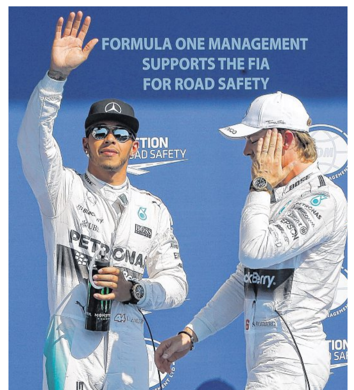
Lewis Hamilton (links) jubelt nach seinem Qualifikationssieg ins Publikum, Nico Rosberg verarbeitet die Enttäuschung.

Deutsche Kanuten verpassen bei WM vier Olympia-Quotenplätze