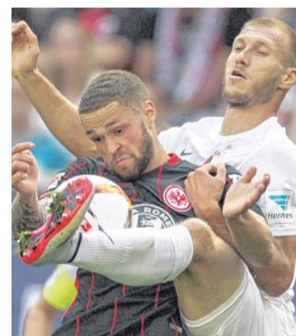
Augsburg und Frankfurt lieferten sich harte Duelle.

Erstmals in seiner Amtszeit verlor Augsburgs Trainer Mar-