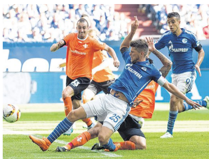
Mühe ohne Lohn: Schalke drängte gegen bissige Darmstädter auf den Siegtreffer, der aber nicht gelang.

Breitenreiter war bei seinem ersten Heimspiel in Gelsenkirchen zu einem Wechsel gezwungen. Weil Matija Nastasic sich zum Auftakt in Bremen die Achillessehne gerissen hatte, er-