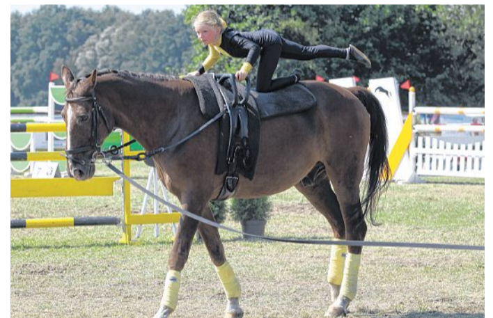
Ein mit großem Applaus bedachter Show-Auftritt der Voltigierer des RFV Nienburg durfte nicht fehlen. Dazu hatte die Gruppe einen Verkaufsstand, um Spenden für ein neues Pferd einzunehmen. „Unser 22-jähriger Bossi braucht Unterstützung“, hieß es auf einem Plakat.

Mehr im Internet: www.rfv-nienburg.de . Ergebnisse in Echtzeit: www.karl-heinzheise.de .