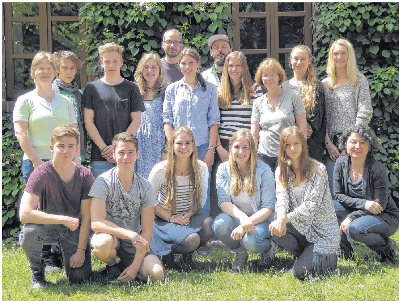
Die Gruppe mit ihren Begleiterinnen und den Seminarleiterinnen vor dem Seminarhaus.

Arivu und Albert-Schweitzer-Schule bereiten sich auf Schulaustausch mit Indien vor