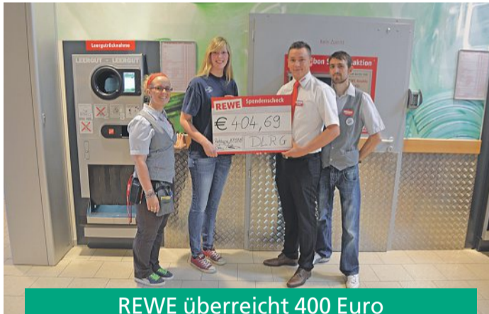
REWE überreicht 400 Euro Pfandbonspenden an DLRG

Spargelsaison begann in diesem Jahr aufgrund der kühlen Witterung fast vier Wochen später als im vergangenen Jahr. Dennoch nahm sie einen positiven Verlauf. Insbesondere neu aufgetane Vermarktungswege belebten das Geschäft und hielten die Preise stabil. Immer beliebter wird der geschälte Spargel, der in Tiefziehschalen verpackt mehrere Tage im Kühlschrank haltbar ist. Zudem wurde der in der Region bekannte Spargel des Hofes in diesem Jahr auch nach Süddeutschland oder die Schweiz geliefert. Ruhe kehrt auf dem Hof Röhrkasten trotzdem noch nicht ein. Zeitgleich mit dem Ende der Spargelsaison begann die Heidelbeerernte. Durch zeitverzögerte Anpflanzungen und geschickte Auswahl der Pflanzensorten ist der Hof Röhrkasten in der Lage, voraussichtlich bis Ende September täglich frische Erdbeeren und Heidelbeeren anzubieten.