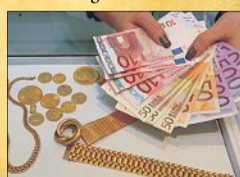
Sofort Bargeld, selbstverständlich

Schmuckverkauf ist bekanntlich Vertrauenssache. Viele Kunden haben uns ihr Vertrauen bereits geschenkt – dafür bedanken wir uns.