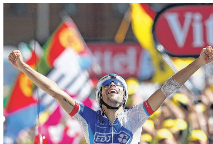
Überglücklich reist der Franzose Tibaut Pinot kurz vor dem Zielstrich die Arme in die Höhe.

Auf der nur 110 Kilometer langen „Sprintetappe“ in den Alpen ging es auf dem Weg nach L'Alpe d'Huez noch einmal hoch her. Froome und sein wiedererstarktes Sky-Team erstickten zunächst fast alle Angriffe im