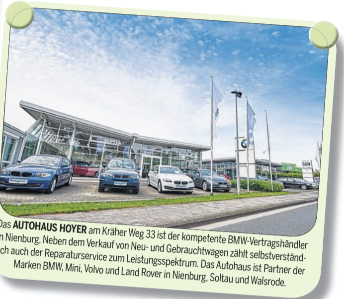
Das AUTOHAUS HOYER am Kräher Weg 33 ist der kompetente BMW-Vertragshändler in Nienburg. Neben dem Verkauf von Neu- und Gebrauchtwagen zählt selbstverständlich auch der Reparaturservice zum Leistungsspektrum. Das Autohaus ist Partner der Marken BMW, Mini, Volvo und Land Rover in Nienburg, Soltau und Walsrode.