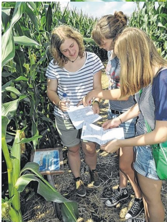
Ab in den Mais: Seit gestern gibt's im Maislabyrinth Groß Mackenstedt wieder Verwirrspaß für alle.