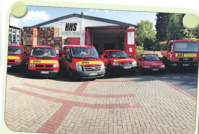
Seit 1996 besteht die Firma HHS - GARTENBAU in Nienburg, seit 2005 ist sie am Rendelkamp 4a ansässig. Seit knapp 20 Jahren werden fast sämtliche Arbeiten im Außenbereich wie Baumfällungen, Gartenpflege, Pflasterarbeiten und Zäune vom qualifizierten Personal für gewerbliche und private Kunden ausgeführt.