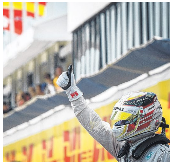
Daumen hoch für Lewis Hamilton. Der Brit holte sich auf dem Hungaroring die Pole Position vor Nico Rosberg.

Hamilton setzte in seinem letzten Versuch auf dem 4,381 Kilometer langen Kurs mit 1:22,020 Minuten ein Zeichen. Lauda urteilte voller Bewunderung: „Er zaubert einfach Runden hin, die im Moment kein anderer hinzaubern kann.“ Nico Hülkenberg verpasste nach dem herben Rückschlag am Freitag als Elfter knapp den Sprung in die Top Ten.