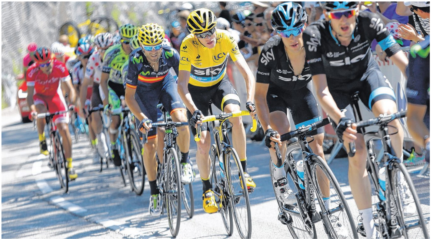
Mit allerletzter Kraft fährt der Brite Christopher Froome begleitet von seinen beiden vorausfahrenden Helfern des Sky-Teams den Anstieg nach L'Alpe d'Huez hoch und verteidigt - wenn auch mit Mühe - sein Gelbes Trikot.