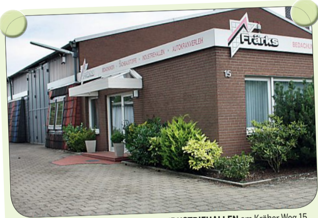
Die Firma FRÄRKS BEDACHUNGEN INDUSTRIEHALLEN am Kräher Weg 15 bietet ein breites Leistungsspektrum an: Bedachungen aller Art, Bauklempnerei, Errichten von Industriehallen, Verkauf von Dachbaustoffen, Energieberatung, Fassadenverkleidungen, Abbau und Entsorgung von Asbestplatten, Autokranverleih sowie Blitzschutzanlagen und Holzarbeiten.