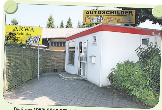
Die Firma ARWA-SCHILDER . Auf dem Kampe 2, ist direkt am Parkplatz des Straßenverkehrsamtes. Zu den Leistungen zählen das Anfertigen von Kfz-Kennzeichen und Schildern aller Art, ein Zulassungsdienst sowie das Ausstellen von Kurzzeitversicherungen.