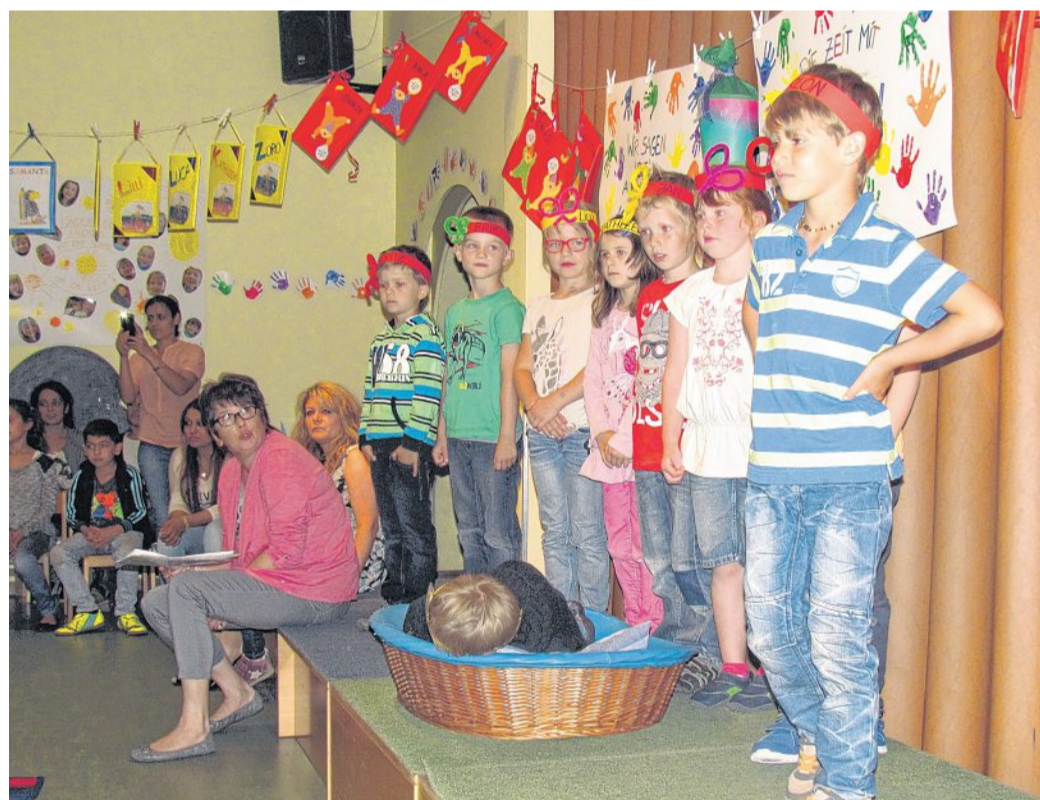
Mit einer Übernachtungsparty verabschiedete die Kita „Kleine bunte Welt“ in Eystrup ihre Schulanfänger. Das Kuscheltier durfte natürlich auch dabei sein.