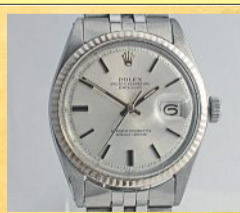
Markenuhren werden auch angenommen.