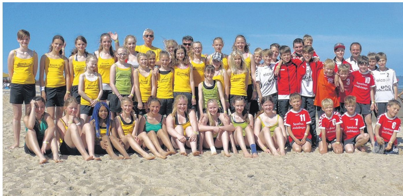
Die HSG-Nachwuchsteams tobten durch den Strand von Cuxhaven.

fen die Entscheidung bringen und da zogen die HSG-Juniorinnen jeweils mit nur einem Tor Differenz, also mit dem knappsten aller Ergebnisse, den Kürzeren. Ähnlich wie bei den Jungs und den D-Mädels tat das aber der Stimmung keinen Abbruch. Erfolgreichstes HSG-Team waren die C1-Mädels von Trainer Wolfgang Haufe. Erst im Halbfinale war für die Beach-erfahrenen Weserstädterinnen Schluss. Das Spiel um Platz drei gegen die „Vampires“ aus Oyten konnten die Nienburgerinnen im Penaltywerfen für sich entscheiden und freuten sich über einen tollen Abschluss eines ereignisreichen Wochenendes. DH