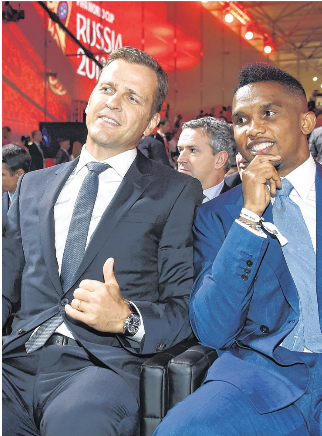
DFB-Teamchef Oliver Bierhoff (links) und die ivorische Sturmliege Samuel Eto'o hatten bereits vor der Auslosung beste Laune.

Zusammen mit dem russischen Rekordtorschützen Alexander Kerschakow zog der Europameister von 1996 vor 2000 Ehrengästen im Saal die Lose für die europäischen Gruppen. Eigentlich hatte der Weltverband Löw für die Rolle angefragt, der Bundestrainer verzichtete aber auf die Reise nach