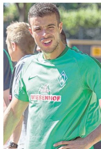
Verlässt Werder: Stürmer Franco Di Santo.