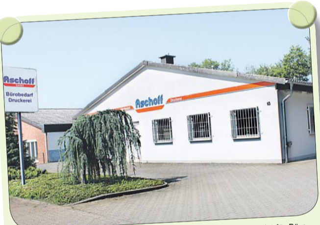
Die Firma ASCHOFF . Auf dem Kampe 13, versteht sich als Spezialist für Bürobedarf aller Art. In der Druckerei werden Drucksachen von der Visitenkarte über Briefbögen bis hin zu Präsentationsmappen angefertigt – und das vom Layout bis zum Druck und anschließender Bindung.