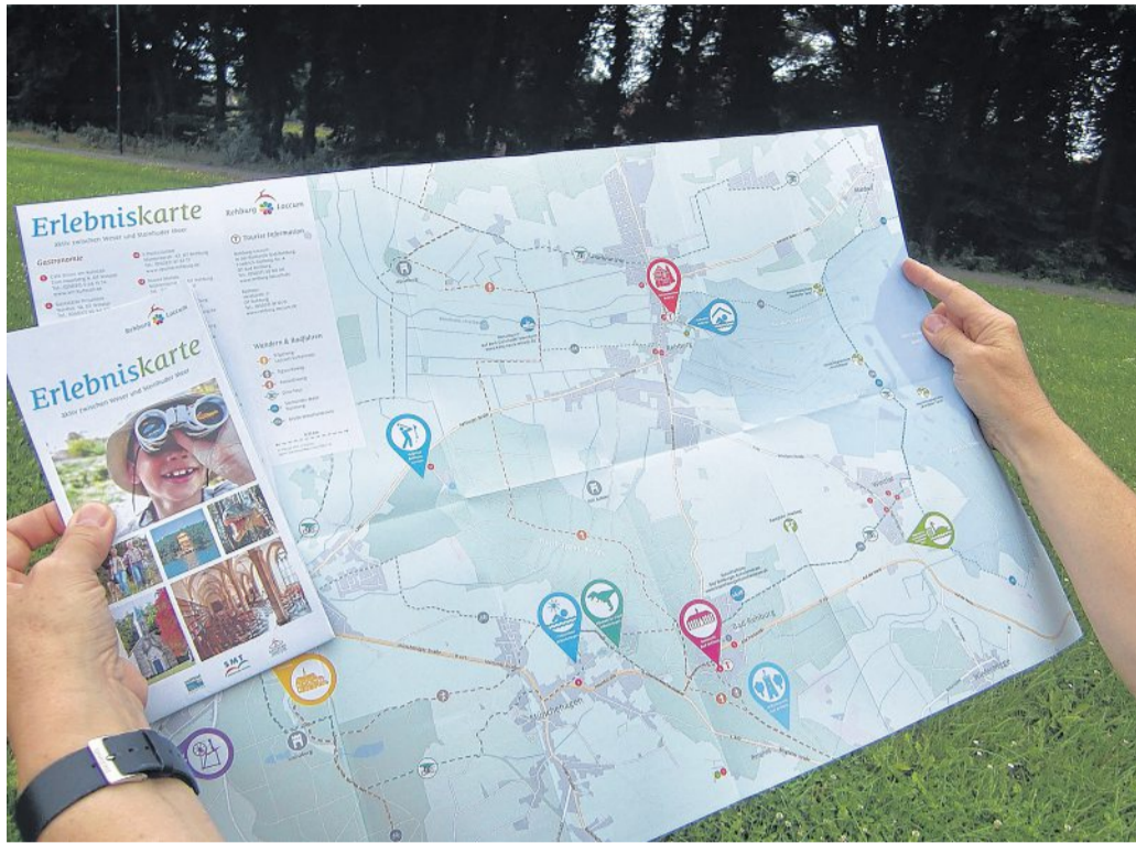
Ab sofort zu haben ist die Erlebniskarte für Rehburg-Loccum.

und Kulturdenkmal aus der Zeit der Romantik auf die Gäste. Im ehemaligen Badehaus befindet sich eine Ausstellung zum Kurleben der Romantik, in der Wandelhalle gegenüber die Tourist-Information. Zudem finden im Veranstaltungssaal der Wandelhalle regelmäßig kulturelle Veranstaltungen statt. Damit bei einem Besuch von Rehburg-Loccum der Genuss nicht zu kurz kommt, ist eine Übersicht über das gastronomi-