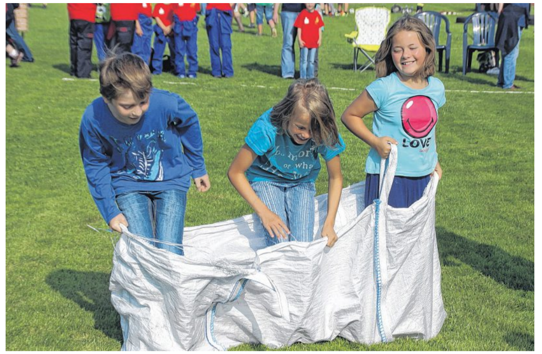
Die Mädchen aus Stöckse hatten eine ruhige Hand beim Transportieren einer Wasserschale (oben links). Keine Probleme hatten die Steimbker „Löschpanther“ beim Sackhüpfen im Bigbag (oben rechts). Die Uchter „Feuerflitzer“ manövierten einen Luftballon heile über den Parcours (unten). Die Stöckser „Feuersteine“ leiteten Wasser durch einen D-Schlauch in einen Eimer (ganz unten). Die kleinen „Feuerdrachen“ aus Wietzen pusteten einen Tischtennisball durch eine Slalomstrecke (unten rechts). Schiebe (5)