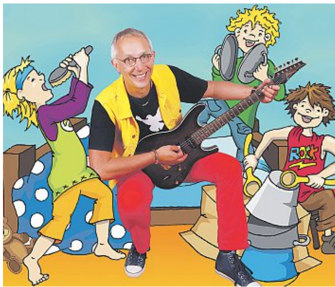
Das Kinder-Mitmach-Rock-Konzert findet heute ab ca 16 Uhr statt.

Dennoch gibt es auch in diesem Jahr wieder Veränderungen im Ablauf des Scheibenschießens. Dies geschieht unter dem Grundsatz, die bestehende Tradition in die heutige Zeit zu übertragen und den Besuchern und den Teilnehmern weiterhin ein schönes und ansprechendes Fest zu bieten. So wird das Pell-