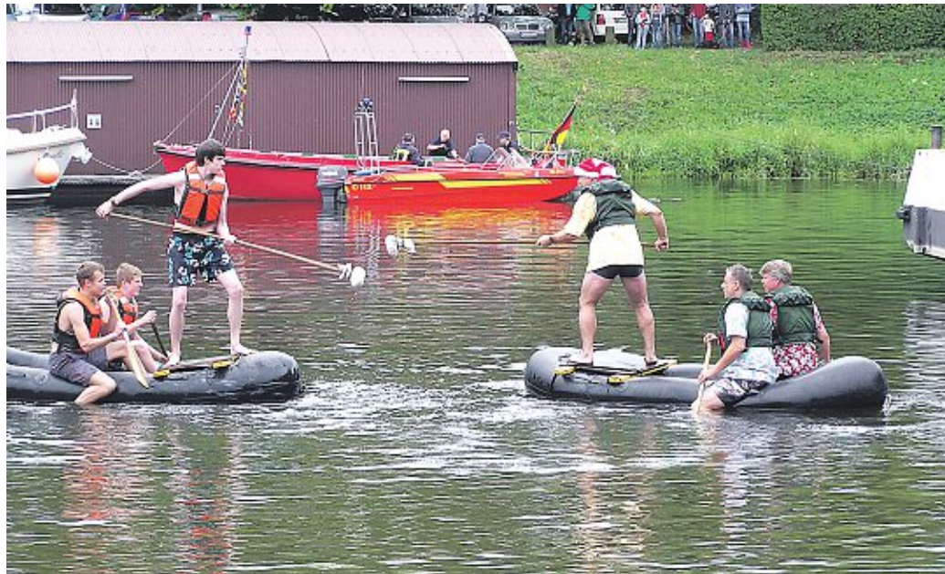
Am 20. Juli findet im Nienburger Hafen wieder das Fischerstechen statt. Anmeldungen sind ab sofort möglich.

Anmeldungen für Fischerstechen am 20. Juli ab sofort möglich