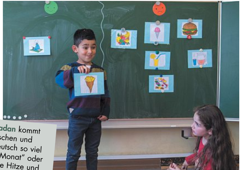
Was ist im Ramadan erlaubt, was ist verboten? Kinder lernen das in der Schule.

Das Wort Ramadan kommt aus dem Arabischen und bedeutet auf Deutsch so viel wie „der heiße Monat“ oder auch „brennende Hitze und Trockenheit“. Der Fastenmonat richtet sich nach dem Mondkalender. Daher startet der Ramadan nicht immer am selben Datum.