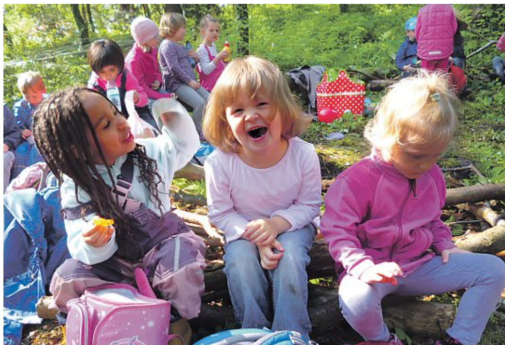
Nachdem der Frühstücksplatz mit dem Waldsofa wieder hergerichtet war, hatten die Kinder aus Leeseringen viel Spaß bei der Waldwoche.

Waldwoche des Kindergartens begann mit einer Überraschung