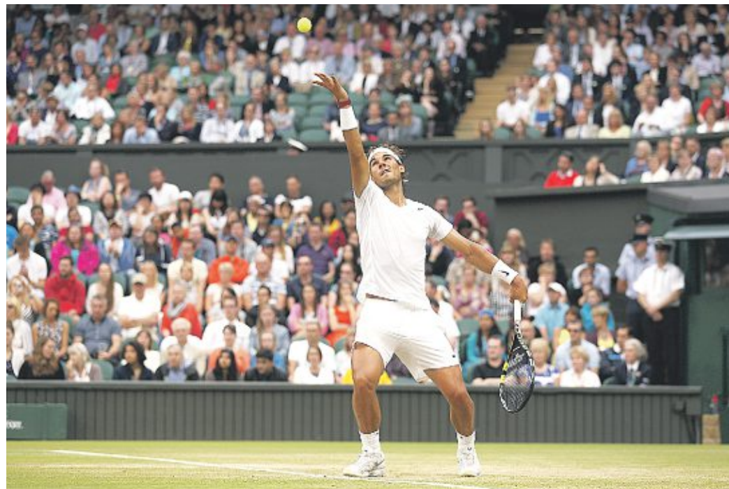
Rafael Nadal (Foto) bezwang Michail Kukuschkin mit 6:7, 6:1, 6:1 und 6:1.

Australier Nick Kyrgios oder den 20 Jahre alten Tschechen Jiri Vesely.