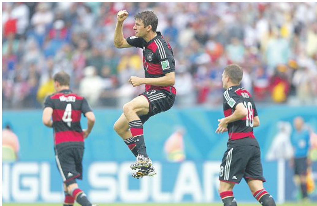
Thomas Müller (Mitte) war schon für viele Höhenflüge der deutschen Nationalmannschaft mitverantwortlich.