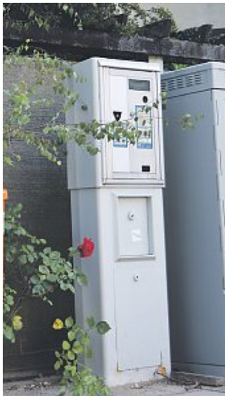
Während der Parkscheinautomat „Leinstraße“ (links) demnächst versetzt und mit der neuen Software versehen wird, bleibt beim Automat „Theater“ (Mitte) vorerst alles beim Alten. Der Automat „Weserwall“ (rechts) bleibt an seinem angestammten Platz. Das Parken wird dort sogar günstiger.