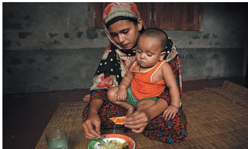
Viele Mädchen müssen heiraten und Kinder kriegen, obwohl sie noch viel zu jung dafür sind.

Die Kinderrechtskonvention ist gemacht worden, damit klar ist, welche Rechte Kinder haben. So