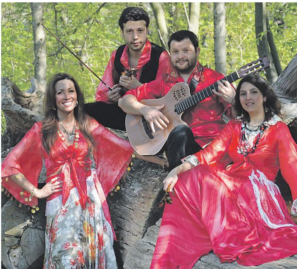
Am 5. Juli im Diepholzer Schloss: Zariza Gitara.

Gitarren. Gerade die Lieder der russischen Zigeuner bringen wie kaum eine andere Musik den bittersüßen Schmerz und