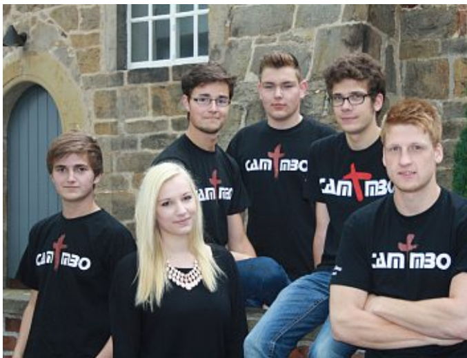
Auch die Jugendband „Camambo“ aus Holtorf sorgt für gute Laune beim 3. Nienburger Begrüßungstag.

Der Fachbereich Bildung, Soziales und Sport bietet in Kooperation mit dem SBV Erichshagen sportliche Aktivitäten an. Kinder und Jugendliche stellen ihr Geschick beim Torwandschießen unter Beweis. Außerdem können sie sich bunte Buttons prägen lassen. Sprichwörtlich spannend geht es bei den Bogenschützen des Schützenvereins Holtorf zu, wenn sich Jung und Alt im Bogenschießen versuchen.