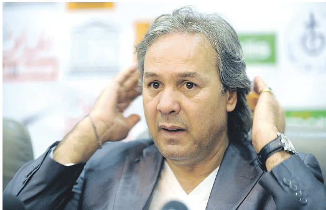
32 Jahre lang hat Algeriens Fußball-Idol Rabah Madjer auf das Wiedersehen mit der DFB-Elf in Porto Alegre am Montag gewartet.

„Wir wissen, wie 1982 der Sieg gegen Deutschland zustande kam - mit Leuten wie Madjer, Salah Assad oder Lakhdar Belloumi. Wir wollen in die Fußstapfen dieser Spieler treten“, sagte Sturmtank Islam Slimani, Jahrgang 1989 und Schütze des so wichtigen 1:1 gegen Russland: „Wenn dies damals möglich war, warum sollten wir nicht davon träumen, es ein weiteres Mal gegen Deutschland zu schaffen?“