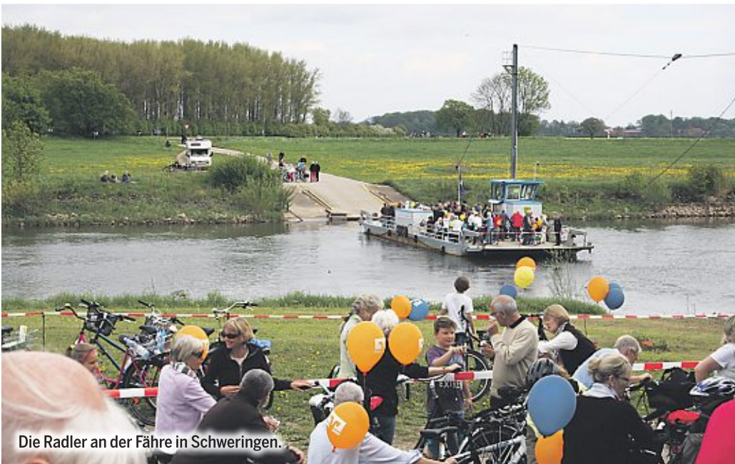
Die Radler an der Fähre in Schweringen.

An Himmelfahrt findet zum mittlerweile 16. Mal die beliebte Fahrrad-Rallye statt