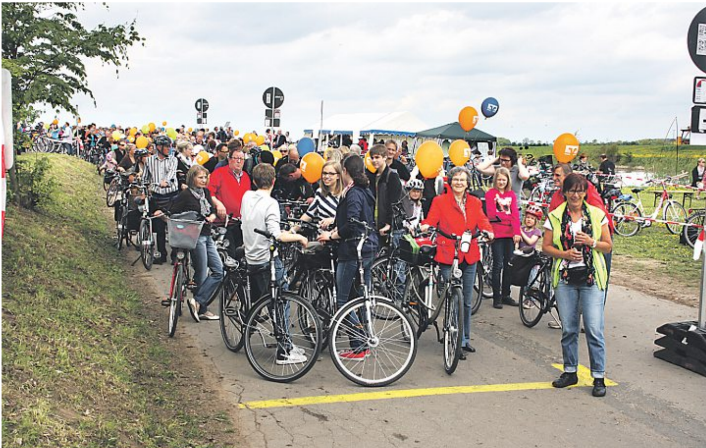
Der Tross am Fähranleger in Schwerin.