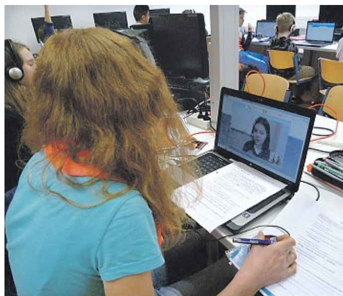
Deutsch-spanische Begegnung per Skype.

6c des MDG traf sich per Skype mit spanischer Partnerklasse