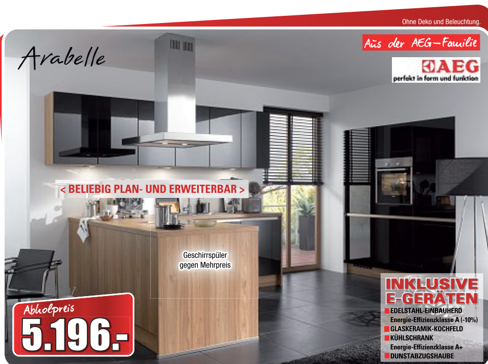
Designküche , Front: schwarz Hochglanz, Korpus: Walnuss, Arbeitsplatte: Walnuss, Maße ca. 180 + 246x227 cm