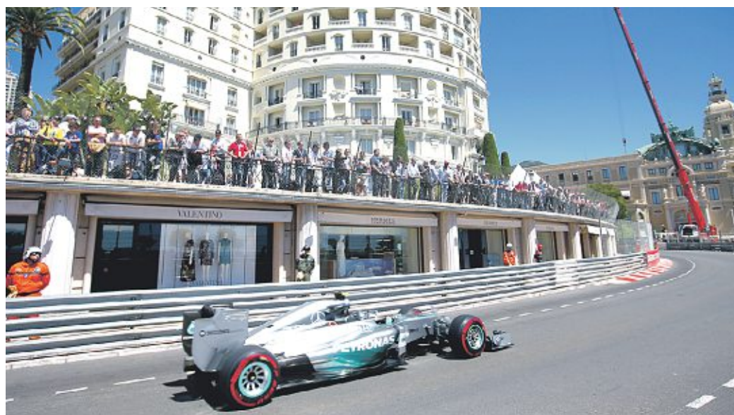
Nico Rosberg kann heute die WM-Führung zurück erobern.