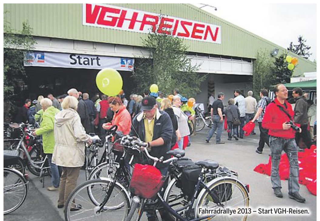
Fahrradralleye 2013 - Start VGH-Reisen.