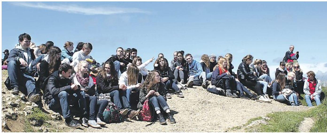
Die Gruppe beim Picknick im Sonnenschein an der Steilküste von Etretat.

Hoya. Der Tanzsportclub Hoya bietet ab dem 21. Juni im „Lindenhof“ wieder Disco-Fox-Kurse an. Weitere Informationen unter 0172/45 43 565. DH