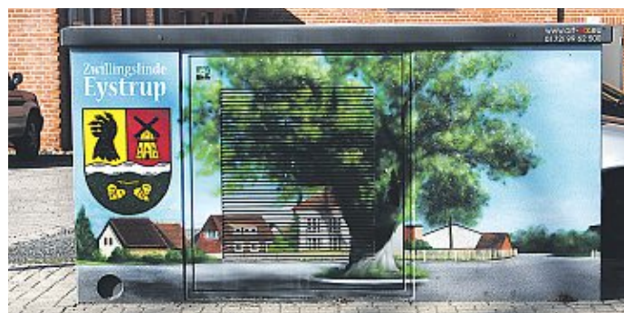
Am Trafo vor Göbber ist die alte Zwillingslinde gut dargestellt wieder sichtbar.

Eystrup feiert heute wieder wie in früheren Zeiten