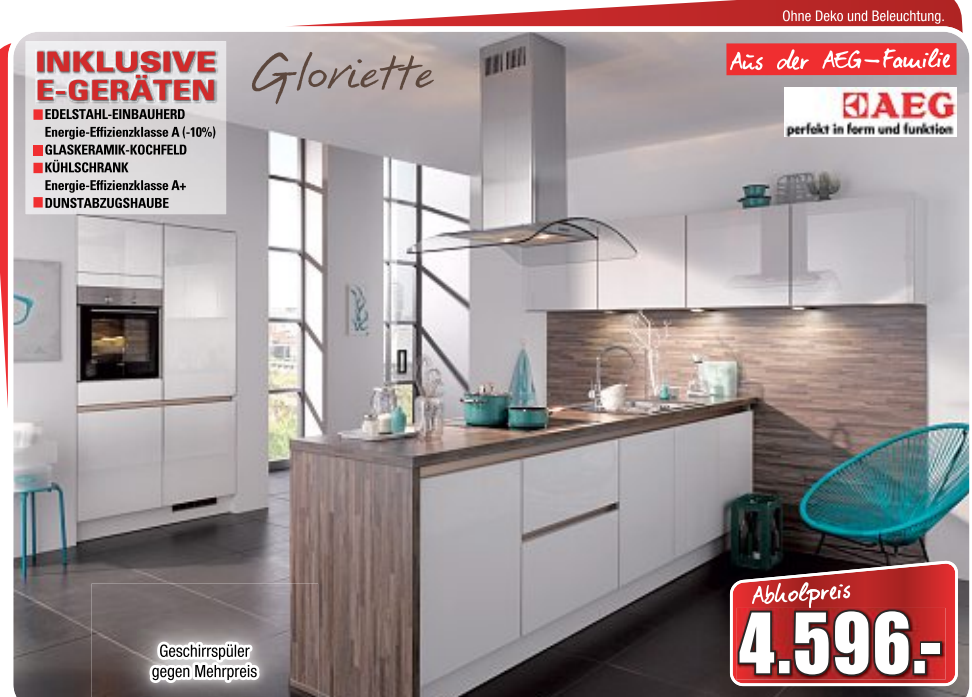
Moderne Küche , Front: weiß/moonlight grey, Korpus: weiß, Arbeitsplatte: Papyrus Nubia, Maße ca. 120 + 240 + 320 cm