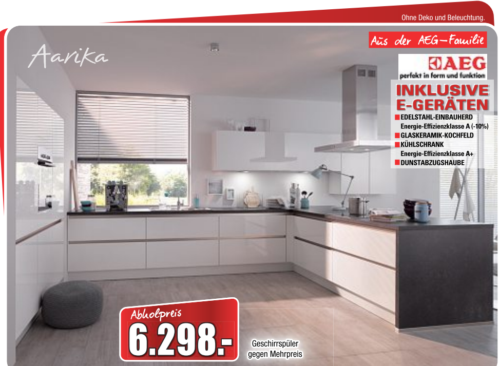
Moderne Küche , Front: weiß/moonlight grey, Korpus: weiß, Arbeitsplatte: Papyrus Nubia, Maße ca. 120 + 240 + 320 cm