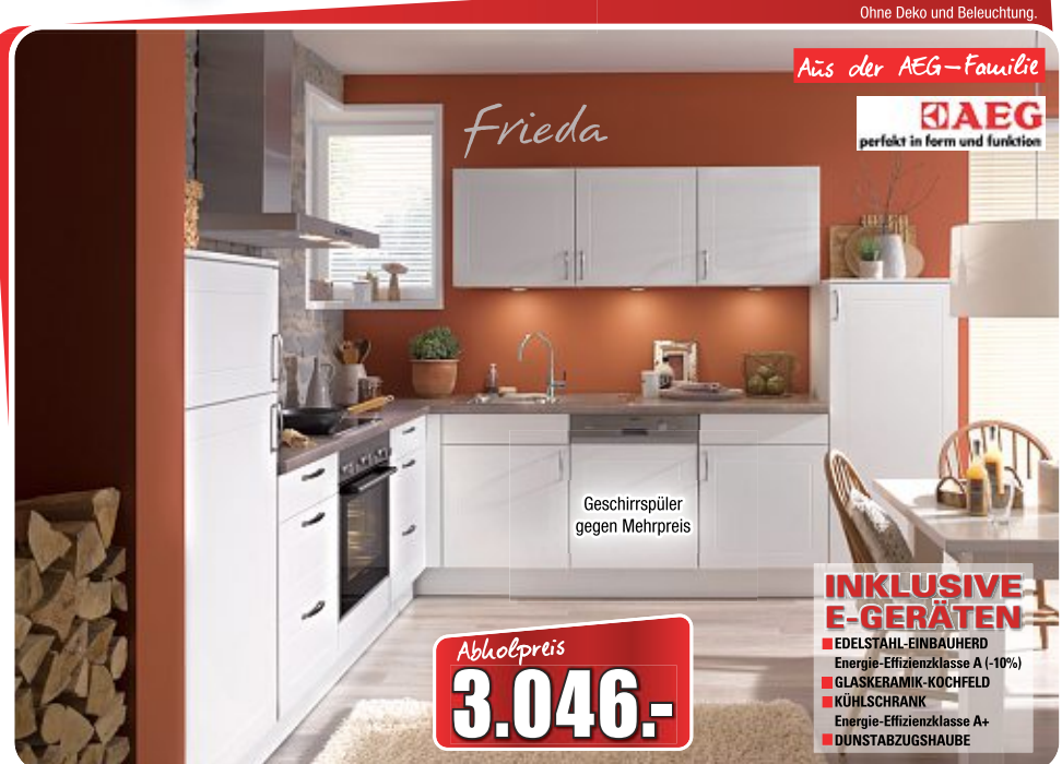
Winkelküche , Front: weiß Seidenmatt, Korpus: weiß, Arbeitsplatte: Factory, Maße ca. 285x305 cm