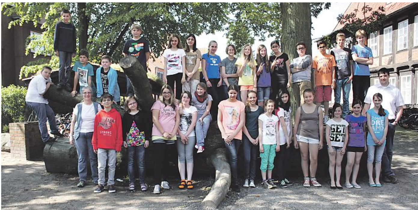
Die 6e des Marion-Dönhoff-Gymnasiums gehört zu den besten zwölf Klassen Deutschlands. Das untere Foto zeigt die Kinder vor der Aufzeichnung: Eine Produktionsassistentin erklärt den Schülerinnen und Schülern die Wissensquiz-Regeln. Duensing

Bei einem Experiment musste erklärt werden, was passiert,