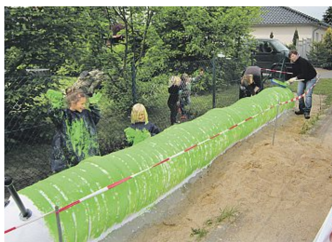
Die Raupe Nimmersatt zielt jetzt den Eingangsbereich der Kindertagesstätte „Die Kleinen Strolche“ in Haßbergen.

Ihr direkter Draht zur HARKE am Sonntag Telefon (0 50 21) 966-447 oder per Email unter eha@dieharke.de