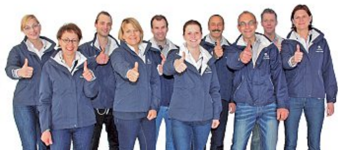
Gemeinsam erfolgreich: das Team der Autohaus Hopp GmbH aus Steyerberg unterstützt den örtlichen Fußball.