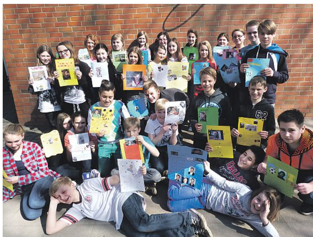
Die 6c mit den Steckbriefen ihrer spanischen Partner.