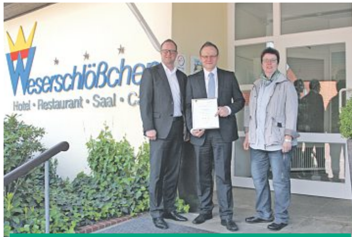
Auszeichnung für das Hotel Weserschlöbchen in Nienburg