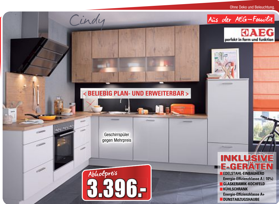
Winkelküche , Front: sandbeige/Cora Wild Oak, Korpus: sandbeige, Arbeitsplatte: Wild Oak, Maße ca. 245x312 cm