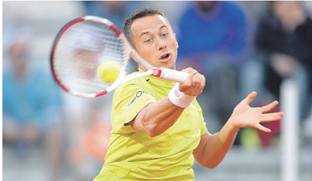
Philipp Kohlschreiber setzte sich mit 6:2, 7:6 (7:4) durch.

Kohlschreiber war als Topgesetzter in das Sandplatzturnier am Rolander Weg gestartet und wurde seiner Favoritenrolle gerecht; im Finale sogar problemloser, als es viele Zuschauer erwartet hatten. Karlovic verbreitete mit seinem Aufschlag deutlich weniger Schrecken als in den vorangegangenen Matches: