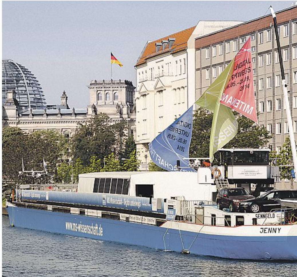
Die „MS Wissenschaft“ ankert vom 3. bis 5. Juni unterhalb der Nienburger Weserbrücke.

Ausstellungsschiff am Weseranleger vom 3. bis 5. Juni täglich von 10 bis 19 Uhr für alle Interessierten geöffnet