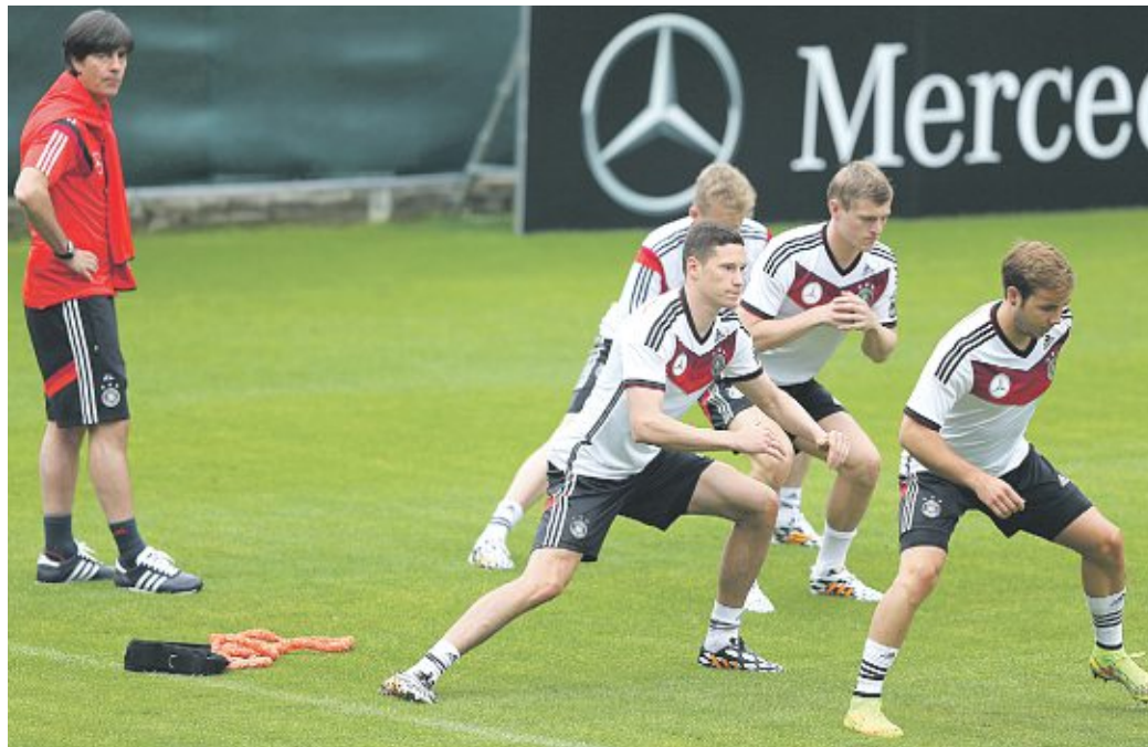
Joachim Löw (links) beim Training mit den gesunden Spielern.

Lahm (Kapselriss im Sprunggelenk) und Neuer (Kapselverletzung in der Schulter) hatten sich beim Pokalsieg des Rekordmeisters Bayern München am vergangenen Samstag in Berlin gegen Borussia Dortmund (2:0 n.V.) verletzt und kommen seitdem nicht so recht auf die Beine.