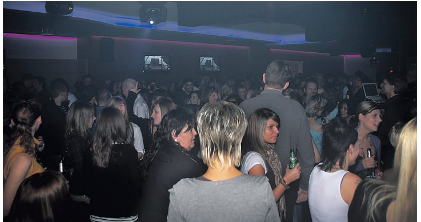
Die LUG ist am Pfingstsonnabend zum letzten Mal geöffnet. Dieses Foto entstand bei der Eröffnung im Januar 2010.

Sonnabends und bei den Ü 40-Partys seien zwar auch noch die Älteren gekommen, an der Überlegung, das Kapitel LUG auf kurz oder lang zu beenden, konnte das jedoch nichts mehr ändern. Den endgültigen Ausschlag gab dann der Vorfall, der im Winter bei Facebook für Schlagzeilen sorgte. Einer der Türsteher hatte offenbar einen Gast geschlagen. „Ich habe mich mehrfach entschuldigt, dem Türsteher wurde fristlos gekündigt, dennoch musste ich mich über Wochen hinweg aufs Übelste beschimpfen lassen“, so Hei-