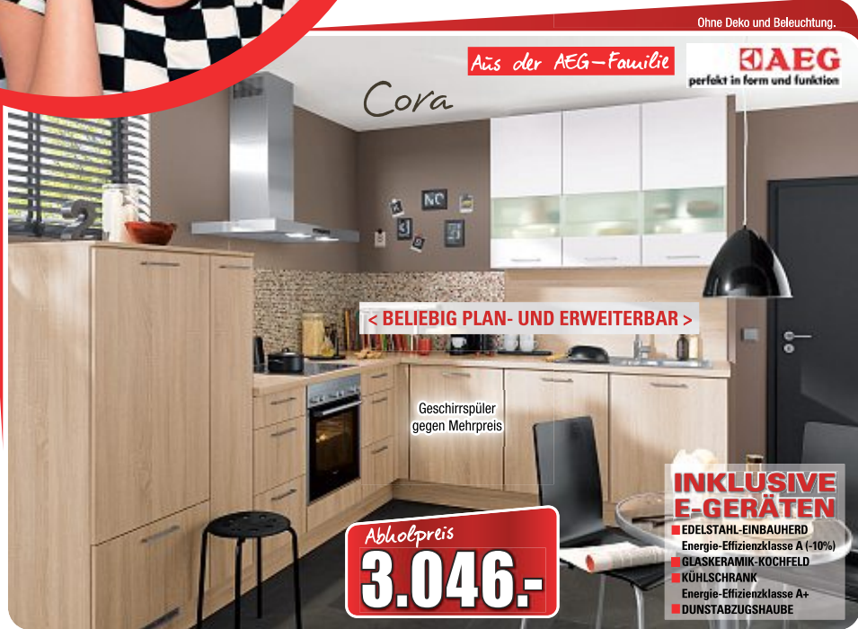
Winkelküche , Front: Sonoma Eiche/Moonlight grey, Korpus: Sonoma Eiche, Arbeitsplatte: Sonoma Eiche, Maße ca. 305x245 cm