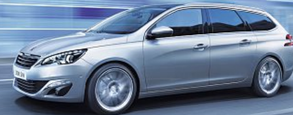
Abb. enthält Sonderausstattung.