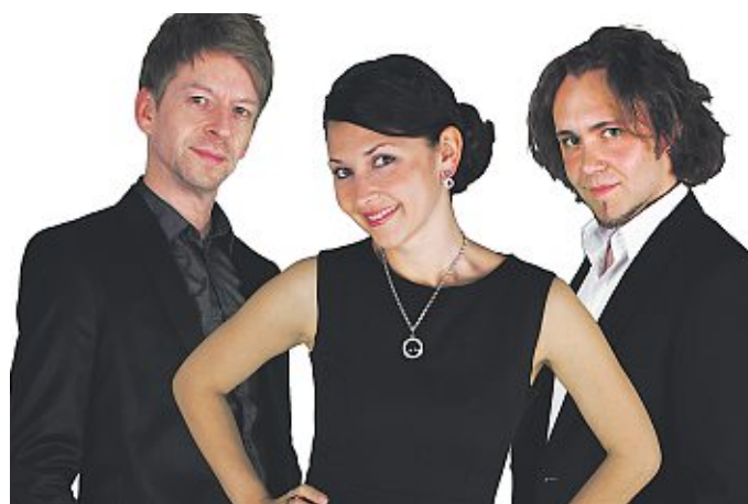
Auch Mr. Moonlight spielt beim „Großen Fest im Kleinen Garten“.

Am 9. August wieder „Großes Fest im Kleinen Garten“ rund ums Binderhaus