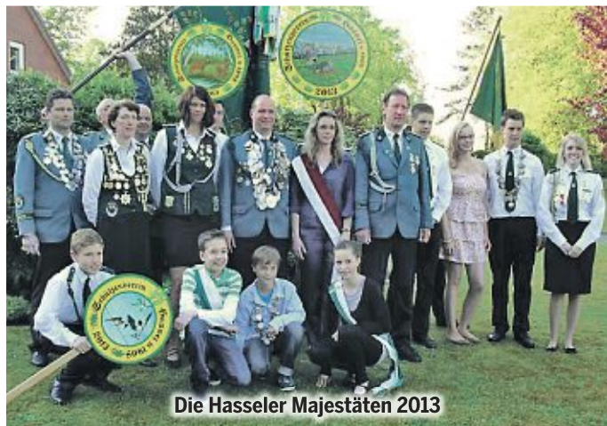
Die Hasseler Majestäten 2013