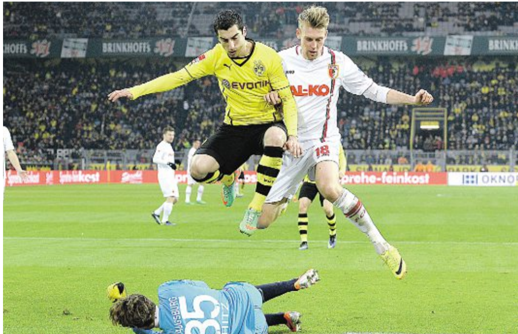
Henrikh Mkhitaryan (links) und Jan-Ingwer Callsen-Bracker begegnen sich in der Luft. Freudensprünge machte nach dem Spiel aber nur der Augsburger.

Blaszczykowski wird, sollte sich die Diagnose bestätigen, bis zum Saisonende nicht mehr zur Verfügung stehen.