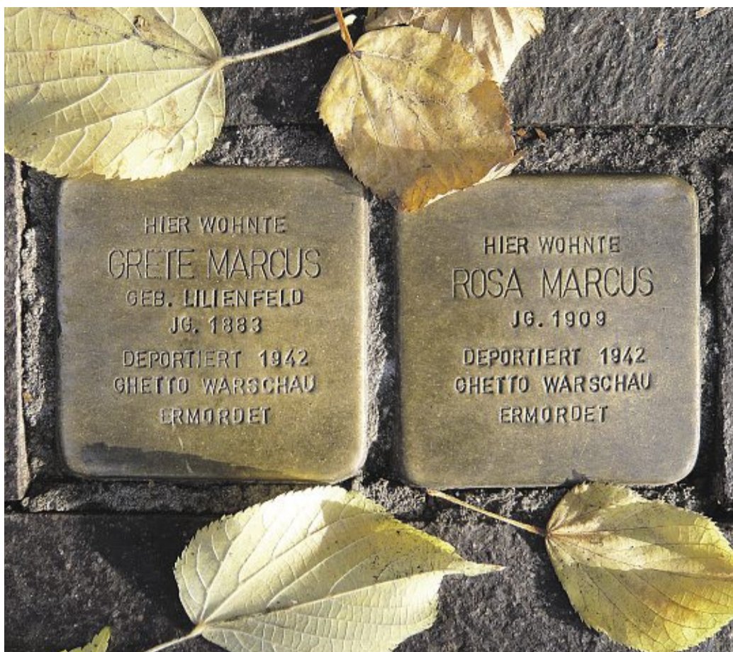
Stolpersteine für Grete und Rosa Marcus wurden vor dem Haus Lange Straße 14 in Nienburg verlegt. Dort haben beide bis zu ihrer Deportation ins Warschauer Ghetto gelebt.

Am morgigen 27. Januar jährt sich zum 69. Mal die Befreiung des Konzentrationslagers Auschwitz. Dieser Jahrestag wurde 1996 auf Initiative des damaligen Bundespräsidenten Roman Herzog offizieller deutscher Gedenktag für die Opfer des Nationalsozialismus. Die Vereinten Nationen erklärten den 27. Januar im Jahr 2005 zum Internationalen Tag des Gedenkens an die Opfer des Holocausts. Auch in Nienburg wird man nicht müde, an das Schicksal der vielen, vielen Frauen, Männer und Kinder zu erinnern, die von den Nationalsozialisten gedemütigt und ermordet wurden. Der Arbeitskreis Gedenken hat in diesem Jahr Esther Bejarano eingeladen. Die 1924 geborene Jüdin war Mitglied des von der SS zusammengestellten Mädchenorchesters im KZ Auschwitz. Ihre Aufgabe bestand darin, immer dann am Tor zu spielen, wenn neue Transporte kamen. „Die dem Tod geweihten Menschen winkten uns zu. Sie dachten sicher, wo Musik gespielt wird, kann es nicht so schlimm sein“, so die Zeitzeugin. In Nienburg sollen im März weitere Stolpersteine gelegt werden. Stadt- oder Kreis-Nienburger, die Vorschläge machen möchten, sind aufgerufen, sich bei der Recherchegruppe „Stolpersteine“ zu melden. Gleiches gilt für diejenigen, die die Patenschaft für einen der bereits verlegten Stolpersteine übernehmen möchten. Immer wieder denken muss man in diesen Tagen aber auch an die Menschen in Syrien und in der Ukraine. Und in Indien. Frauen zu vergewaltigen, scheint dort zum guten Ton zu gehören.