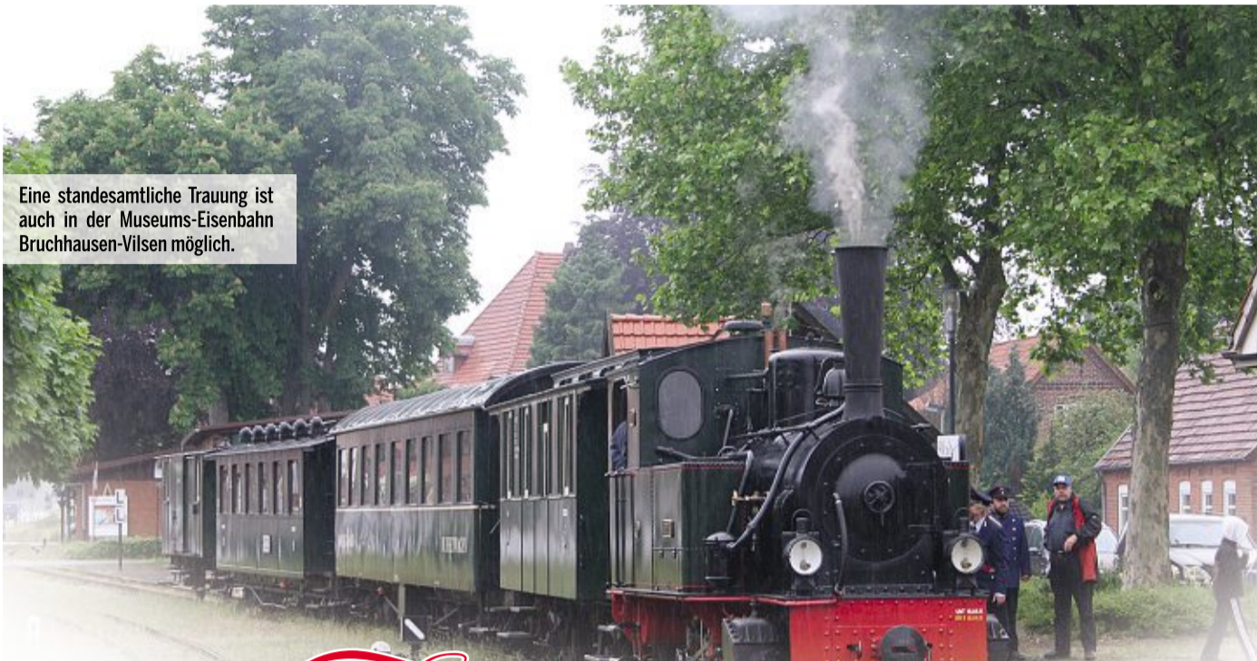
Eine standesamtliche Trauung ist auch in der Museums-Eisenbahn Bruchhausen-Vilsen möglich.