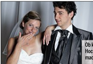
Ob klassisch oder ausgefallen – Hochzeitsfotos sollte man vom Profi machen lassen.