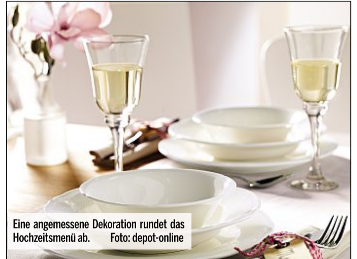
Eine angemessene Dekoration rundet das Hochzeitsmenü ab.

gegenüber zu kommunizieren – so kann die Küche ihre Zeitplanung entsprechend gestalten. Zudem will die Dekoration gut gewählt werden: Ein komplett ungeschmückter Tisch wirkt selbstverständlich wenig feierlich, doch bei zu viel Dekoration kann es für Gäste mitunter schwierig werden, an Weinkaraffen oder Saucieren zu gelangen. lps/jk