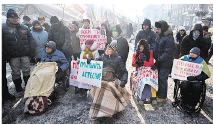
Behinderte Bürger demonstrieren in Kiew friedlich gegen die Regierung und fragen: „Wollt Ihr uns auch erschießen?“

rung wollten weiter nach einer politischen Lösung suchen. Derweil standen sich erneut gewaltbereite Regierungsgegner und Polizeikräfte gegenüber. Demonstranten halten in verschiedenen Städten verschiedene staatliche Einrichtungen besetzt. Die offizielle Zahl der bei Straßenschlachten Getöteten wird bisher mit drei angegeben.