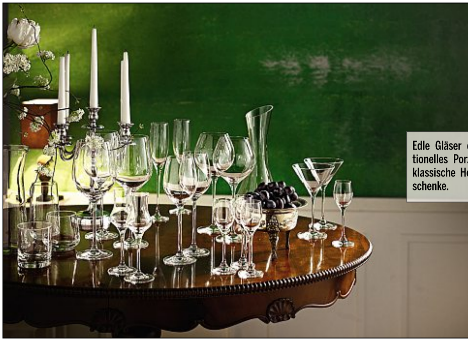
Edle Gläser oder traditionelles Porzellan sind klassische Hochzeitsgeschenke.