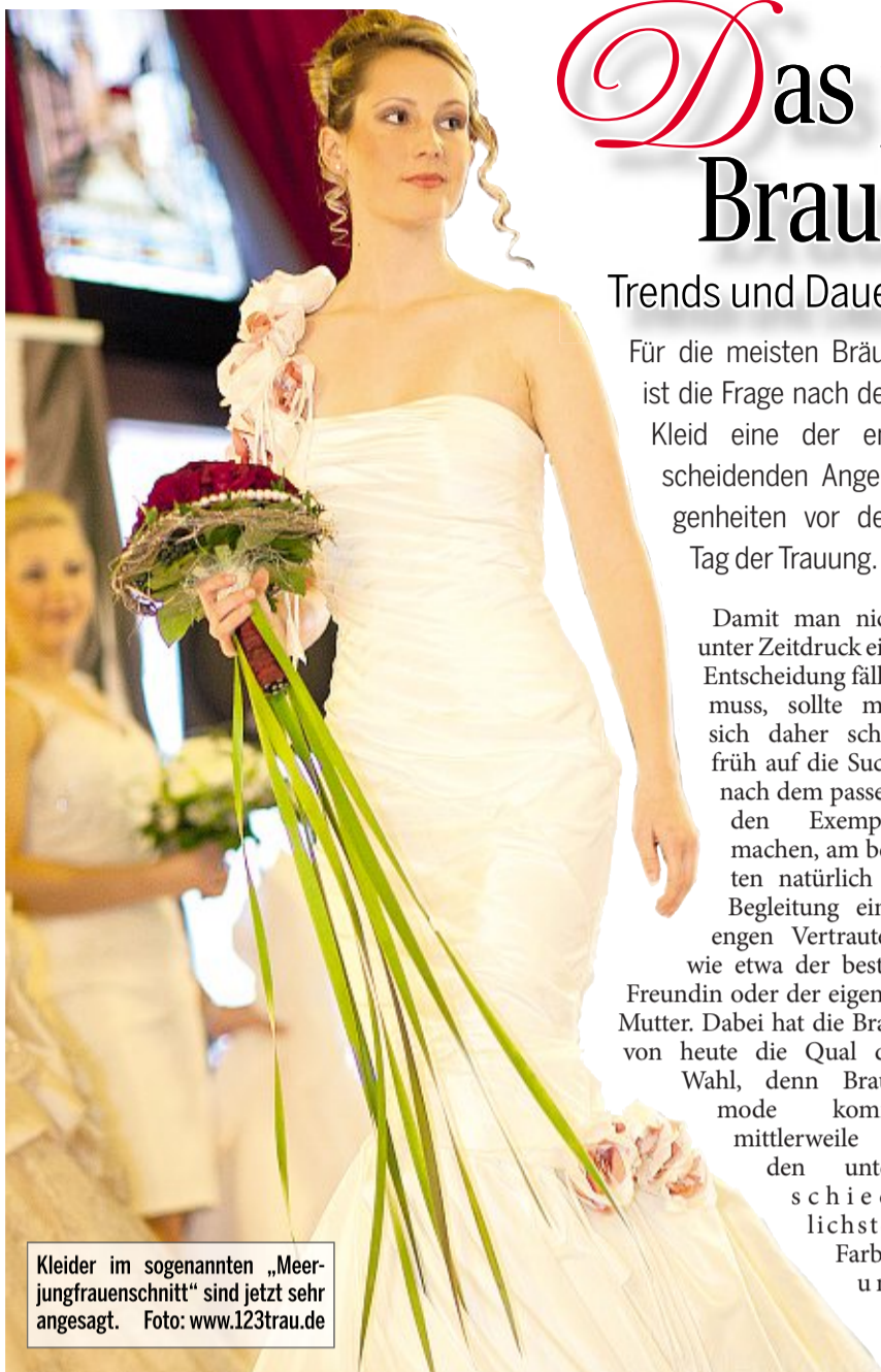
Kleider im sogenannten „Meerjungfrauenschnitt“ sind jetzt sehr angesagt.