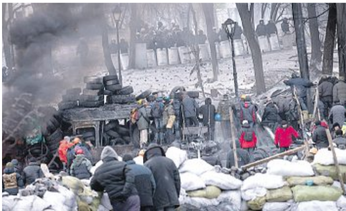
Gewaltbereite Demonstranten lieferten sich auch gestern Straßenschlachten mit Polizeikräften.

Wo die Zeit auf der Heimbahn am Königssee genau verloren ging, konnte sich niemand erklären. Friedrich vermutete die „Fahrlinie“, Co-Bundestrainer Rene Spies wählte seine Piloten „mit dem Kopf schon bei Olympia“, Florschütz überlegte laut, ob er „zu viel trainiert“ habe.