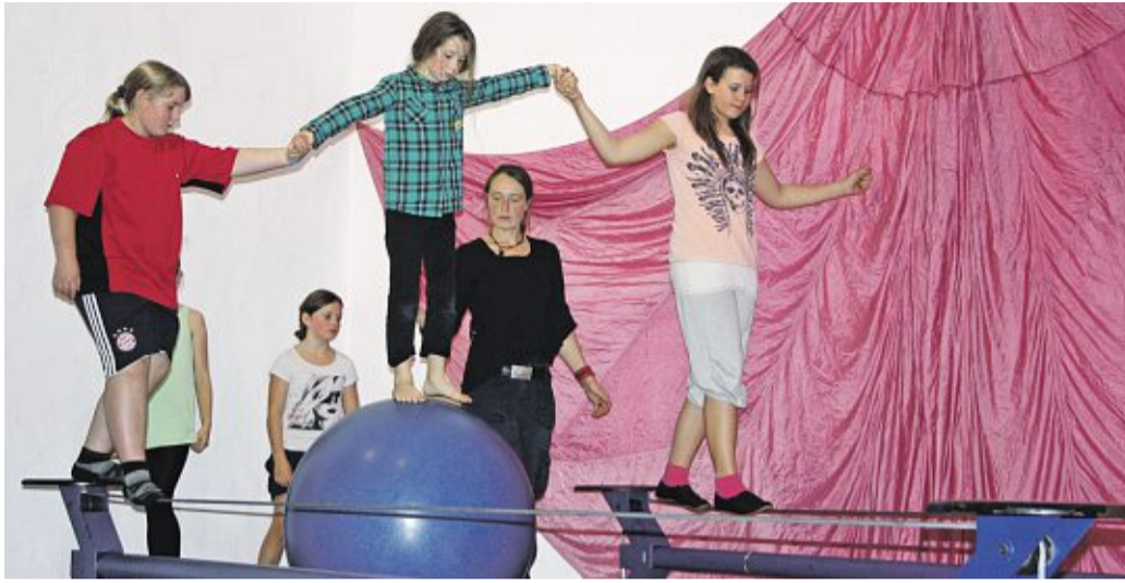
Gekonnte Dreier-Kombination: Kugelball- und Seillaufen.