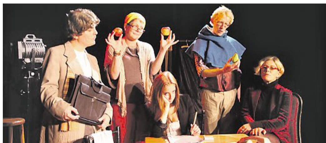
„Die Spielverderber“ treten mit ihrem neuen Stück mehrfach im Kulturwerk auf.

Karten sind noch erhältlich an der Theaterkasse im Stadtkontor, Kirchplatz 4 in Nienburg, Telefon (0 50 21) 8 72 64 und 8 73 56, Fax (0 50 21) 8 75 83 56, per E-Mail unter theaterkasse@nienburg.de und theater.abendkasse@nienburg.de sowie im Internet unter www.theater.nienburg.de . „Last-Minute-Theater-Tickets“ für junge Leute (16 bis 25 Jahre) gibt es für nur fünf Euro ab 30 Minuten vor Beginn an der Kasse im Theater. DH