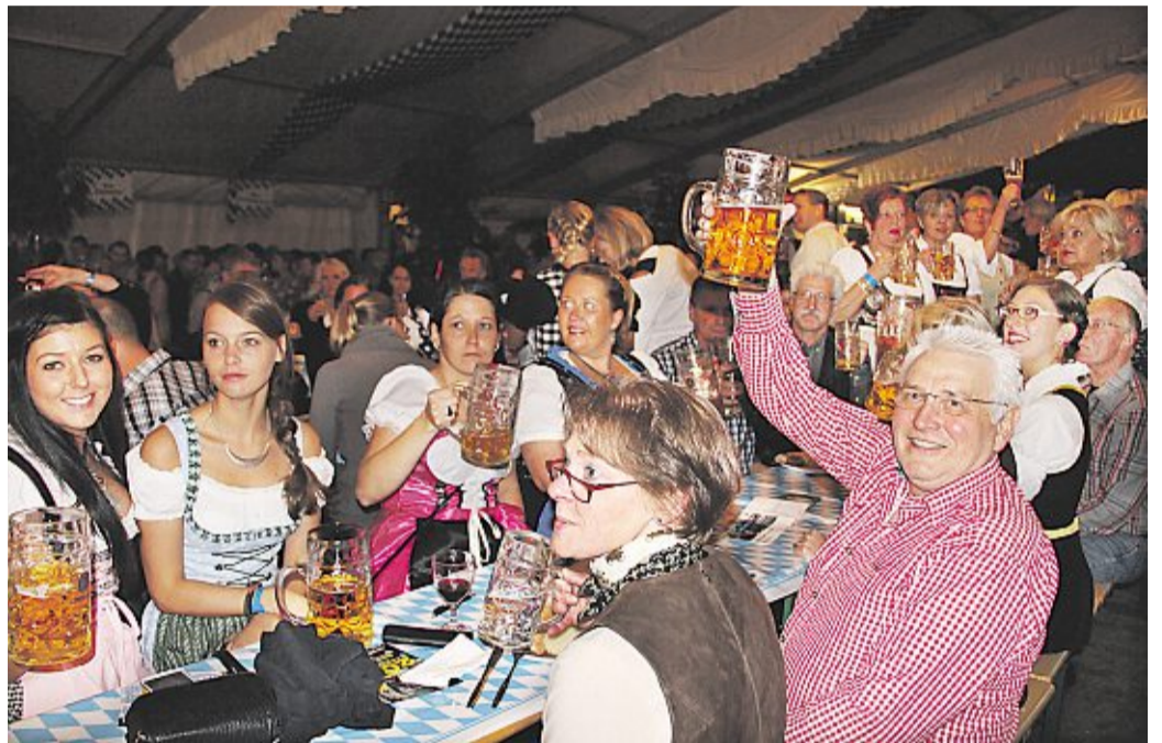
Eins, zwei g'suffa: Die Stimmung war gut bei der Weser Wies'n 2012.