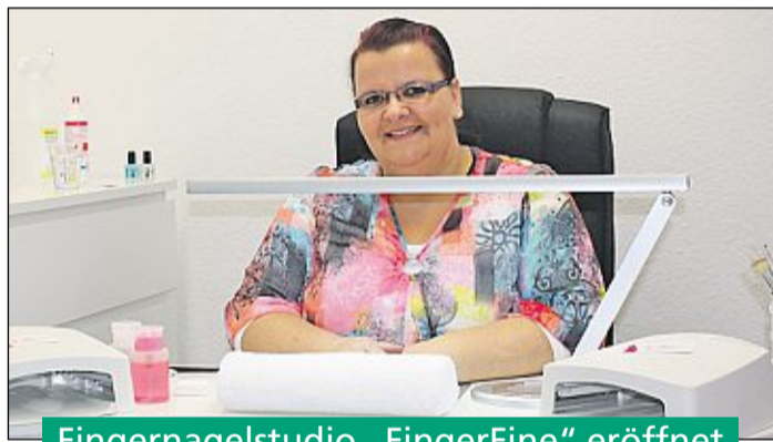
Fingernagelstudio „FingerFine“ eröffnet

Bewegungsspiele. Auch eine Tombola mit zahlreichen Preisen durfte selbstverständlich nicht fehlen. Die Erwachsenen kamen ebenfalls nicht zu kurz und konnten Herbstdekorationen, Handarbeiten und mehr bewundern und erwerben. Für das leibliche Wohl war mit einem reichhaltigen Kuchenbuffet und dem Bratwurststand gesorgt. Die Erlöse aus dem Essen- und Getränkeverkauf kommen wie in jedem Jahr direkt dem Linsburger Kindergarten zu Gute. Die Organisatoren vom Verein zur Förderung des Kindergartens Meilenstein e.V. freuen sich über eine rundum gelungene Veranstaltung und danken allen Beteiligten für die tatkräftige Unterstützung.