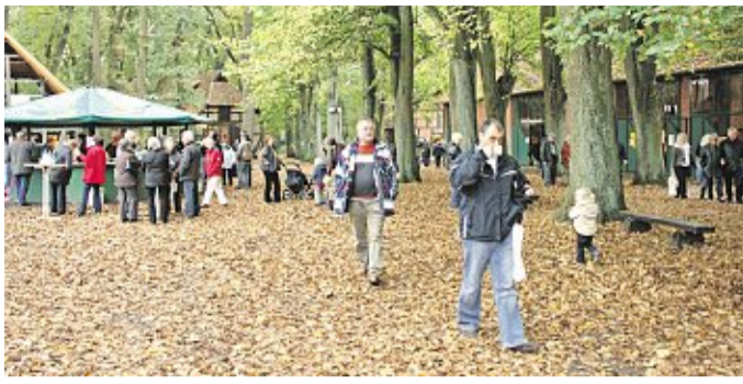
Am kommenden Freitag beginnt der Herbstmarkt in Estorf.

Am 30. Oktober ist der Kreislandfrauentag im Landgasthaus Okelmann in Warpe. Das bunte Rahmenprogramm gestalten alle sechs Landfrauenvereine des Kreises gemeinsam. Nach dem Abendessen hält Beate Recker aus Wetschen einen Vortrag zum The-