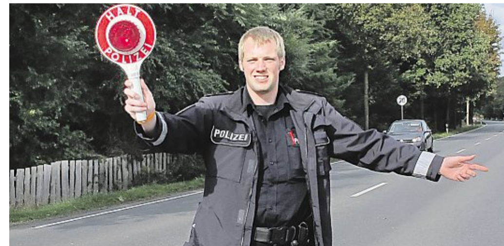
Knapp 800 Fahrzeuge wurden an den zuvor öffentlich gemachten Messstellen kontrolliert. Polizei

Mit 46 Beamten und Beamtinnen beteiligte sich die Polizeiinspektion Nienburg/Schaumburg an den bundesweiten Geschwindigkeitskontrollen. Knapp 800 Fahrzeuge wurden an den zuvor öffentlich gemachten Messstellen kontrolliert. Mit der Laserpistole mussten 103 Geschwindigkeitsverstöße festgestellt werden. 84 davon lagen im Verwarnungsbereich bis 35 Euro und 25 im Bußgeldbereich. „Ist ein Autofahrer mindestens 21 Stundenkilometer zu schnell, muss er mit einem Bußgeldbescheid rechnen“, ergänzt die Pressespre-