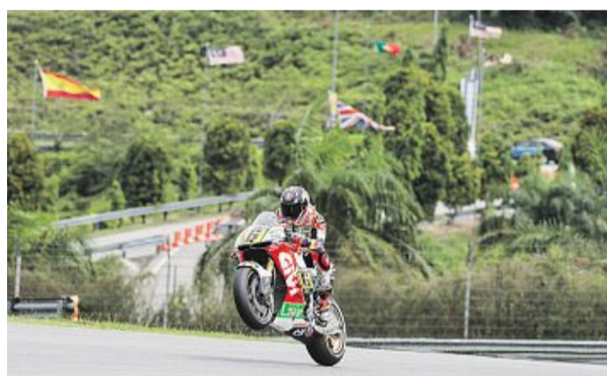
Stefan Bradl wird in Malaysia nicht an den Start gehen.

SEPANG (sid). Motorrad-Pilot Stefan Bradl ist im vierten freien Training zum Großen Preis von Malaysia in Sepang schwer gestürzt und hat sich den Knöchel gebrochen. Der Zahlhänger klemmte sich in der letzten Session vor dem Qualifying der MotoGP seinen Fuß unter seinem wegrutschenden Motorrad ein und wurde danach auf der Bahre abtransportiert.