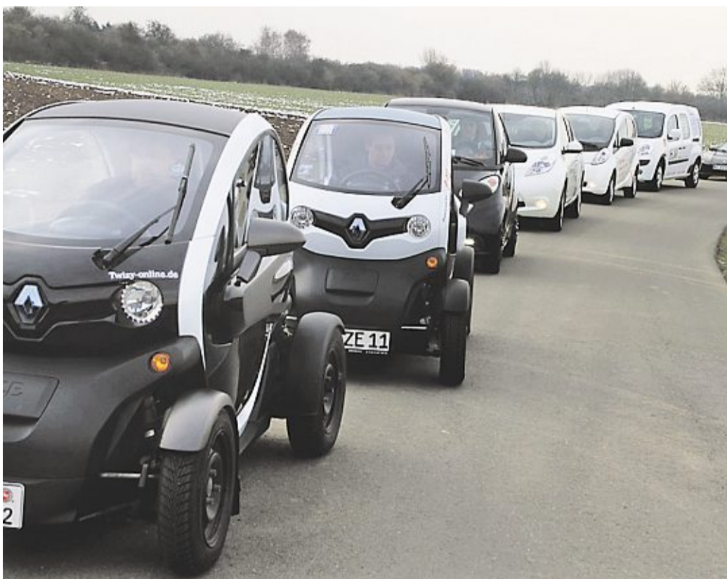
Lautlos unterwegs: Das 1. Elektromobilistentreffen findet am kommenden Wochenende an Deutschlands ältester Solartankstelle in Steyerberg statt.

Zum Abschluss der Veranstaltung startet am Sonntag die Sternfahrt zur Autoschau Nienburg zum Stand der Arbeitsgemeinschaft Mobilität. Bei dieser regionalen Wirtschaftsschau aller Autohäuser aus dem Landkreis Nienburg/Weser wird es zum zweiten Mal eine Sonderausstellung zum Thema „Elektromobilität zum Selbst-(er)fahren“ geben. Um 10 Uhr wird der