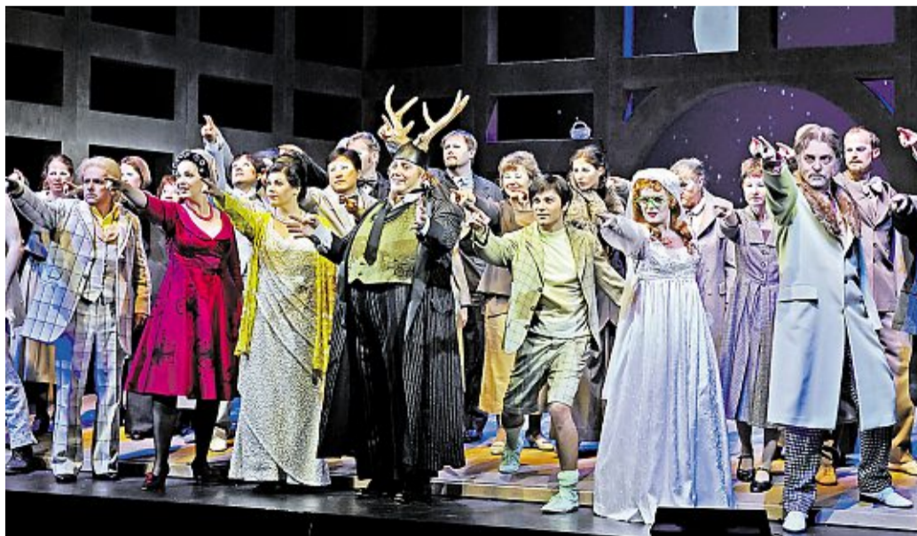
Das Theater für Niedersachsen (TfN) wird am 24. Oktober die Komische Oper „Falstaff“, von Giuseppe Verdi im Nienburger Theater zeigen. Es sind noch Karten erhältlich.