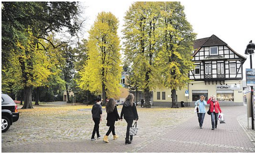
Wird der Platz rund um den Springbrunnen zu Ehren des Nienburger Ehrenbürgers in Ernst-Thoms-Platz umbenannt? Am Donnerstag berät der Bauausschuss. Hagebölling

Holtorf. Am Dienstag, 15. Oktober, finden im Holtorfer Kreisel/Verdener Landstraße Asphaltarbeiten statt. Der Kraftfahrzeugverkehr wird mit einer mobilen Lichtsignalanlage an der Baustelle vorbeigeführt. Das Einfahren in den Kreisel aus den Nebenrichtungen Hoyaer Straße und Wölper Straße ist nicht möglich. Kraftfahrer sollen den Umleitungsbeschilderungen folgen. Mit Verkehrsbehinderungen muss gerechnet werden. DH