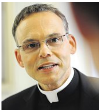
Bischof Dr. Franz-Peter Tebartz-van Elst.

LIMBURG. Meldungen zufolge wollte der umstrittene Limburger Bischof Franz-Peter Tebartz-van Elst gestern eigentlich zu Gesprächen über die Situation in Limburg nach Rom fliegen. Den geplanten