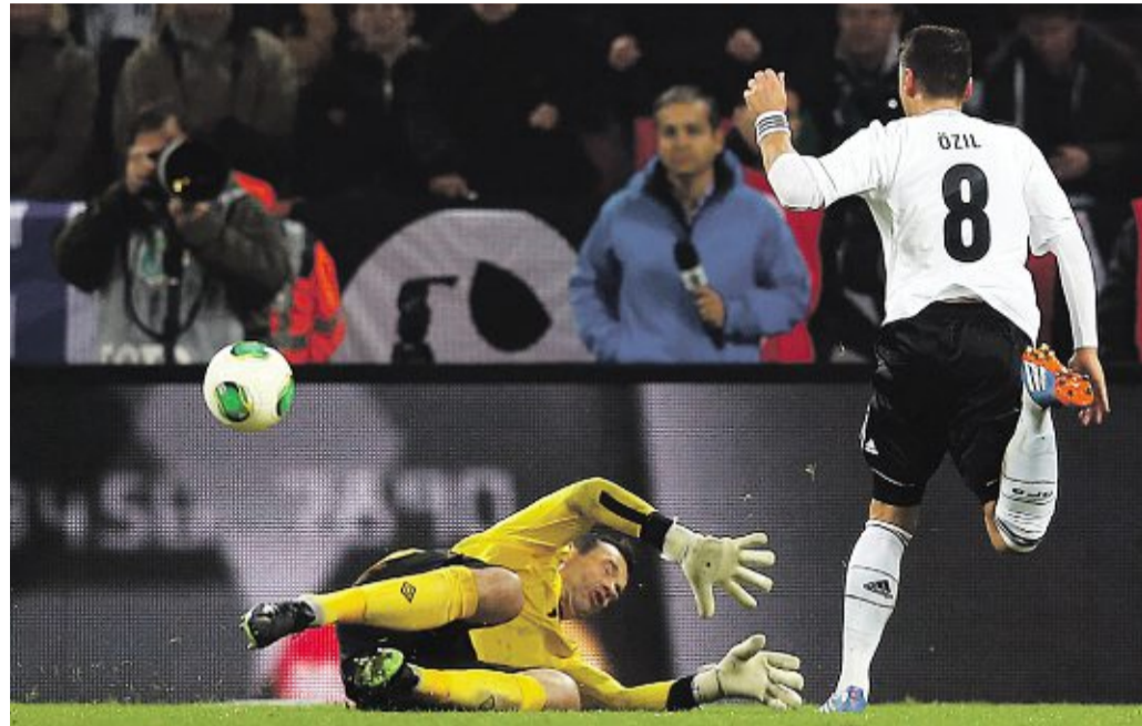
Mesut Özil (rechts) schoss das dritte Tor der DFB-Auswahl.

„Nach der Halbzeit sind wir ein wenig fahrlässig aus der Kabine gekommen und haben in ein, zwei Situationen nicht so gut ausgesehen. Ein bisschen muss noch passieren bis zur WM, ich sehe da zwei Schwerpunkte: Wir müssen die Defensive weiter stabilisieren und das Spiel im letzten Drittel“; sagte Löw. Spitzennationen wie Brasilien, Spanien oder Italien, am 15. November in Mailand im 100. Länderspiel von Löw ein echter Gradmesser für die DFB-Auswahl, hätten die Fehler der deutschen Defensive wohl gnadenlos bestraft.