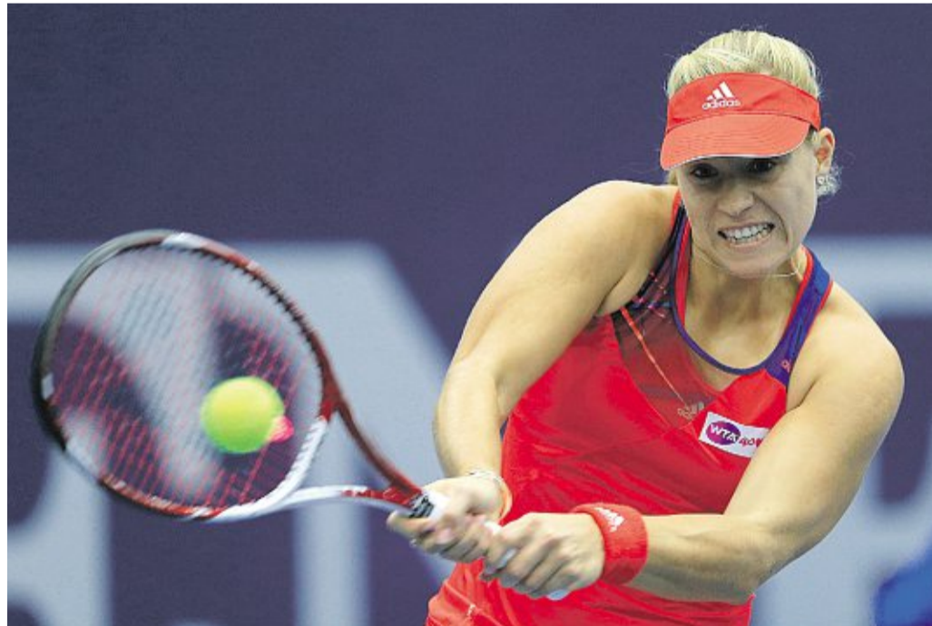
Angelique Kerber ist Weltranglisten-Zehnte.