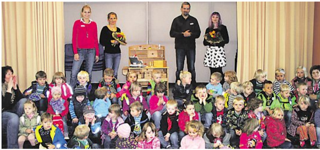
Preisverleihung in der VHS-Aula: Jurymitglieder und Mitarbeiter des Familienservicebüros zusammen mit den Kindern der Kita „Sonnenstrahl“ aus Warmßen.