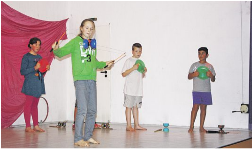
Diabolo-Tricks“ nennen die Zirkuspädagogen diese Übung.