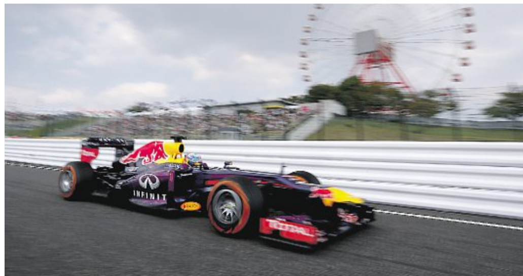
Sebastian Vettel kann heute zum vierten Mal in Folge Weltmeister werden.

kämpfen morgen jeder für uns selbst. Er hat einen sehr großen Vorsprung, und es ist ja auch nicht das letzte Rennen.“