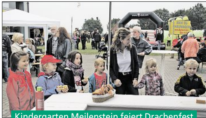
Kindergarten Meilenstein feiert Drachenfest

Bereits zum siebten Mal veranstaltete der Förderverein des Kindergartens Meilenstein auf dem Gelände der Firma Eberstein bei sonnigem Herbstwetter ein Drachenfest, das wieder zahlreiche Besucher aus Linsburg und Umgebung lockte. Für die Kinder wurden gegen einen kleinen Unkostenbeitrag verschiedene Bastelaktionen – z.B. Herbstdekorationen oder auch für die Kleinen leicht zu bauende Drachen – angeboten. Direkt am Veranstaltungsgelände lud eine Wiese dazu ein, die selbstgebastelten Drachen gleich steigen zu lassen. Für Spaß und Unterhaltung sorgten neben dem Kinderschminken eine Hüpfburg und weitere