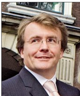
Prinz Friso ist verheiratet und hat zwei Töchter im Alter von sechs und sieben Jahren.

und das Behandlungsteam ist nach wie vor sehr besorgt. Es wird noch viele Monate dauern, bis mehr Klarheit besteht“, informierte die Königliche Familie im November.