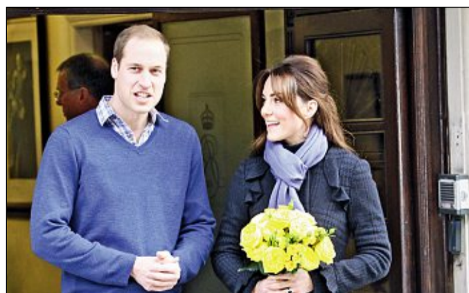
„Erfreut über die Neuigkeiten“, zeigte sich die königliche Familie: Prinz William und Kate erwarten Nachwuchs.

wealth. Viel spekuliert wurde dabei, wann Prinz William und seine Frau Kate wohl Nachwuchs ankündigen würden. Am 3. Dezember war es dann endlich soweit. Da die Herzogin von Cambridge aber an einer besonders schweren Form von Schwangerschaftsübelkeit leidet, musste sie einige Tage im Krankenhaus verbringen. Dabei kam es zu einem tragischen Vorfall: Eine Krankenschwester nahm sich nach einem Telefonstreik von australischen Radiomoderatoren das Leben.