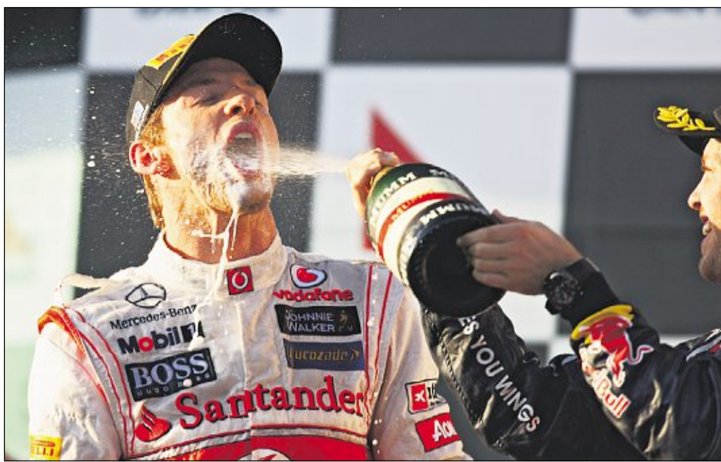
Wer feiert 2013? Im abgelaufenen Jahr durfte Jenson Button den ersten Siegersekt genießen. Am Ende aber triumphierte Sebastian Vettel (rechts), der nun seinen vierten Titel in Folge anpeilt.

Ganz nach oben strebt jedenfalls wieder Sebastian Vettel. Nur knapp dreieinhalb Jahre dauerte es vom ersten Start in der Formel 1 am 17. Juni 2007 in Indianapolis bis zum ersten WM-Titel am 14. November 2010 in Abu Dhabi. Zwei weitere folgten. Und 70 Prozent der deutschen Bevölkerung glauben laut einer Umfrage daran, dass der Heppenheimler sogar die sieben Titel seines zurückgetretenen Vorbildes Michael Schumacher übertrifft. Start der neuen Saison ist am 17. März in Melbourne, spätestens beim Finale am 24. November wird die Entscheidung fallen. Fest steht dagegen noch nicht, ob der Große Preis von Deutschland am 7.