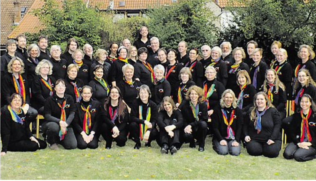
Am Sonnabend, 1. Juni 2013, um 19 Uhr findet auf dem Nienburger Kirchplatz ein großes Open Air mit dem Gospelchor St. Martin (Foto) und der berühmten Sängerin Kathy Kelly statt.