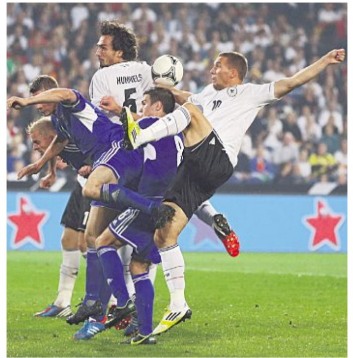
„Gruppenkuscheln“ mit Mats Hummels (Mitte) und Lukas Podolski (rechts): Die deutsche Fußball-Nationalmannschaft startet mit dem 500. Sieg ihrer Länderspiel-Geschichte in die Qualifikation zur WM 2014 in Brasilien. Mit 3:0 gegen die Färöer gewinnt das Team vor 32.769 Zuschauern in Hannover.