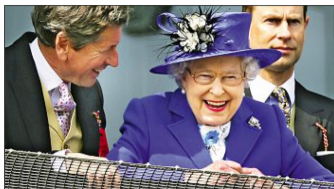
Beim Epsom Derby am 2. Juni, dem Start der Feierlichkeiten zum Thronjubiläum, zeigte sich eine strahlende Königin.