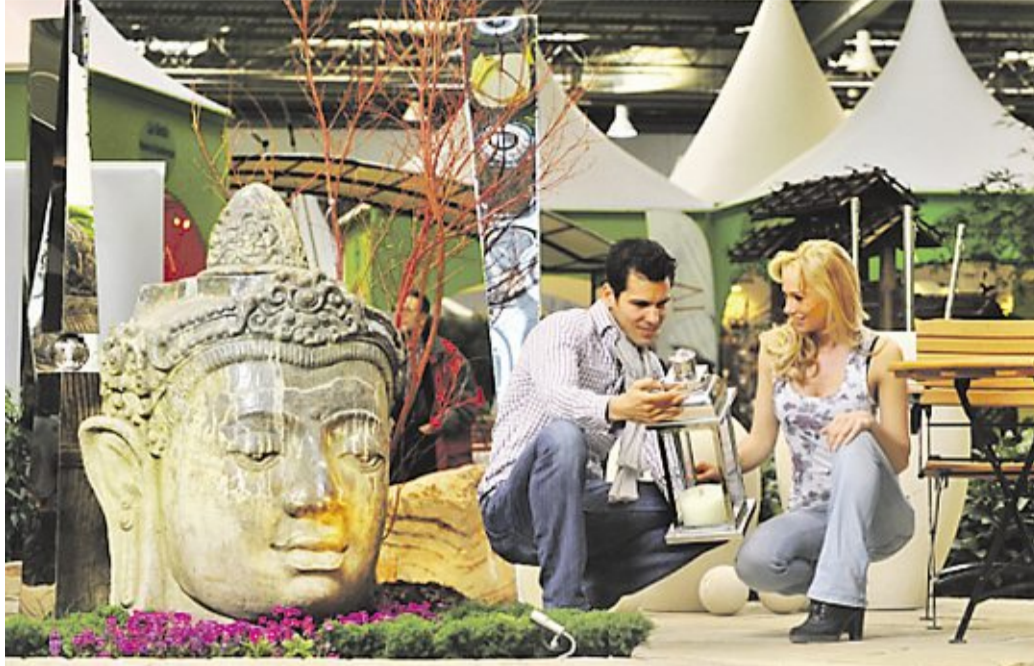
„Garten und Ambiente“ lautet das Thema in einer der acht ABF-Messehallen.