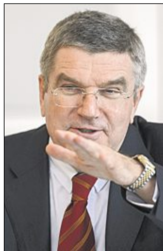
Thomas Bach auf dem Weg ganz nach oben.

Thomas Bach neuer IOC-Präsident? Sebastian Vettel zum vierten Mal in Folge Formel-1-Weltmeister? WM-Medaillenflut im alpinen und nordischen Ski, im Biathlon, in der Leichtathletik oder im Schwimmen? Auch im Zwischenjahr ohne Olympia, Fußball-WM oder -EM verspricht der Sport 2013 viele Höhepunkte mit zahlreichen deutschen Hauptdarstellern. Rund 60 Welt- und 50 Europameisterschaften stehen auf dem Programm.