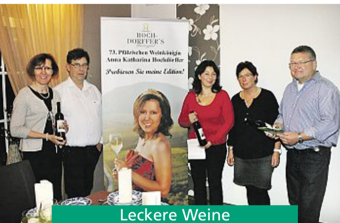
Leckere Weine in neu gestalteten Gasträumen