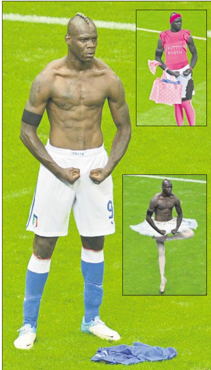
Auch wenn es aus deutscher Sicht schmerzt: Die Jubelpose von Mario Balotelli im EM-Halbfinale der Italiener gegen die DFB-Elf ist sicher eines der Sportfotos des Jahres. Immerhin inspirierte der Skandalkicker mit seinem Muskelspiel Tausende User im Internet zu unterhaltsamen Abwandlungen wie „Prima-Balotelli“ oder „Shoppitelli“.