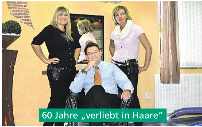
60 Jahre „verliebt in Haare“